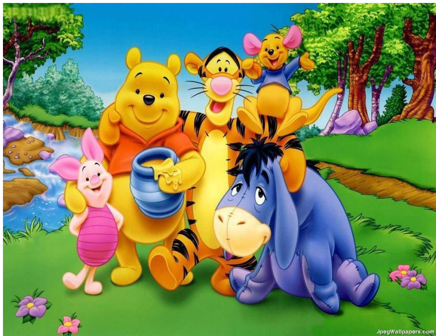
Винни пух и его друзья