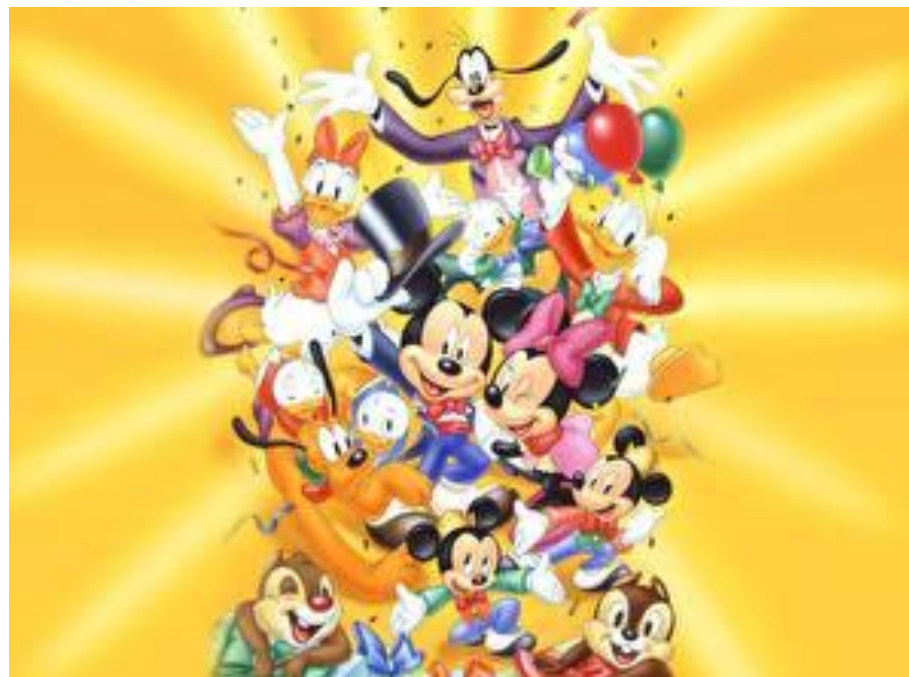
Микки Маус и его друзья