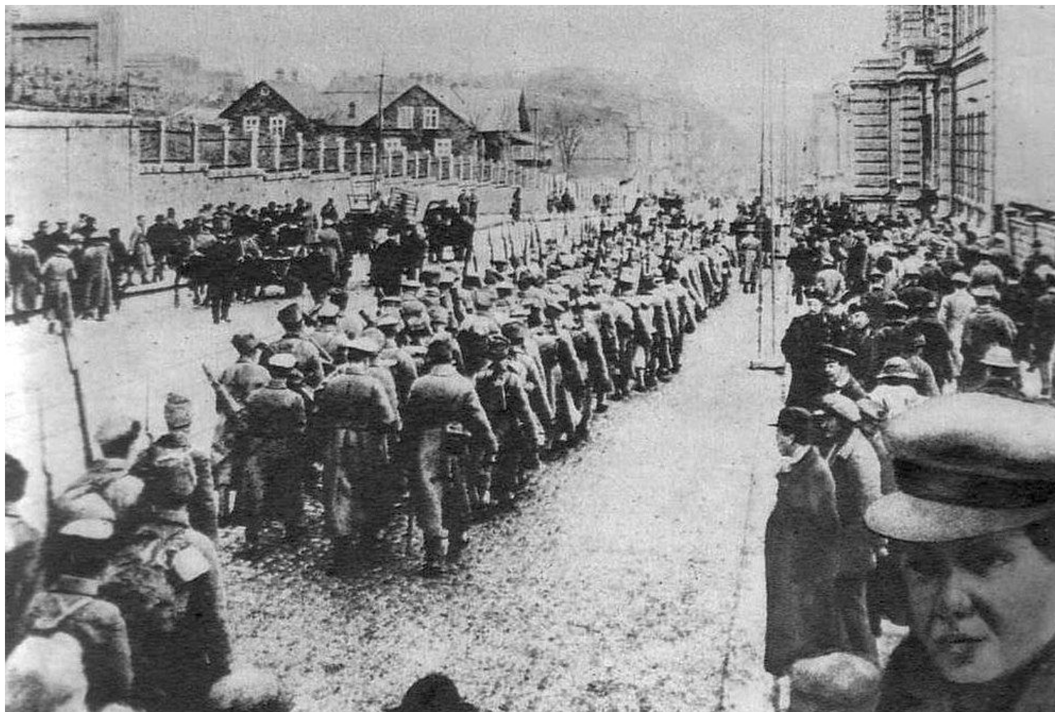
Фото 2. Чехословаки во Владивостоке. 1918 год 1