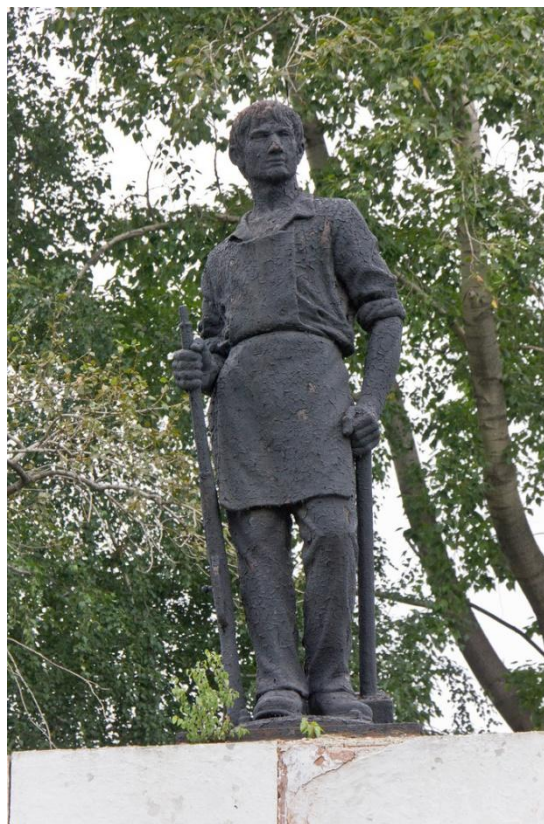
Фото 5. Памятник на месте боя с белочехами в мае 1918 года 1