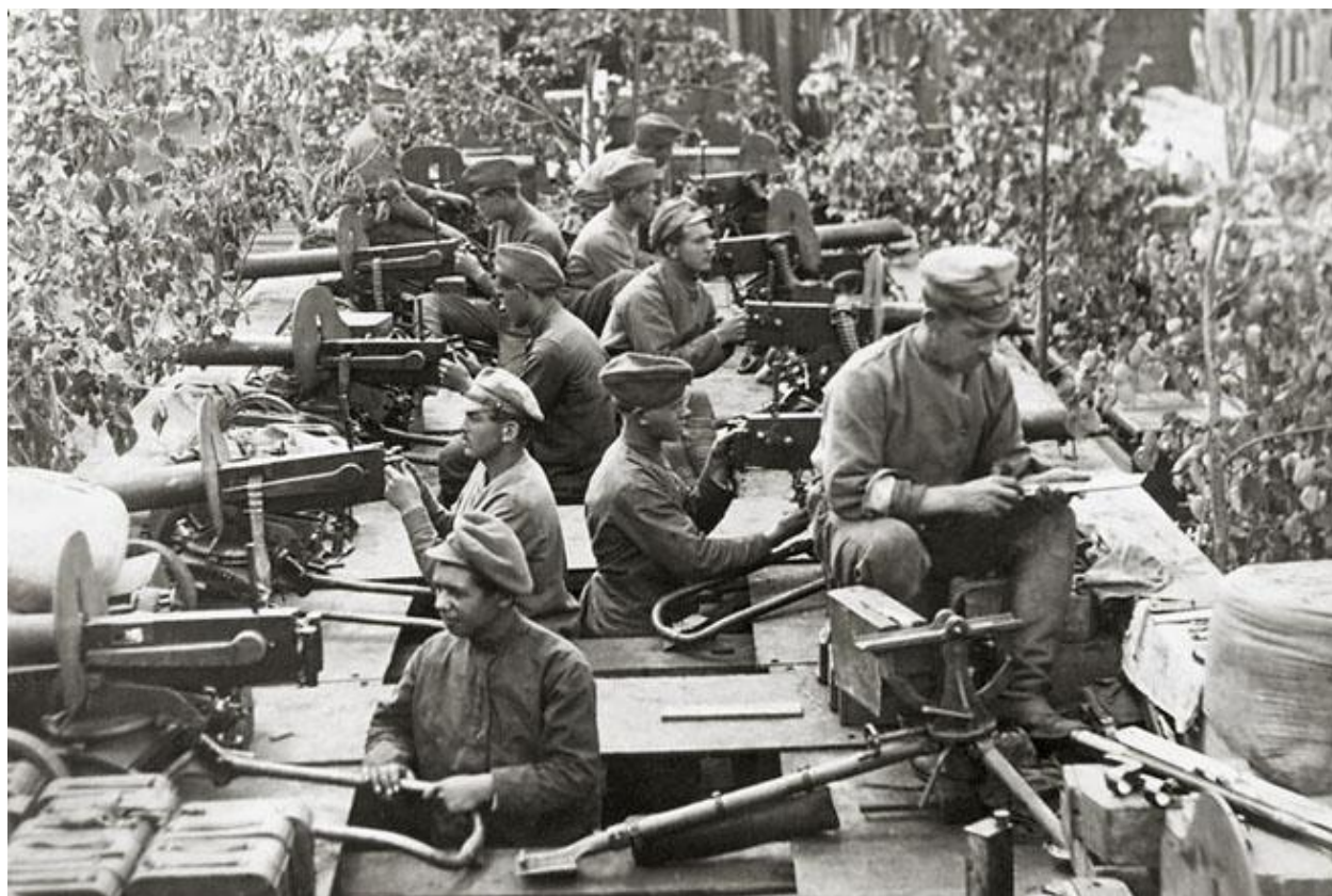
Фото 1. Бронепоезд «Орлик». Пензенская группировка чехословаков. Уфа, июль 1918 года. 1