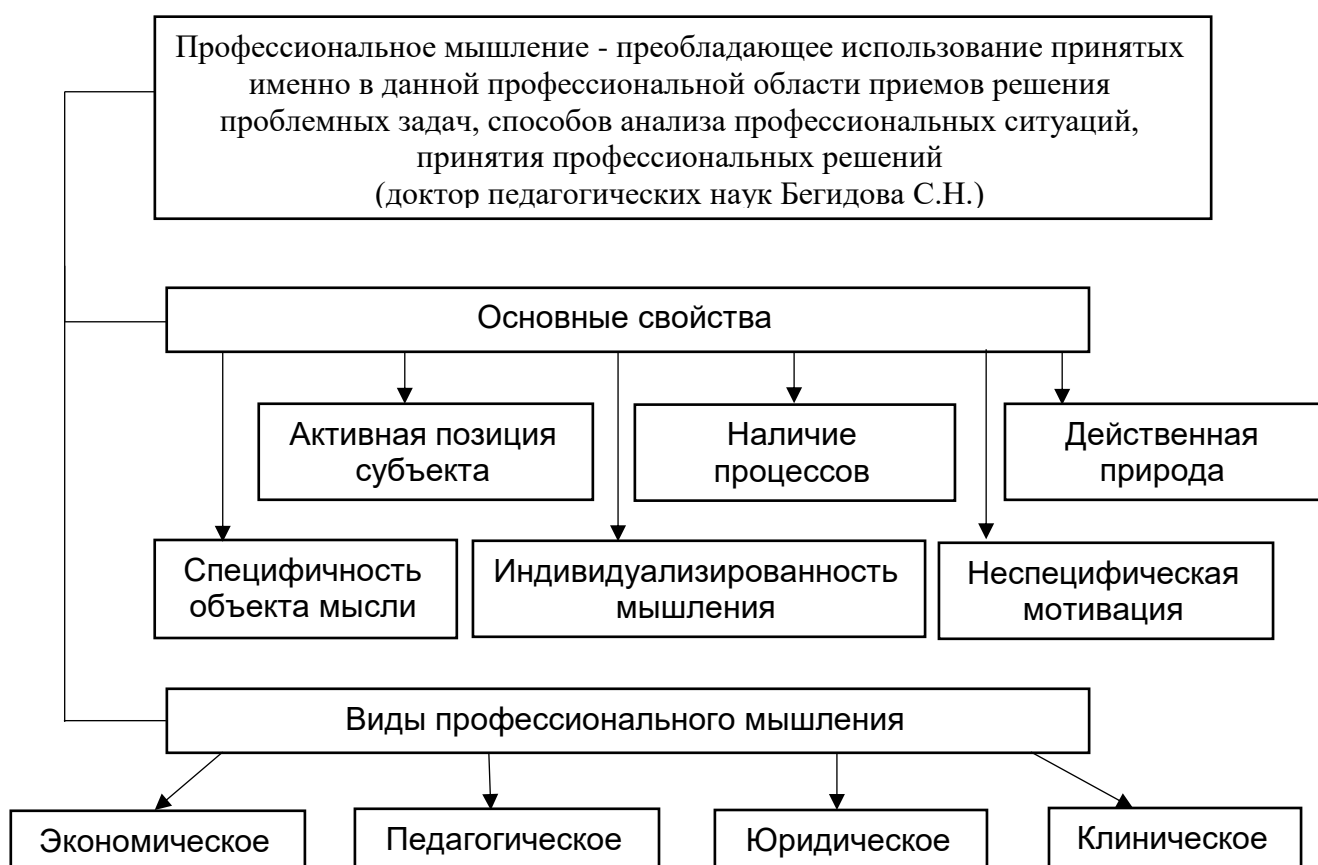
Рис. 2. – Свойства и виды профессионального мышления

Поскольку в выпускной квалификационной работе мы будем рассматривать методы развития профессионального мышления на примере дисциплины «Экономика организации», считаем необходимым охарактеризовать особенности профессионального мышления экономиста (экономическое профессиональное мышление).