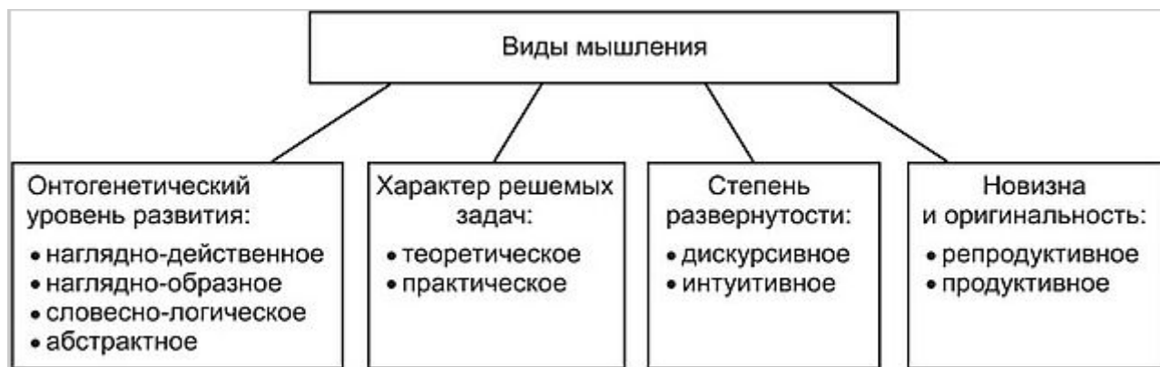
Рис. 1. – Основные виды мышления

В психологии принята следующая, несколько условная классификация видов мышления по таким различным основаниям как: онтогенетический уровень развития, характер решаемых задач, степень развернутости, новизна и оригинальность (рисунок 1.).