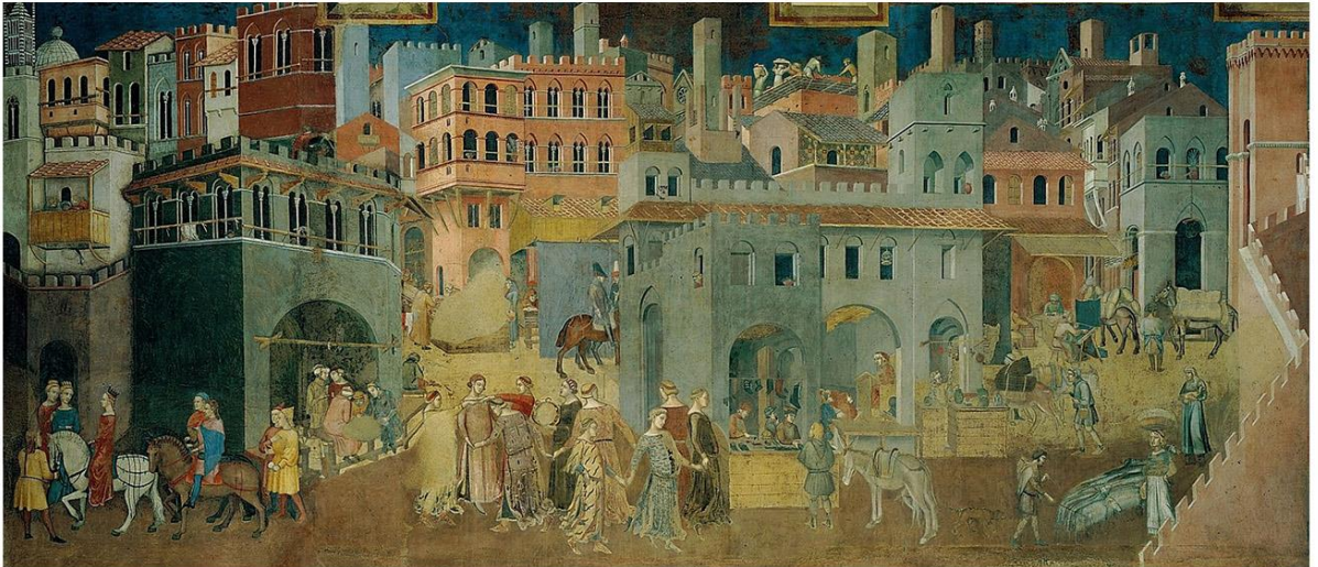
Амброджо Лоренцетті. Плоды доброго правління. Фреска. 1337-1339. Палаццо Пуббліко, Сієна

Амброджо Лоренцетти. Плоды доброго правления. Фреска. 1337-1339. Палаццо Пубблико, Сиена