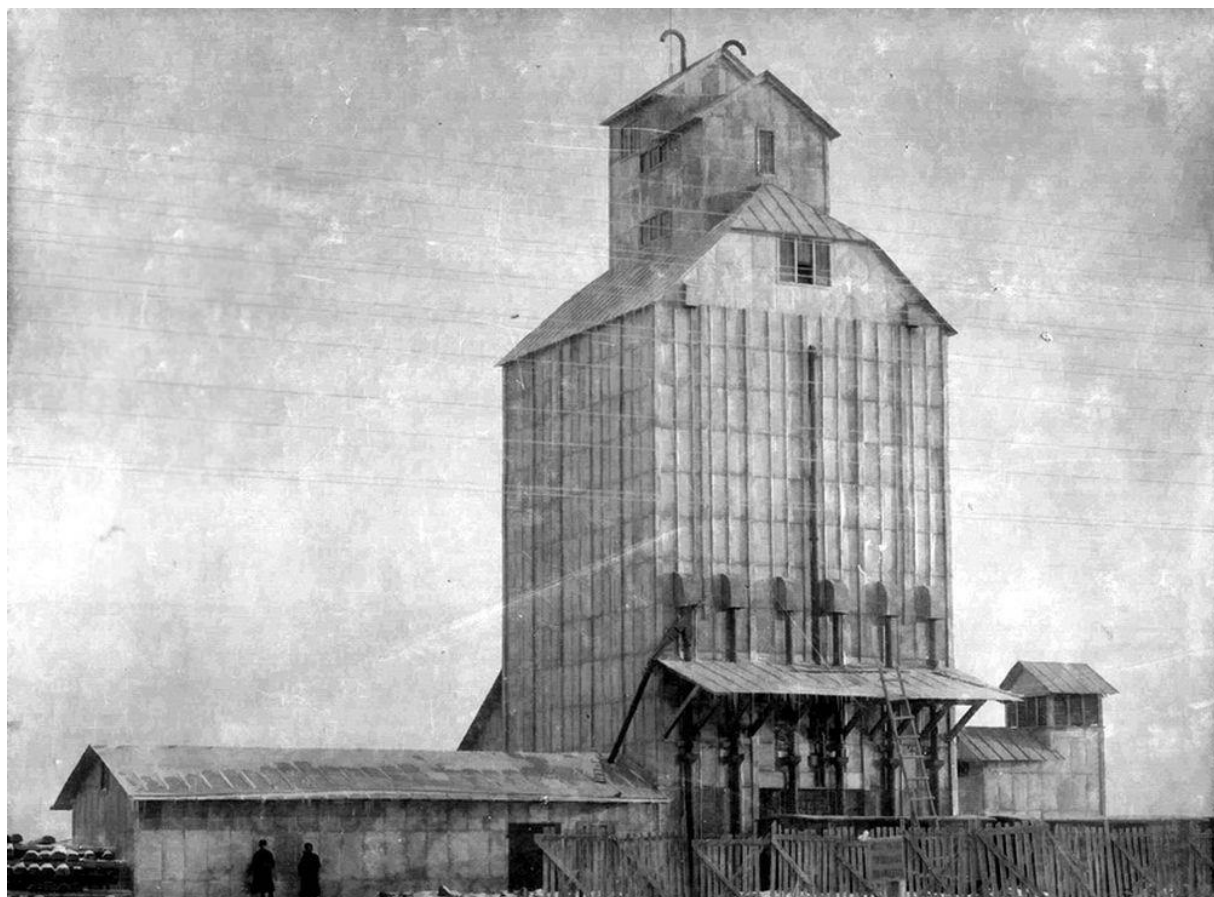
Зерновой Элеватор. Варгаши 1920 г