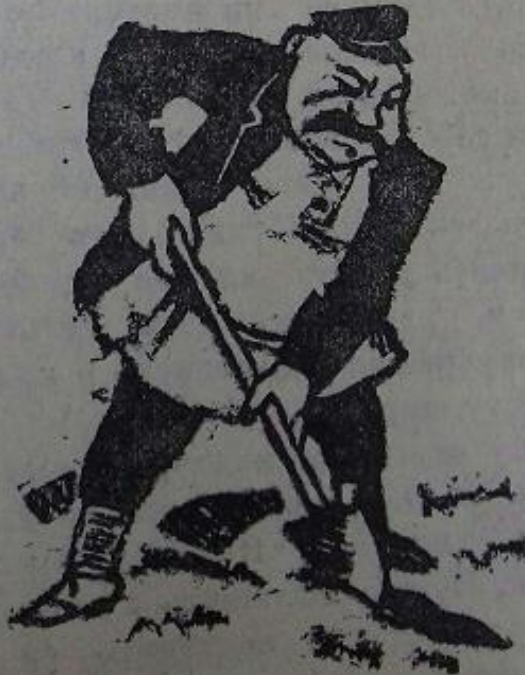
Заметка из газеты «Красный Курган» 1929 г