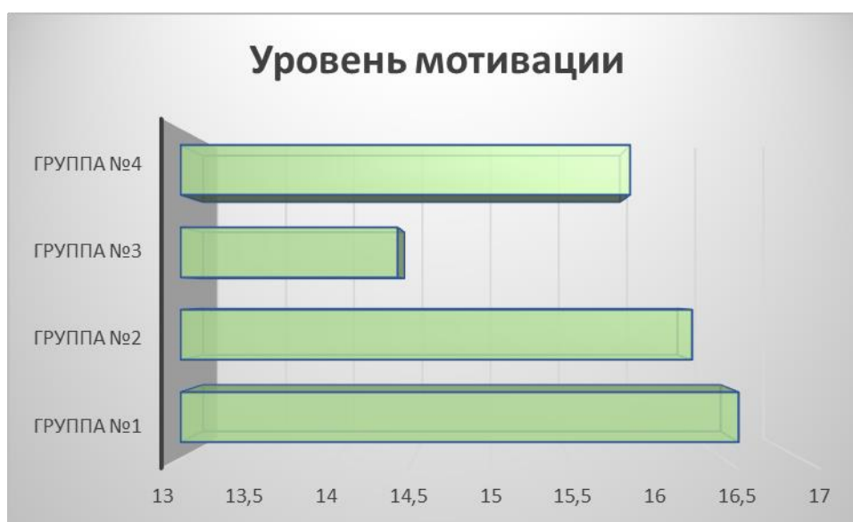
Рисунок 2 «Уровень мотивации по методике Т. Элерса»

Для отображения результатов были вычислены средние значения баллов по исследованным группам (рисунок 2).