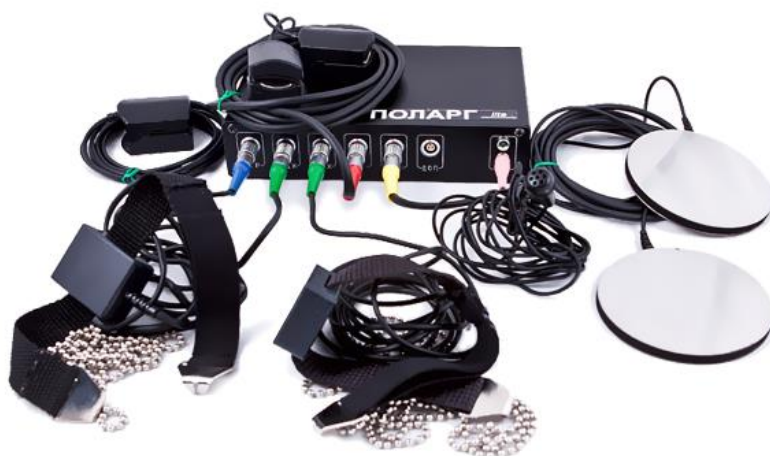
Рис. 3 Компьютерный полиграф «Поларг»