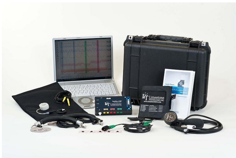
Рис. 1 Современный полиграф.