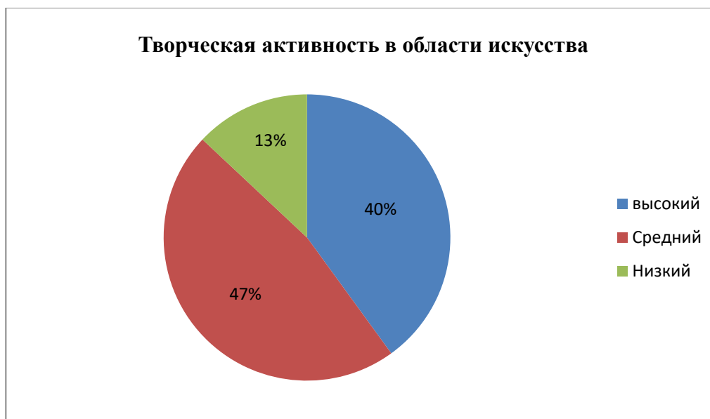
Рисунок 3 – Творческая активность в области искусства

человек) и низким – 13% (4 человека). Данные представлены в диаграмме на рисунке 3.