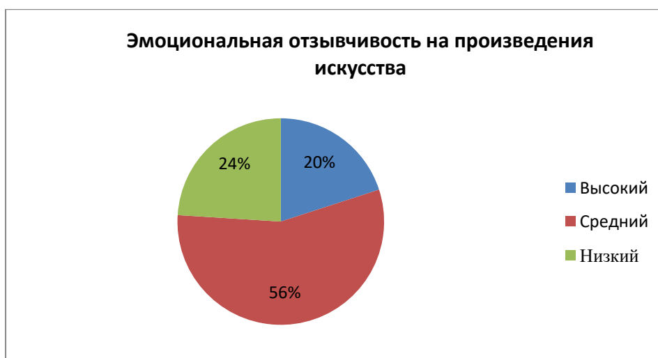
Рисунок 1 – Эмоциональная отзывчивость на произведения искусства

– Второй критерий – осведомленность в области искусства и мотивация в получении эстетических знаний. Включает в себя запас определенных знаний и впечатлений, без которых не может возникнуть интересы и склонности к эстетическим предметам и явлениям. Для диагностики этого критерия мы использовали метод тестирования по вопросам знаний в области искусства (Приложение 2). Цель тестирования – определить степень информированности в области искусства, готовность к оценке эстетических явлений в окружающей среде, мотивацию к развитию в области эстетических знаний. Данный показатель мы также рассмотрели по уровням (Таблица 5).