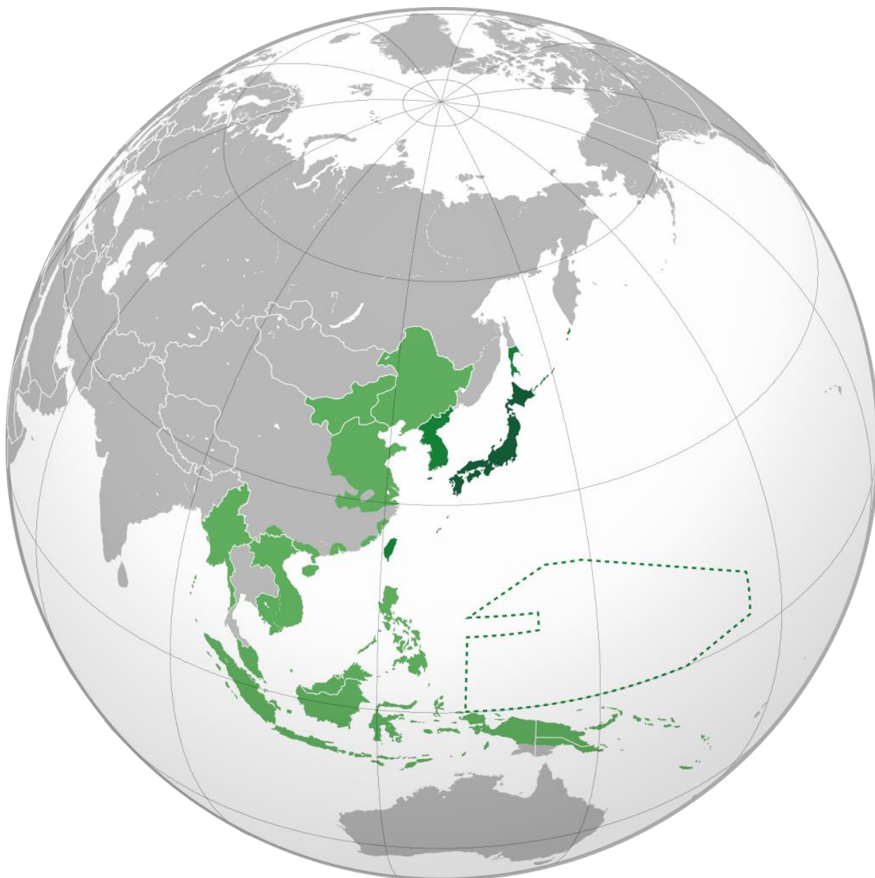
Карта 1. Японская империя в 1942 году 1 :