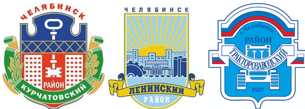
Рисунок 1 – Гербы районов города Челябинска