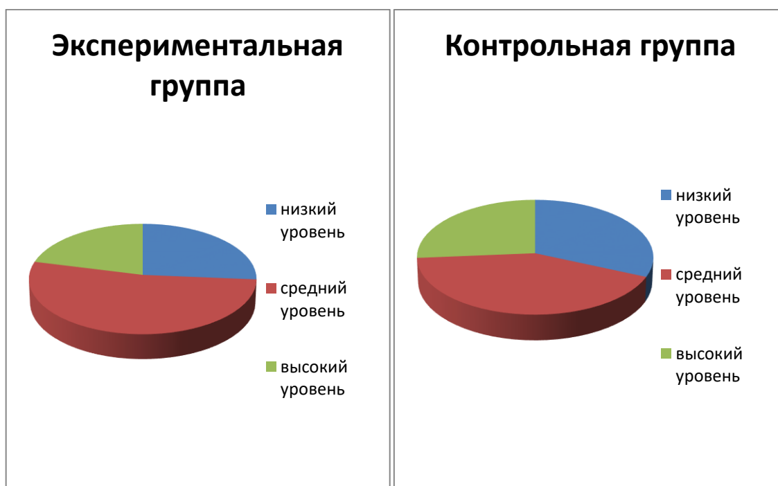
Рисунок 1- Результаты констатирующего эксперимента

Для большей наглядности полученные результаты на этапе констатирующего эксперимента представлены на рисунке 1.