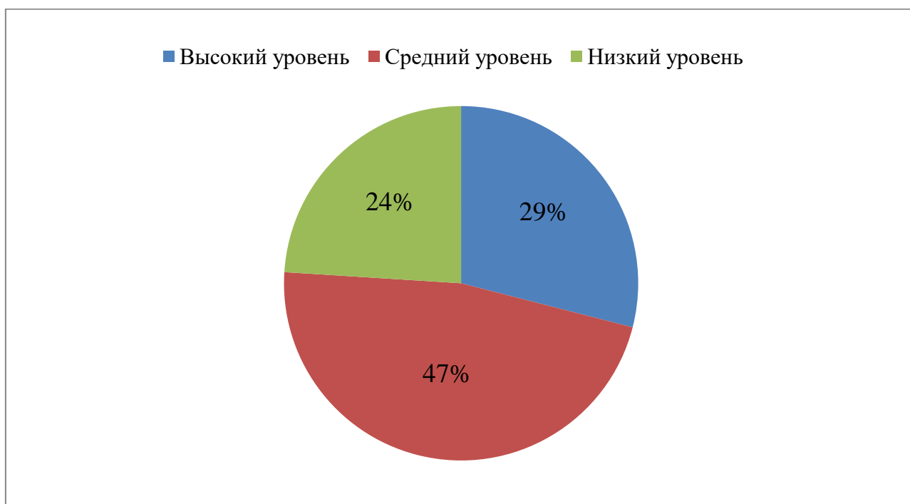
Рисунок 2 – Уровни восприятия поэтического текста после проведения урока литературного чтения с использованием музыкальных произведений

У 24% детей восприятие поэтического текста на низком уровне. Они правильно определяют главных героев произведения, но допускают ошибки в определении главной мысли; в формулировании письменных ответов редко используют языковые средства выразительности; описывая чувства и эмоции, ограничиваются примитивными формулировками, например, «хорошее» или «плохое» (Рисунок 2).