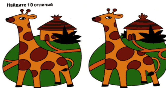
Рисунок 5. Карточка для упражнения «Что изменилось?»

Ребенку предлагается для запоминания первая картинка (20 сек), затем предлагается закрыть глаза, мысленно представить себе картинку. Первая картинка убирается, открывается вторая. Ребенок называет изменения.