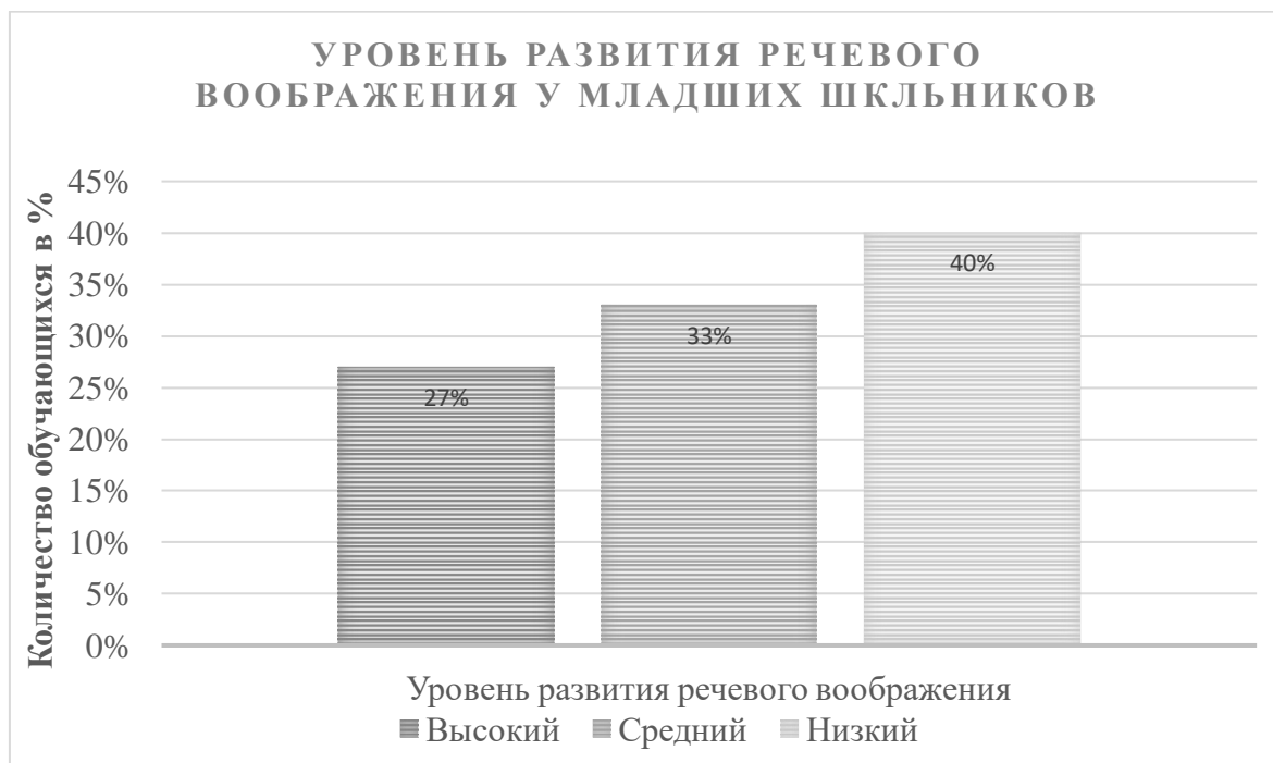
Рисунок 3 – Уровень развития речевого воображения у младших школьников.

Количественная обработка результатов показала следующее процентное соотношение уровня развития речевого воображения обучающихся 4 класса. Полученные результаты представлены на Рисунке 3.