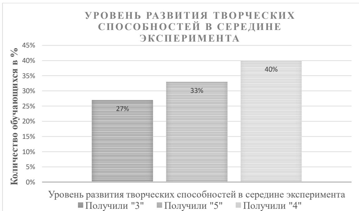
Рисунок 4 – Уровень развития творческих способностей в середине эксперимента

Сравнивая результат первых творческих работ и недавно написанных после проведенных нами уроков, можно увидеть рост развития творческих способностей обучающихся в 4 «Б» классе, которые показаны на рисунке 4: из 30 человек оценку «5» получили 10 человек (33%), «4» получили 12 человек (40%) и оценку «3» получили 8 человек (27%).