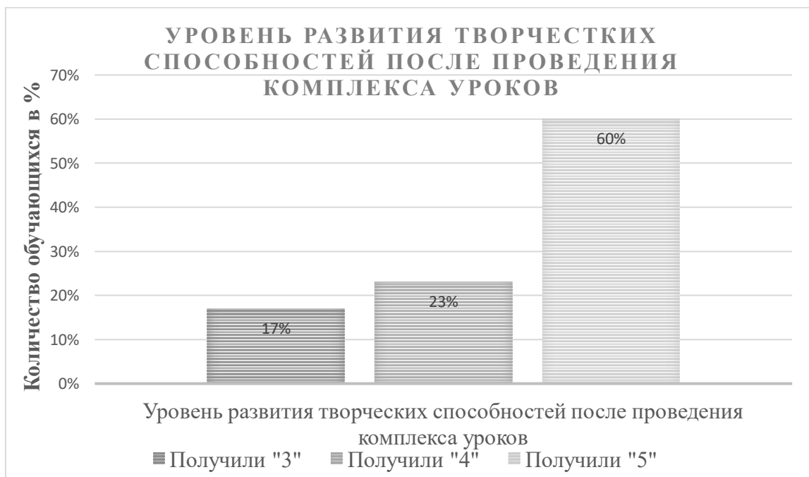
Рисунок 5 – Уровень развития творческих способностей после проведения комплекса уроков

После проведенного комплекса уроков мы проанализировали и сравнили работы с промежуточным результатом. Результат получился следующим: из 30 человек, обучающихся в 4 «Б» классе, оценку «5» получили 18 человек (60%), оценку «4» получили 7 человек (23%) и оценку «3» получили 5 человек (17%). Наглядно рост развития творческих способностей обучающихся можно увидеть на рисунке 5.