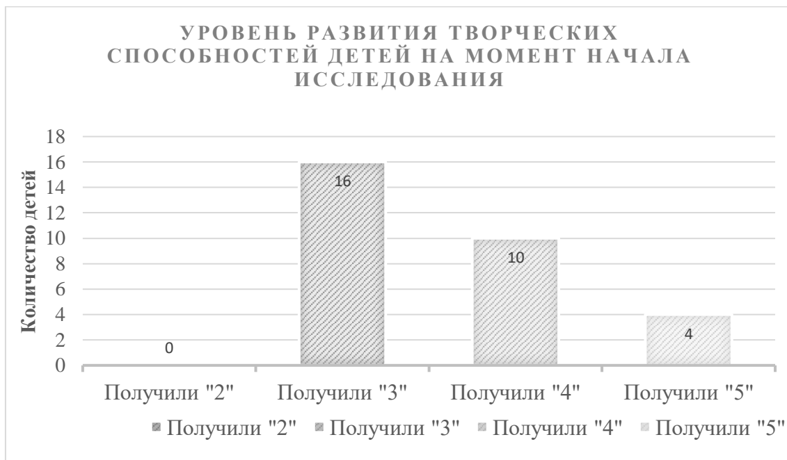
Рисунок 1 – Уровень развития творческих способностей детей на момент начала исследования

Проверенным работам были выставлены оценки, благодаря чему мы выявили, что отметку «5» получили 4 ученика, отметку «4» получили 10 учеников, отметку «3» – 16 учеников, и отметку «2» никто из класса не получил. На основе этих оценок творческих работ (сочинений) была сделана следующая диаграмма: