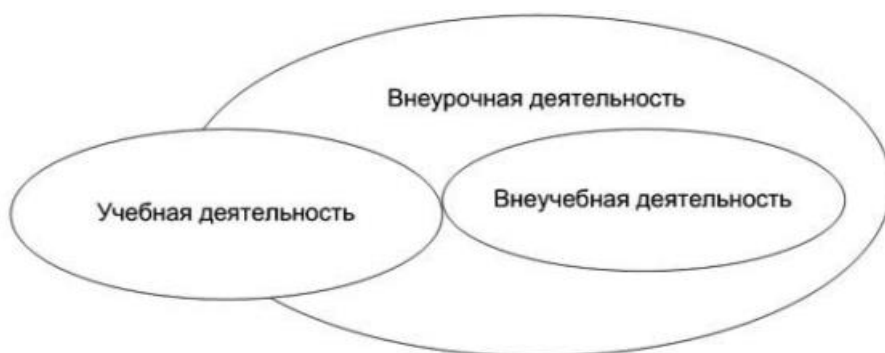
Рисунок 2 - Взаимосвязь внеурочной, учебной и внеучебной деятельности школьников (по А.Л. Трофимовой)

Представим взаимосвязь внеурочной, учебной и внеучебной деятельности школьников в виде множеств на рисунке 2.