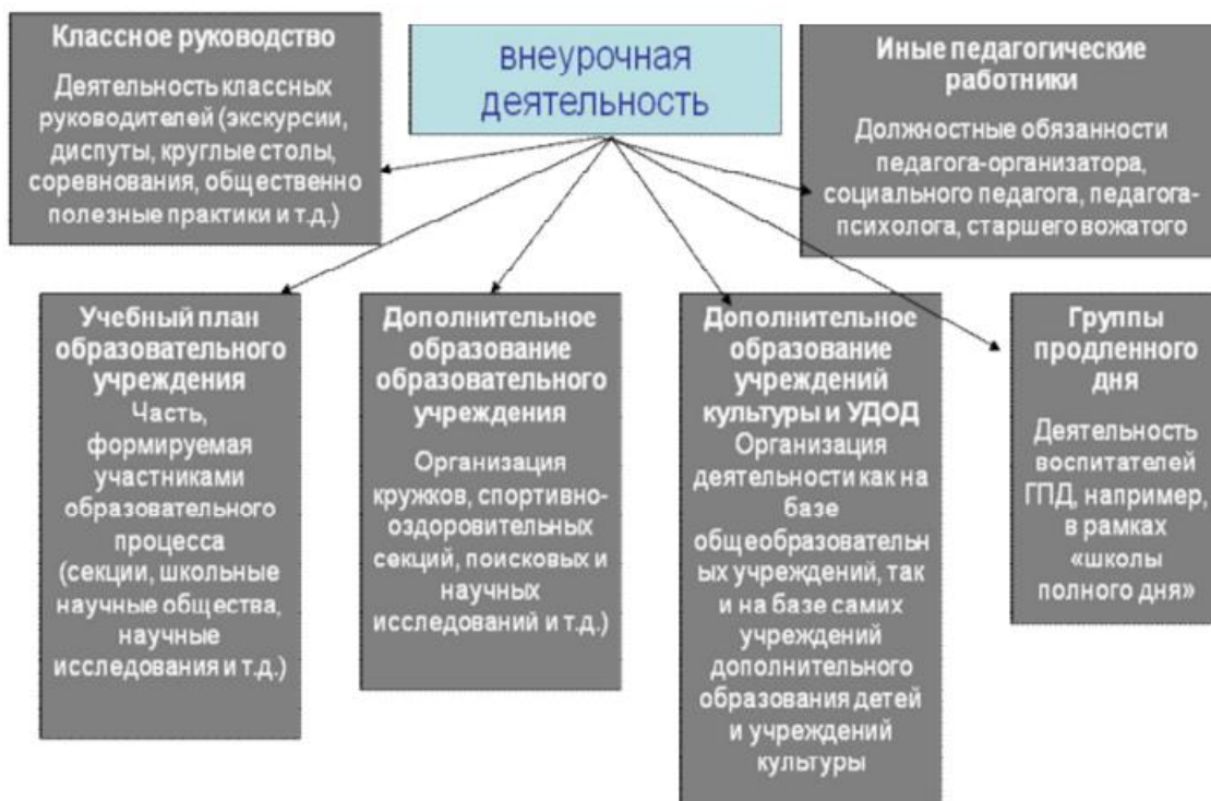
Рисунок 4 - Базовая организационная модель реализации внеурочной деятельности

организационная модель. Внеурочная деятельность может осуществляться через (рисунок 4):