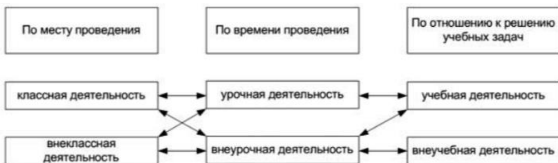
Рисунок 1 - Взаимосвязь различных видов деятельности школьников (А.Л. Трофимова)

Теперь следует рассмотреть взаимосвязь деятельности школьников по времени проведения и по отношению к учебным задачам.