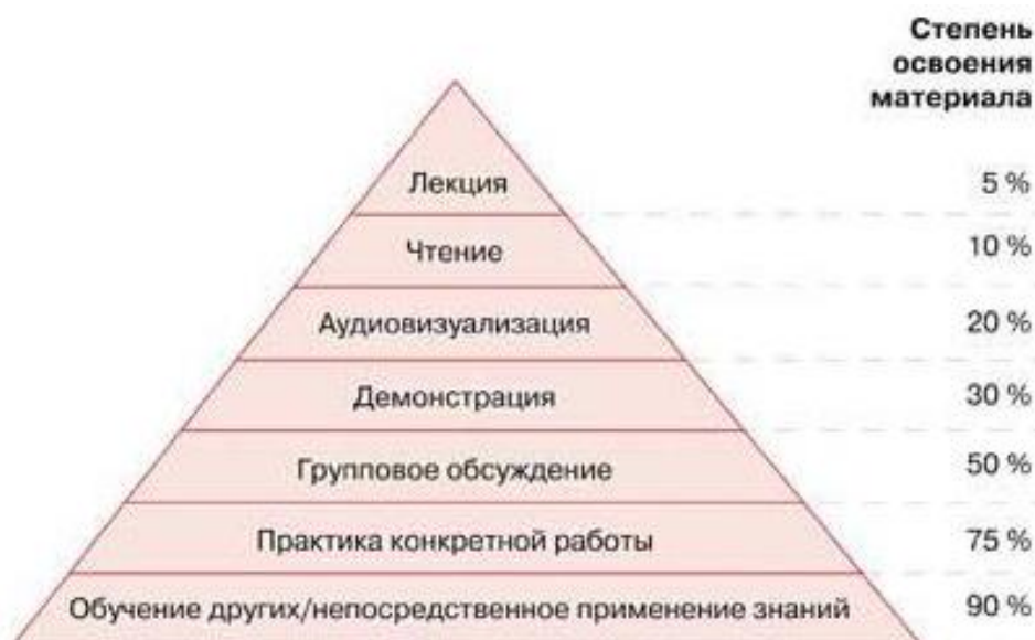
Рис. 2. «Пирамида обучения»