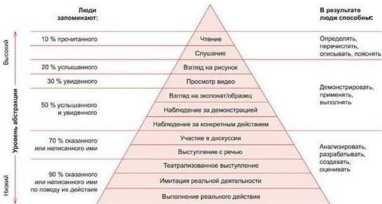
Рис. 1. «Конус опыта»

Кейс-технология можно рассматривать как активный метод обучения. Концептуальные основы того, что можно назвать «активным обучением», были сформулированы еще в начале XX века американским философом и педагогом Джоном Дьюи. Он утверждал, что традиционной системе образования, основанной на приобретении и усвоении знаний, нужно противопоставить обучение «путем делания», чтобы новые знания извлекались человеком из практической деятельности и личного опыта. В результате оформились две концепции: «пирамида обучения» и «конус опыта Эдгара Дейла».