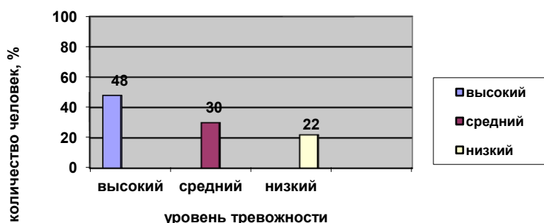
Рис. 7 Распределение общего уровня ситуативной тревожности старших дошкольников на констатирующем этапе эксперимента.

Выяснилось, что высоким уровнем тревожности обладают 11 человек (48%). По результатам анализа чаще всего у детей дошкольного возраста выявляется страх ситуации проверки знаний, страх самовыражения учащихся, страх не соответствовать ожиданиям окружающих, общая