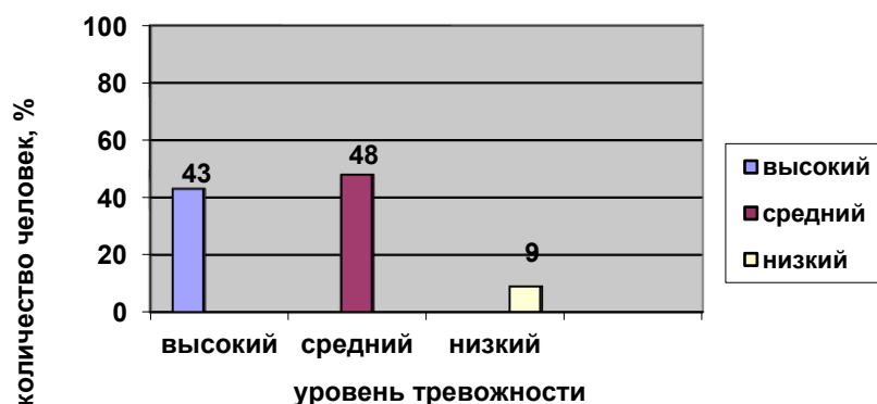
Рис. 4 Распределение уровня ситуативной тревожности старших дошкольников на констатирующем этапе эксперимента, полученных в результате диагностики по методике «Рисунок семьи».

Анализ полученных рисунков семьи показал, что к высокому уровню тревожности относятся рисунки 10 человек (43%). На этих рисунках видно запуганное выражение лица ребенка, ощущение эмоционального напряжения, через использование в рисунке темных красок. Такие дети не удовлетворены своим положением в семье. Они часто испытывают дискомфорт. Это видно по рисунку, где они изображают себя вдалеке от взрослых, а также с грустным выражением лица.