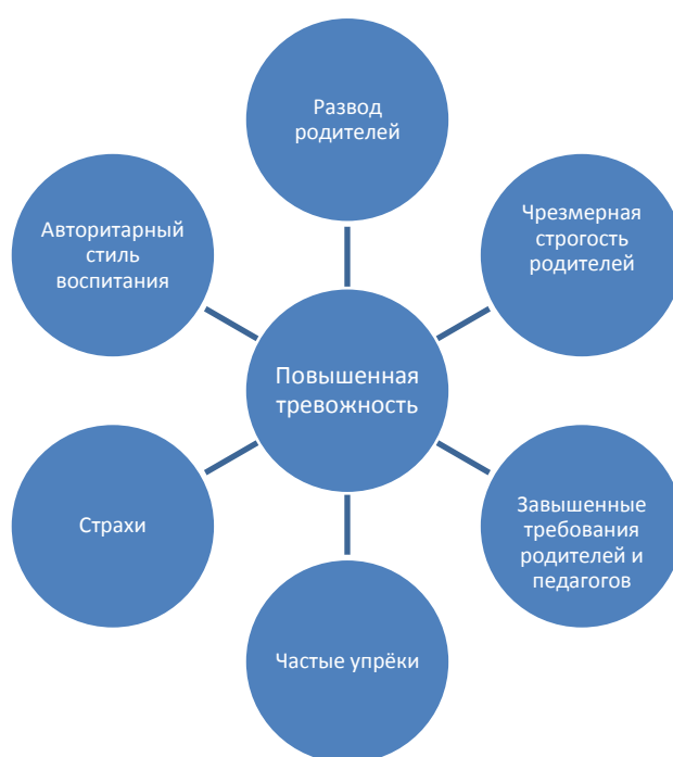
Рис. 2 Причины повышенной тревожности дошкольника.

Наиболее распространённые причины повышенной тревожности дошкольника указаны на рисунке 2.