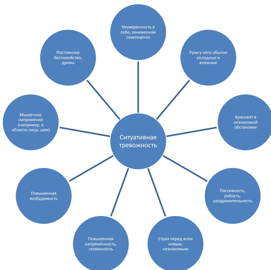
Рис. 1 Признаки ситуативной тревожности дошкольника.

Авторы книги «Эмоциональная устойчивость школьника» Б. И. Кочубей и Е. В. Новикова считают, что тревожность развивается вследствие наличия у ребенка внутреннего конфликта, который может быть вызван: