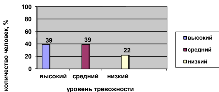
Рис. 6 Распределение уровня ситуативной тревожности старших дошкольников на констатирующем этапе эксперимента, полученных в результате диагностики по методике «Тест тревожности» В. Амен, М. Дорки.

Как видно из результатов, 9 человек (39%) показали высокий уровень тревожности, 9 человек (39%) показали средний уровень тревожности и 5 человек (22%) - низкий уровень тревожности. Дети с высоким уровнем тревожности во время тестирования проявляли беспокойство, нервозность. Их интересовало, что записывает психолог, не узнают ли о результатах теста родители или воспитатели, как отвечают другие дети и правильно ли отвечают они сами. У некоторых наблюдалась повышенная двигательная активность: они грызли ногти, качали ногой, наматывали волосы на палец, покусывали нижнюю губу. У отдельных детей можно было заметить физиологические признаки повышенной тревожности, например у них учащалось дыхание, потели ладони. Некоторые дети отказывались от тестирования и лишь после долгих уговоров, что это не страшно и не больно, согласились на диагностику, если с ними рядом будет присутствовать ребенок из той же, что и они сами, группы дошкольного учреждения. В ходе диагностики высокотревожные дети нередко выбирали рисунок, на котором было изображено грустное лицо. Отвечая на вопрос психолога «Почему?», они чаще всего говорили: