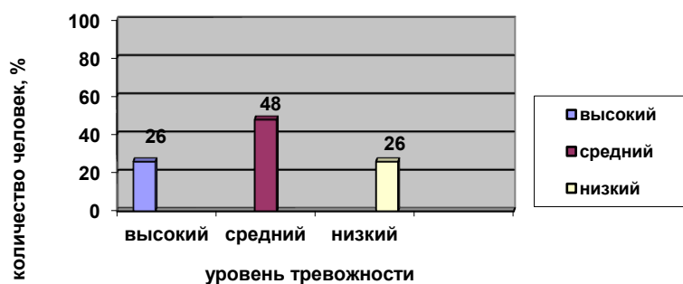
Рис. 8 Распределение уровня ситуативной тревожности старших дошкольников на формирующем этапе эксперимента, полученных в результате диагностики по методике «Рисунок семьи».

Дети с высоким уровнем тревожности – 6 человек (26%) изображали себя либо в одиночестве, либо на большом расстоянии от родителей, в тёмных и мрачных тонах, родителей изображали с большим и открытым ртом, со сжатыми кулаками, либо без пальцев.