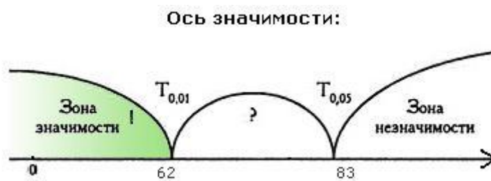
Рис. 1 Ось значимости.

Полученное эмпирическое значение T_{\text{эмп}} находится в зоне значимости.