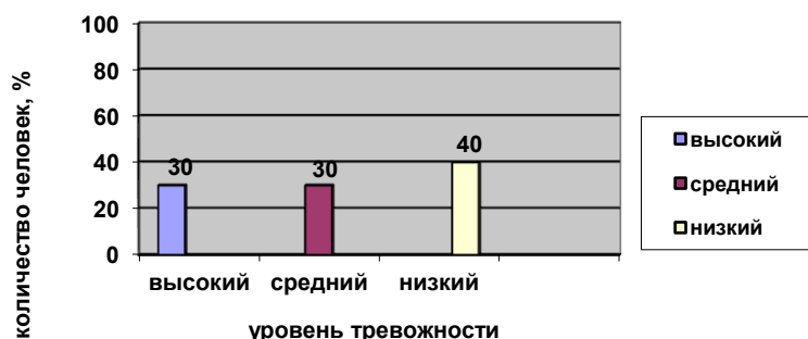
Рис. 11 Распределение общего уровня ситуативной тревожности старших дошкольников на формирующем этапе эксперимента.

- низкий уровень тревожности – 9 человек (40%).