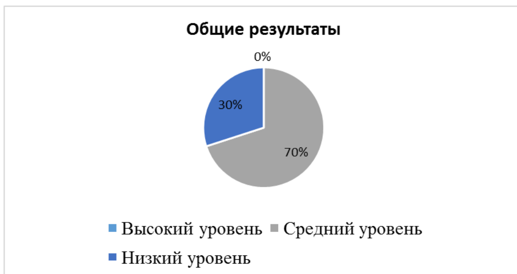
Рисунок 1 – Результаты исследования