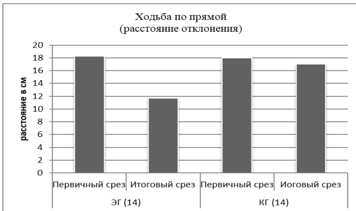
Рисунок 1 – Сравнение результатов статокинетической пробы (отклонение в ходьбе по прямой) в КГ и ЭГ до и после опытно-экспериментальной работы

в основном, шла работа на развитие силы и силовую выносливость. Круговые тренировки применялись по вторникам и четвергам, т.е. два раза в неделю. Станции состояли из упражнений на тренажёрах, с отягощениями, с собственным весом. Работа на станциях строилась по количеству повторов, в основном, с отягощениями (без строгих временных интервалов, но в рамках раунда). Вес отягощений на станциях подбирался для каждого индивидуально. Отдых между сменой станций составлял 1 минуту. После первого круга проводились упражнения на расслабление, школа бокса в течение 1 раунда. Затем, после 2 минутного отдыха начинался второй круг. В первые две недели выполняли по три круга, в остальные - по четыре (Приложение А) [1].