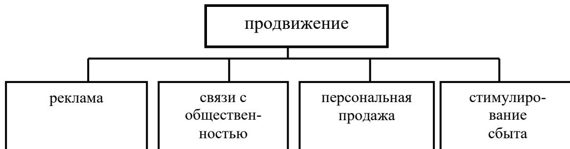
Рисунок 6 – Комплекс (структура) продвижения или коммуникативные средства маркетинга

Комплекс (структура) продвижения или коммуникативные средства маркетинга представлены на рисунке 6.