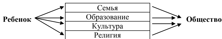
Схема 2. Объект и предмет педагогики и социальной педагогики