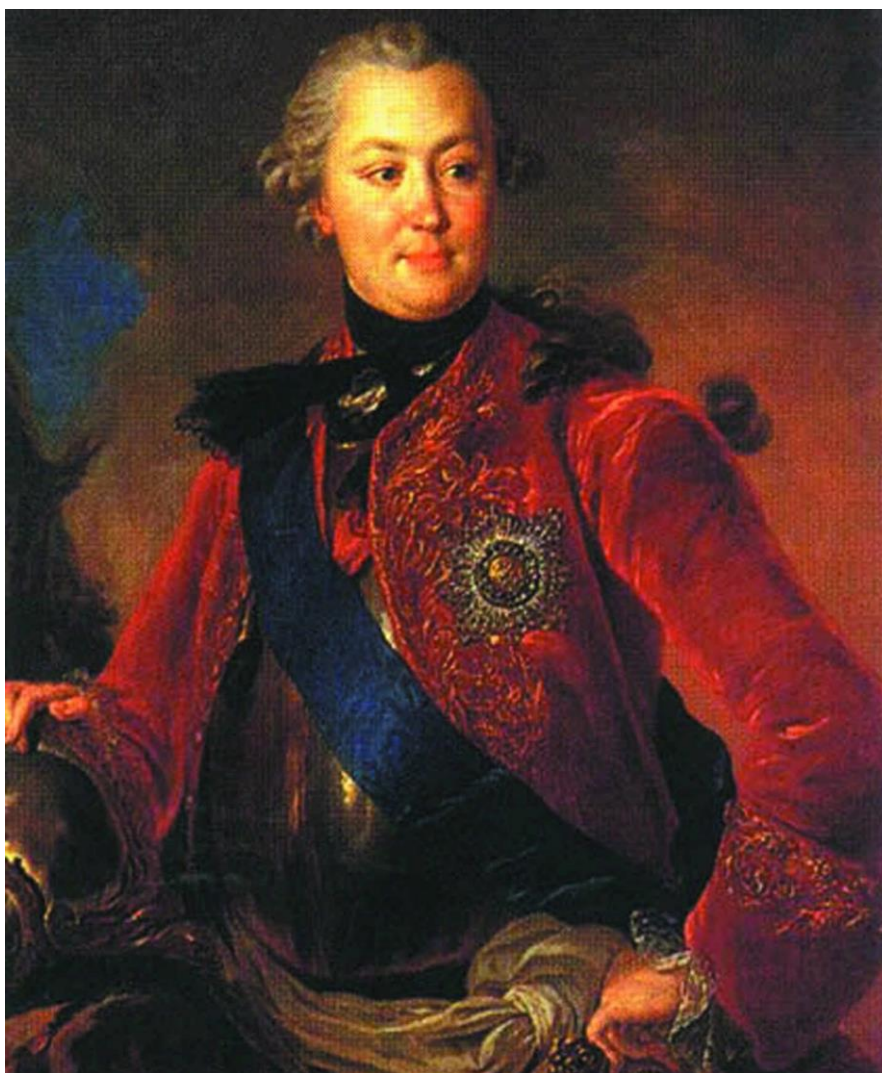
Фотография 3. Г.Г. Орлов – генерал-фельдцейхмейстер, фаворит императрицы Екатерины II (1772–1783 гг.) 66