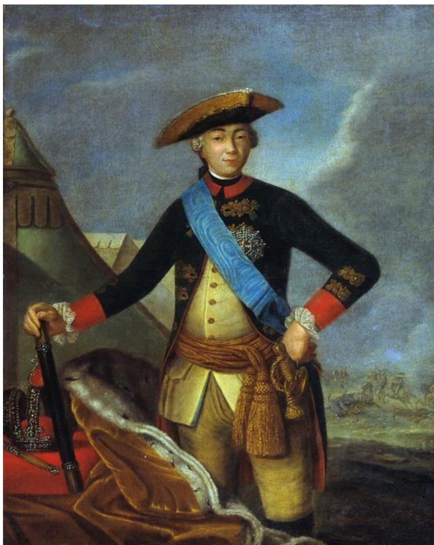
Фотография 2. Портрет Петра III (1762 г.). Художник Ф.С. Рокотов 65