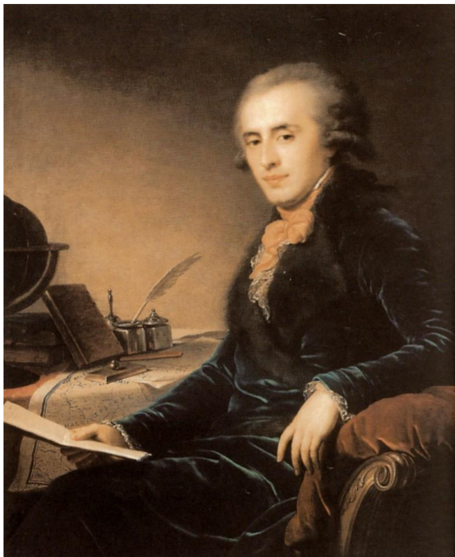
Фотография 5. Зубов П.А. – генерал-фельдцейхмейстер, начальник черноморского флота (1793–1796 гг.). Последний фаворит Екатерины II 68