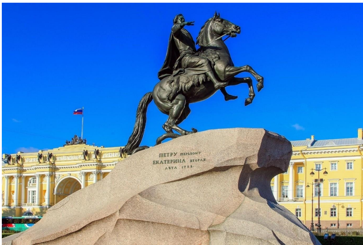
Фотография 4. «Медный всадник» - монументальный конный памятник первому российскому императору Петру Великому, созданный в 1768–1778 гг. Скульптор Э.М. Фальконе 67 .