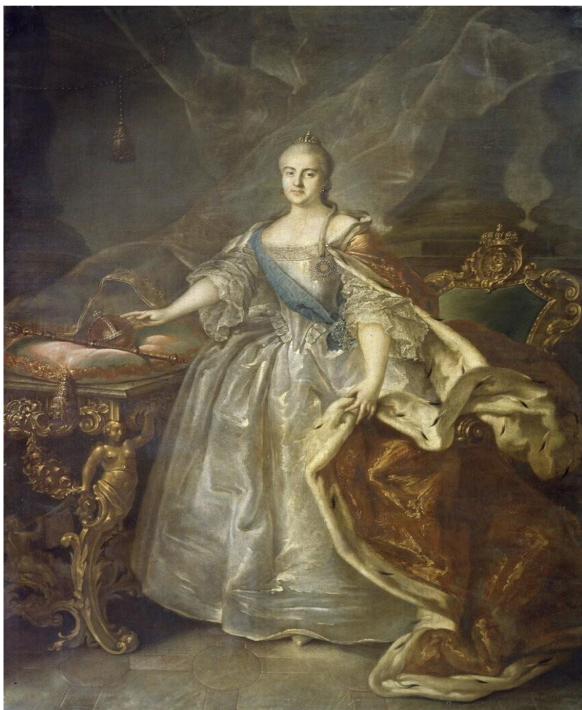
Фотография 1. Портрет Екатерины II (1762 г.). Художник И.П. Аргунов 64