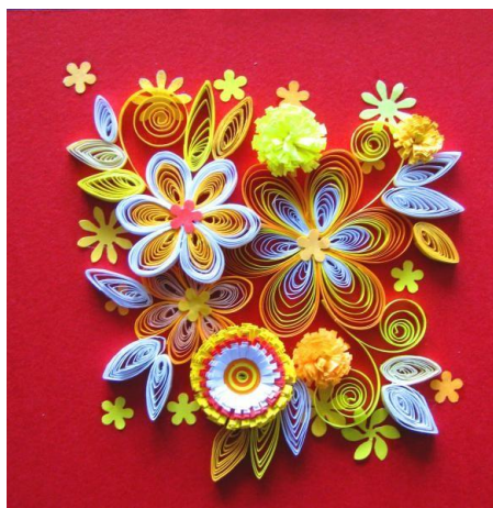
Рисунок 4 – Квиллинг панно

● Квиллинг – (англ. quilling; от quill «птичье перо»), также известен как бумагокручение, искусство изготовления плоских или объёмных композиций из скрученных в спиральки длинных и узких полосок бумаги.