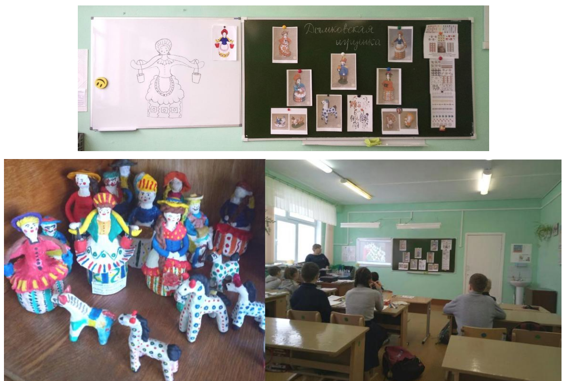
Рисунок 11. Урок на тему: «Народные промыслы. Дымковская игрушка»