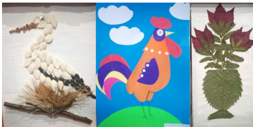
Рисунок 5 – Разные виды аппликации

● Аппликация (лат. applicātiō — прикладывание, присоединение) – способ получения изображения, техника декоративно – прикладного творчества. Представляет собой вырезание и наклеивание фигурок, узоров или целых картин из кусочков бумаги, ткани, кожи растительных и прочих материалов на материал – основу (фон)