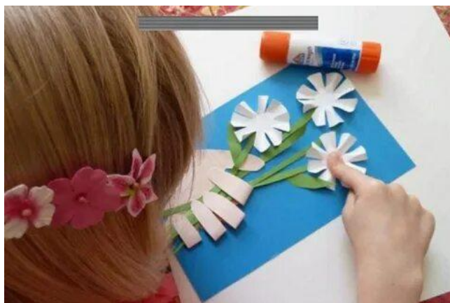
Рисунок 13. Урок на тему: «Изготовление подарка маме своими руками»

Итак, в ходе наблюдения за детьми и анализа работ выяснилось, что дети проявляют любознательность, прилежность, аккуратность, креативность. Стараются бережно относиться к материалам.