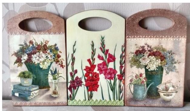
Рисунок 6 – Разделочные доски в технике «декупаж»

Техники, связанные с росписью, различными видами живописи и создания изображений: выдувание, граттаж, монотипия, нитяная графика (изонить), орнамент, печать, пуантилизм, рисование ладошками, рисование отпечатками чего-либо, энкаустика;