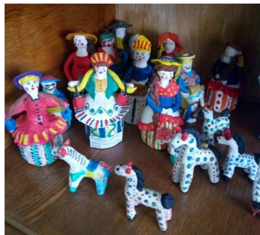
Рисунок 1– Ангелы из солёного теста Рисунок 2 – Дымковская игрушка из пластилина

● Плетение – способ изготовления более жёстких конструкций и материалов из менее прочных материалов: нитей, растительных стеблей, волокон, коры, прутьев, корней и другого подобного мягкого сырья.