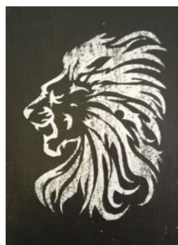
Рисунок 7 – Панно в технике «изонить» Рисунок 8 – «граттаж»

Техники, связанные с шитьём, вышивкой и использованием тканей: пэчворк, квилтинг, кинусайга, цумами канзаши;