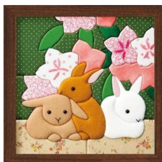
Рисунок 9 – Панно в технике кинусайга

Техники, связанные с шитьём, вышивкой и использованием тканей: пэчворк, квилтинг, кинусайга, цумами канзаши;