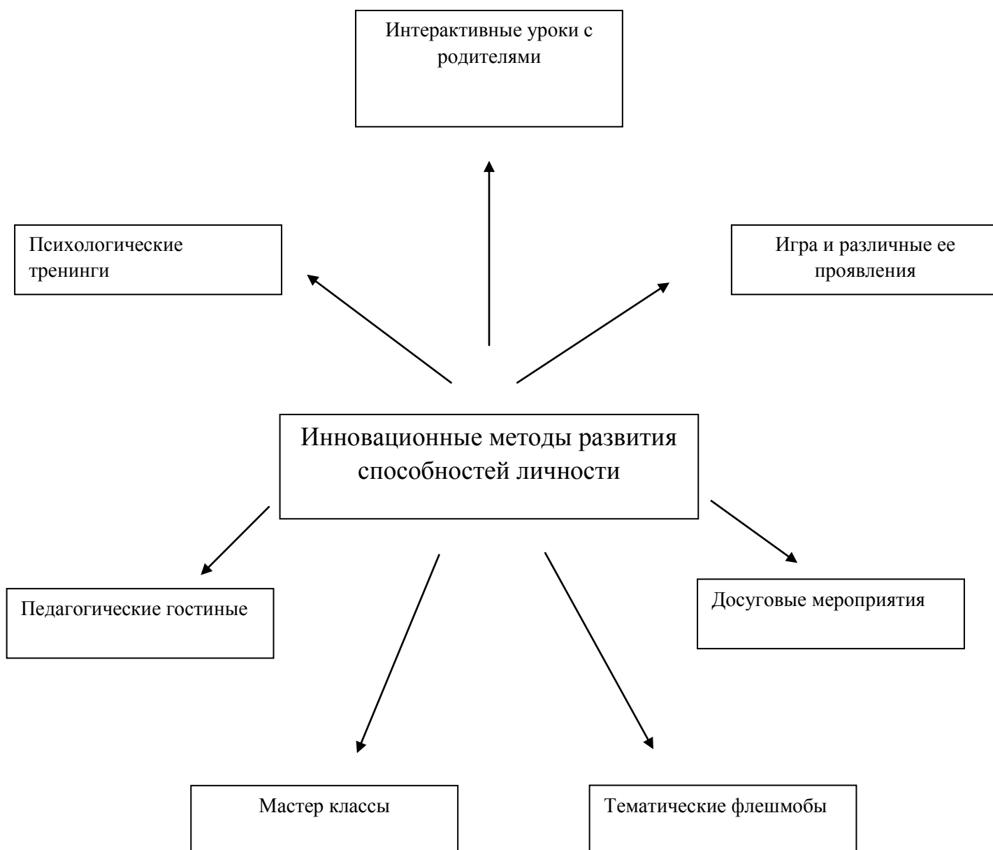
Рисунок 1. Иновационные методы развития способностей личности

Игра, учение и труд являются важнейшими факторами формирования всей системы потребностей личности.