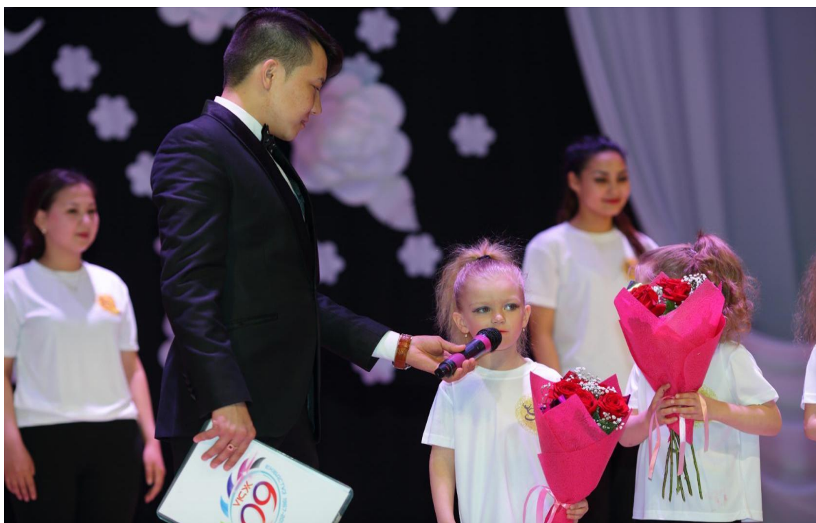
Поздравление для выпускников ансамбля