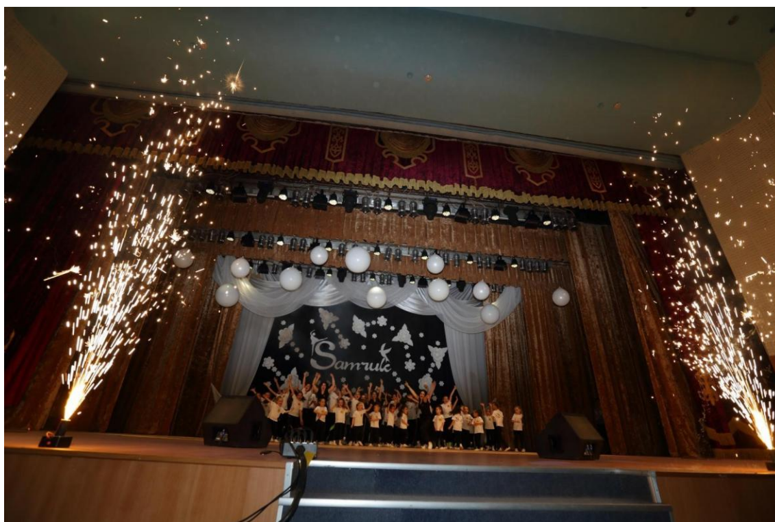
Финальный танец отчетного концерта