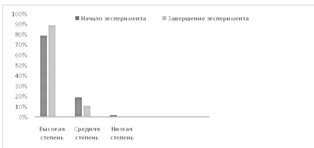
Рис. 1. Динамика показателя удовлетворенности обучающихся организацией и результатами воспитательной деятельности

Проанализируем динамику по изучаемому нами показателю в разрезе каждой категории респондентов. У обучающихся 6-8 классов, принимавших участие в опросе, наблюдается положительная динамика, что может объясняться повышением интереса и насыщенностью воспитательной работы с ними. На завершающем этапе эксперимента показатель удовлетворенности низкой степени дошел до нулевой отметки.