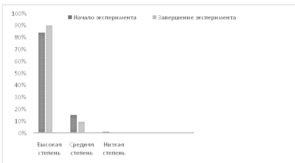
Рис. 3. Динамика показателя удовлетворенности педагогов организацией и результатами воспитательной деятельности

Результаты, полученные в ходе опросов педагогических работников, демонстрируют их мотивацию на повышение качества собственной воспитательной деятельности, желание сделать ее более результативной. Педагоги (классные руководители) на начальном этапе выше всех остальных категорий респондентов указали на высокую степень удовлетворенности воспитательной деятельностью. Это связано, в первую очередь, с ощущением высокой отдачи от проделанной работы, чувством сопричастности к общему делу, профессиональной самореализацией.