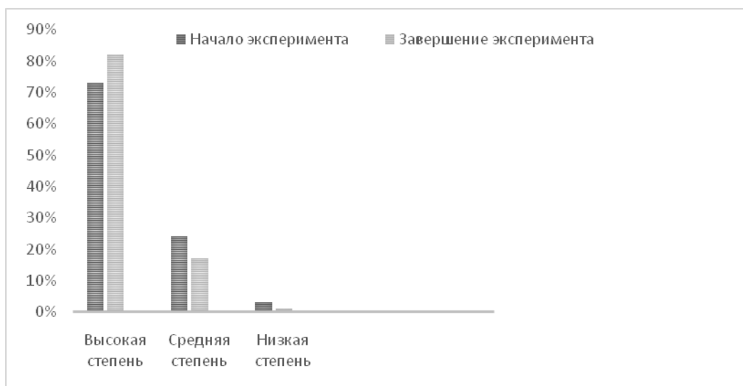
Рис. 2. Динамика показателя удовлетворенности родителей организацией и результатами воспитательной деятельности

Результаты, полученные в ходе опросов педагогических работников, демонстрируют их мотивацию на повышение качества собственной воспитательной деятельности, желание сделать ее более результативной. Педагоги (классные руководители) на начальном этапе выше всех остальных категорий респондентов указали на высокую степень удовлетворенности воспитательной деятельностью. Это связано, в первую очередь, с ощущением высокой отдачи от проделанной работы, чувством сопричастности к общему делу, профессиональной самореализацией.