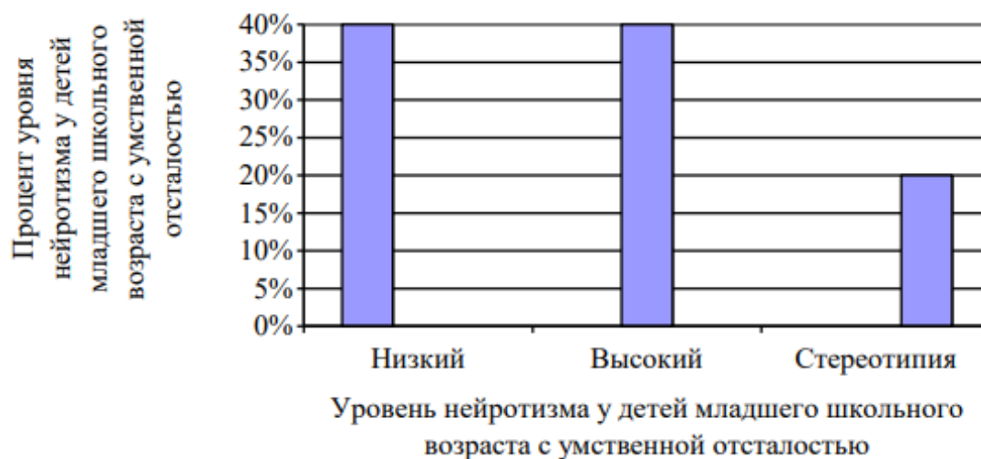
Рисунок 8 - Уровень нейротизма у детей младшего школьного возраста с умственной отсталостью (контрольный эксперимент)