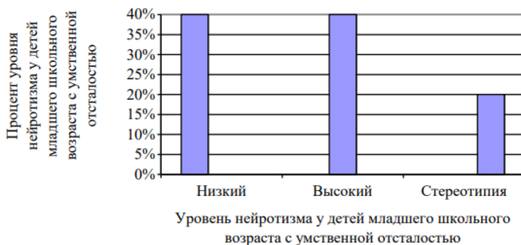
Рисунок 3 - Уровень невротизма у детей младшего школьного возраста с умственной отсталостью

взрослому, так и сверстнику. Они устойчивы в своих эмоциональных отношениях к различным объектам, ситуациям и окружающим людям. Кроме того, они меньше подвержены невротизации (Рисунок 3).