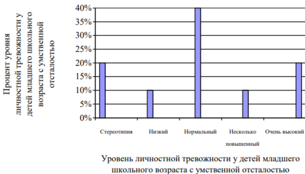
Рисунок 7 - Уровень личностной тревожности у детей младшего школьного возраста с умственной отсталостью (контрольный эксперимент)

Анализ уровня личностной тревожности у детей младшего школьного возраста с умственной отсталостью показал, что нормальный уровень личностной тревожности у детей младшего школьного возраста с умственной отсталостью повысился на 10% и составил 40%. Несколько повышенный уровень тревожности у детей младшего школьного возраста с умственной отсталостью понизился на 10% и составил 10%. Шкалы низкого уровня личностной тревожности и очень высокого уровня личностной тревожности у детей младшего школьного возраста с умственной отсталостью не изменились и составили 10% и 20%. По-прежнему осталась неизменной шкала стереотипных ответов, которая составила 20%.