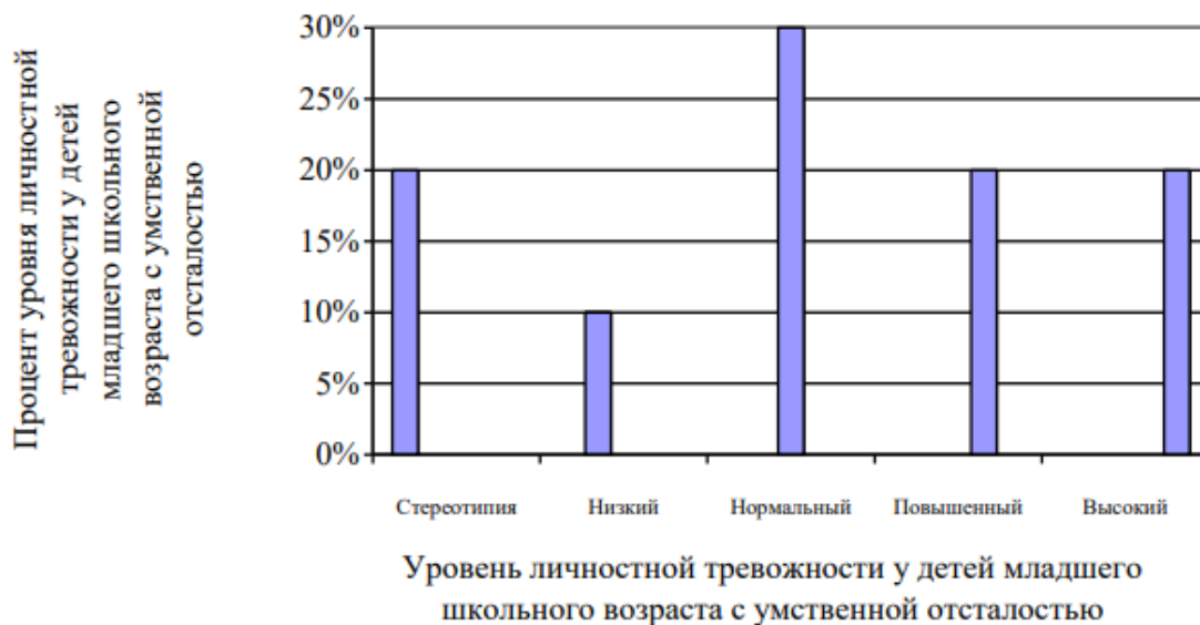
Рисунок 2 - Уровень личностной тревожности у детей младшего школьного возраста с умственной отсталостью

уровень необходим для адаптации и продуктивной деятельности. Несколько повышенная личностная тревожность отмечается у 20% испытуемых: Алишер, Вероника. Часто бывает связана с ограниченным кругом ситуаций, определенной сферой жизни. Очень высокая личностная тревожность отмечается у 20% испытуемых: Максима и Полины (Рисунок 2).