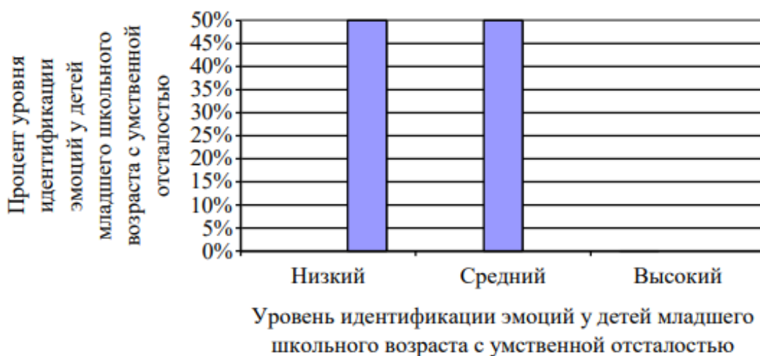
Рисунок 9 - Уровень идентификации эмоций у детей младшего школьного возраста с умственной отсталостью (контрольный эксперимент)