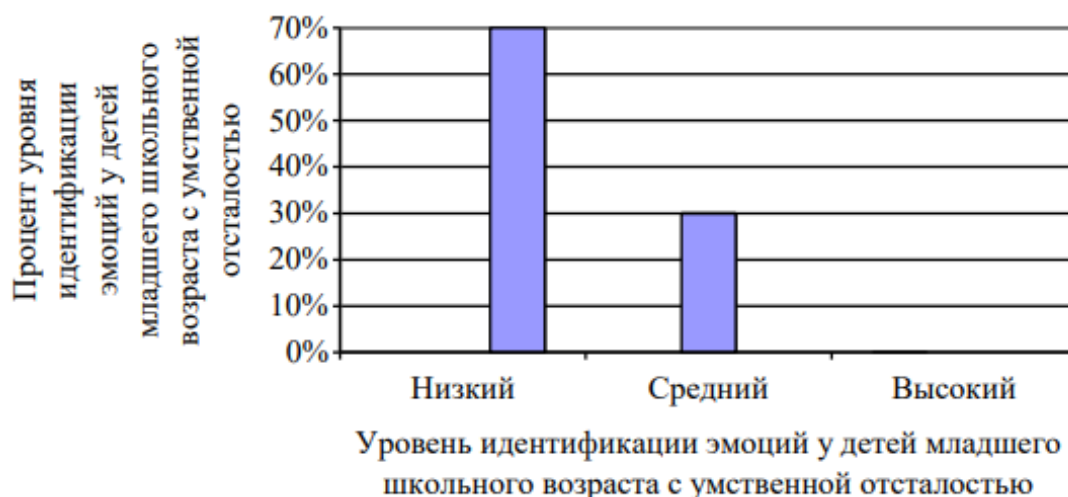
Рисунок 4 - Уровень идентификации эмоций у детей младшего школьного возраста с умственной отсталостью