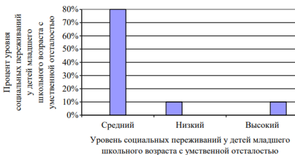
Рисунок 10 - Уровень социальных переживаний у детей младшего школьного возраста с умственной отсталостью (контрольный эксперимент)