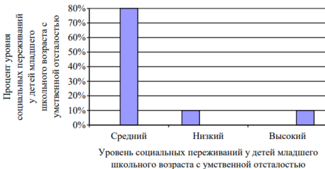
Рисунок 5 - Уровень социальных переживаний у детей младшего школьного возраста с умственной отсталостью

Обобщая результаты проведенной диагностики проявлений эмоциональных нарушений у детей младшего школьного возраста с умственной отсталостью можно сделать следующие выводы. Из результатов исследования видно, что 60% испытуемых имеют высокий уровень эмотивности. Низкий уровень эмотивности отмечается у 40% испытуемых. Нормальный уровень тревожности выявлен у 30% испытуемых. Несколько повышенный уровень тревожности отмечается у 20% детей. Очень высокий уровень тревожности отмечается у 20% испытуемых. 10% детей имеют низкий уровень тревожности. Низкий уровень нейротизма выявлен у 40% испытуемых. Высокий уровень выявлен также у 40% испытуемых. Низкий уровень идентификации эмоций отмечается у 70% детей. Средний уровень идентификации эмоций наблюдается у 30%. Средний уровень социальных переживаний выявлен у 80% испытуемых. Низкий уровень социальных переживаний отмечается у 10% испытуемых. Высокий уровень социальных переживаний отмечается у 10% испытуемых.