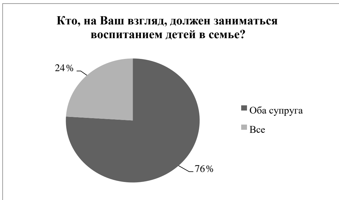
Рисунок 5 – Мнение респондентов об участии родственников в воспитании детей

Радует то, что молодые люди не выбрали вариант «муж» или «жена», это значит, что они не считают, что воспитание детей должно сваливаться на плечи одного из супругов, обязанности должны распределяться равномерно между всеми членами семьи. Также современное поколение не планирует перекладывать эту обязанность на бабушек и дедушек. В тоже время вариант «все» выбрало небольшое количество респондентов. На это мы можем взглянуть по-разному. С одной стороны этот факт можно рассмотреть как положительную тенденцию, которая заключается в том, что молодежь уже не хочет быть обузой для своих родителей, а дает старшему