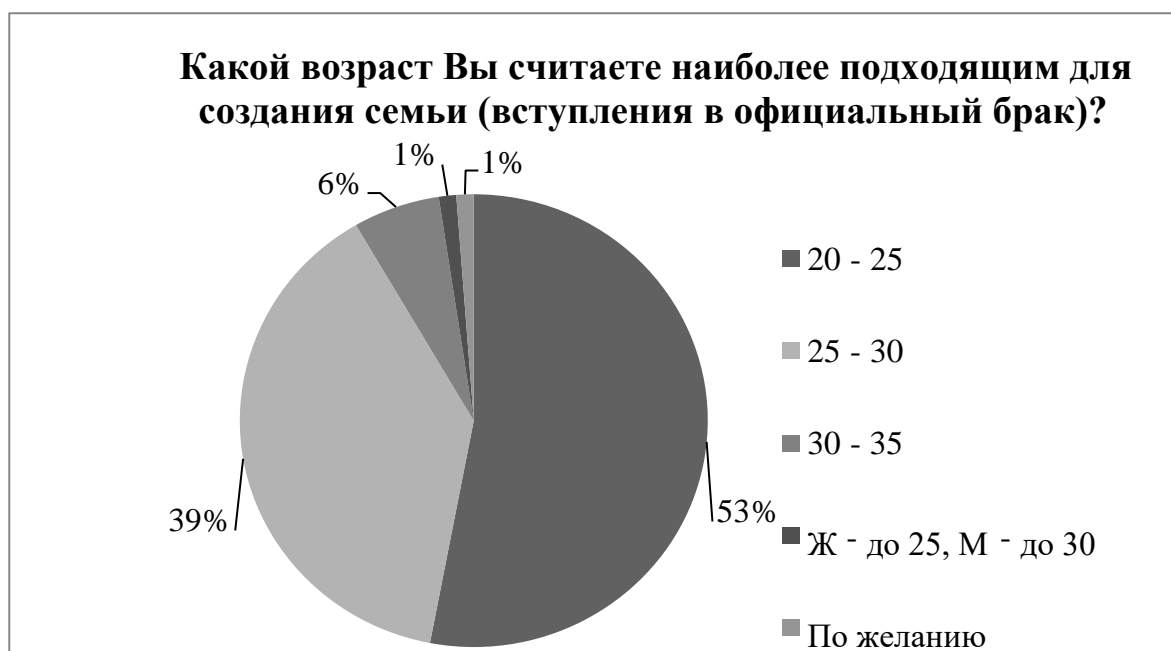
Рисунок 1 – Мнение респондентов о наиболее подходящем возрасте для создания семьи

Следующий вопрос неразрывно связан с предыдущим, и респондентам было предложено ответить на вопрос о том, какой возраст они считают оптимальным для рождения первого ребенка. Ответы на него закономерно вытекают из ответов на 4 вопрос анкеты и расположились следующим образом: большинство респондентов 47% выбрали первый вариант «20 – 25 лет», вторым по популярности стал вариант «25 – 30 лет» его выбрали 44,6%, ответ «30 – 35 лет» предпочли всего лишь 6% опрошенных, также 2,4% предложили свой вариант «никогда». Мнение об оптимальном возрасте для рождения первого ребенка отражено в таблице 2, рисунке 2.