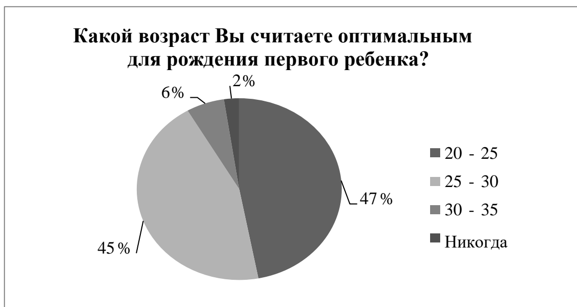
Рисунок 2 – Мнение респондентов об оптимальном возрасте для рождения первого ребенка

Это значит, что молодые люди считают, что заводить первого ребенка нужно непосредственно в тот же период, что и вступать в официальный брак. Радует так же тот факт, что половина опрошенных относят к этому возрасту молодость до 25 лет, а ведь именно этот период считается наиболее благоприятным с физиологической стороны для рождения детей. Примечательно также то, что ответы студентов разных ВУЗов почти не различались, не зависимо от факультета и курса обучения.