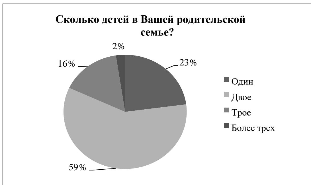
Рисунок 6 – Количество детей в родительской семье студентов