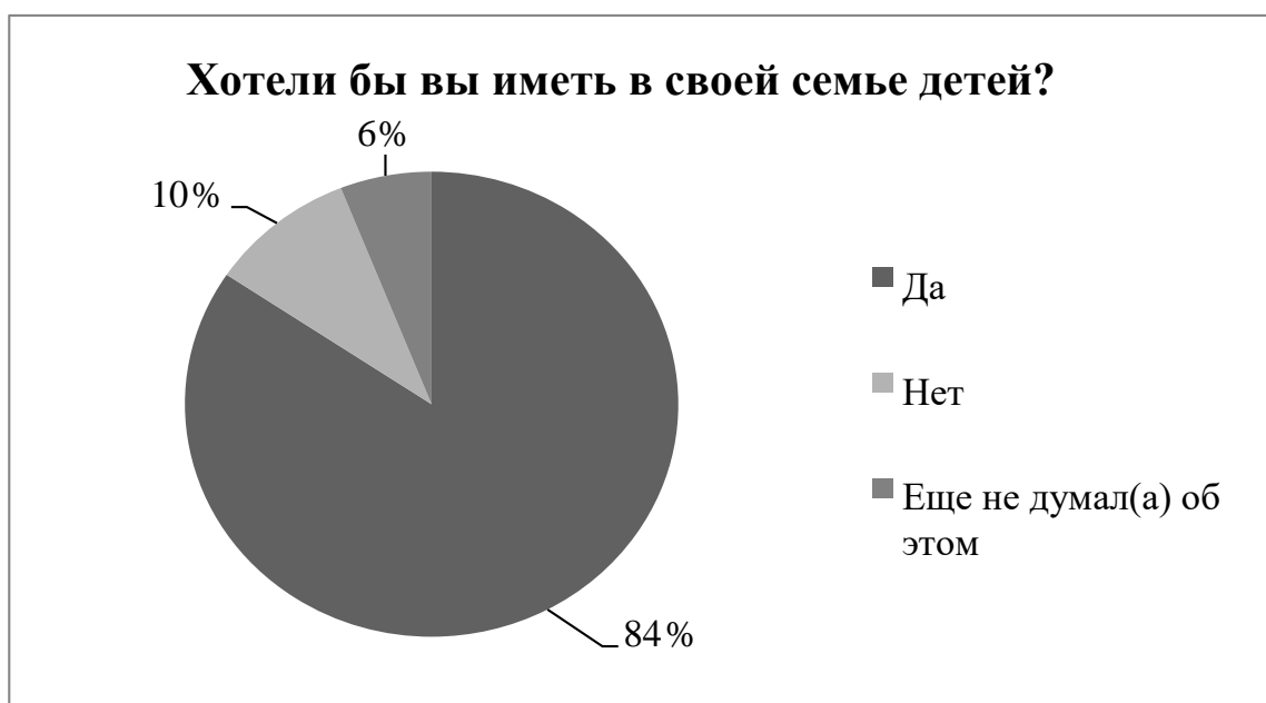
Рисунок 3 – Желание студенческой молодежи иметь детей

Интересно отметить то, что среди опрошенных в ЧелГУ больше студентов выбрали вариант «нет» и «еще не думал(а) об этом» - таких респондентов оказалось 27,3% от общего числа опрошенных в ЧелГУ, в ЮУрГГПУ эта цифра намного меньше – всего 8% от общего количества опрошенных в педагогическом университете.