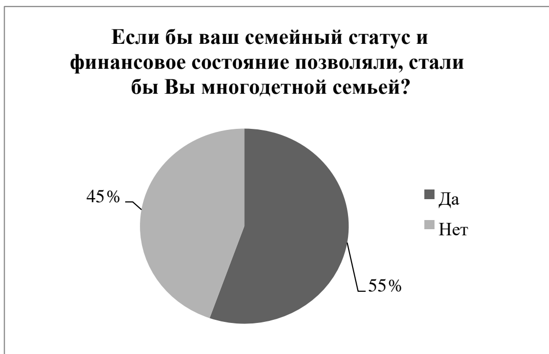
Рисунок 9 – Желание студентов становится многодетной семьей при благоприятных условиях жизни

По проведенному исследованию можно сделать следующие выводы: Современная студенческая молодежь ориентирована на построение семьи,