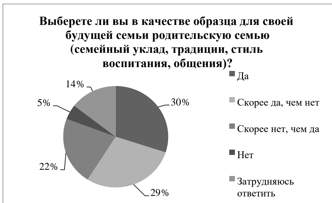
Рисунок 8 – Отношение студентов к семейному кладу, традициям, стилю воспитания, общения в родительской семье

Из анализа трех вышеописанных вопросов следует, что тенденция малодетности, которая идет еще из родительской семьи респондентов, будет сохраняться, т.к опрошенные в большинстве будут опираться на опыт