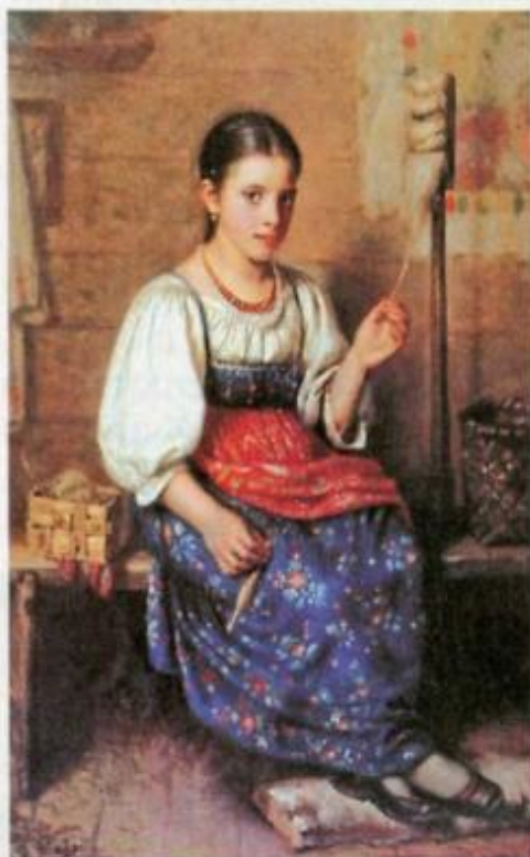
Неизвестный художник. Пряха