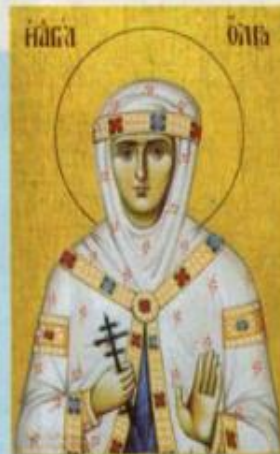
Святая великая княгиня Ольга