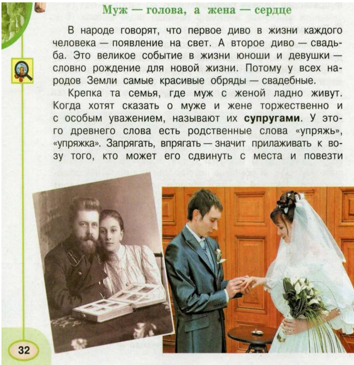
Рисунки 7 – Тема: «Муж и жена – одна душа». «Муж – голова, а жена – шея»