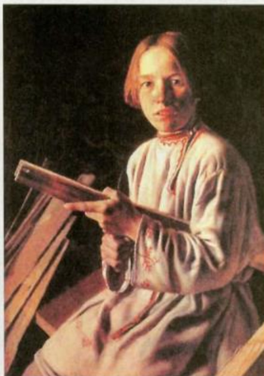
Л. К. Плахов. Крестьянский мальчик с лучиной