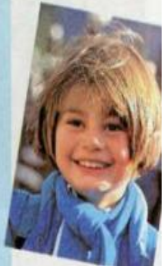
Рисунок 13 — Тема: «Добрые дети — дому венец». «Твое имя — твоя честь»