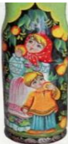
Рисунок 10 – Тема: «Святость отцовства и материнства»

1. Что мы узнали в 1 классе о том, чему каждый человек с детства учится в семье? 2. В каких сезонных работах принимали участие дети в течение года в старину? В каких сезонных работах участвуете вы? 3. Какие календарные праздники отмечали в семье в старину, а какие отмечают и в наши дни?