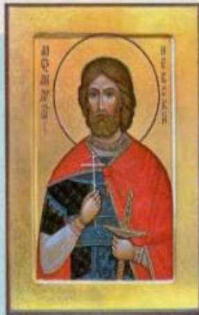
Святой благоверный князь Александр Невский

Мужское имя Александр в переводе с греческого языка значит «мужественный», «защитник людей». Это имя носили такие люди, как святой благоверный князь Александр Ярославич Невский и великий полководец Александр Васильевич Суворов. Они были истинными защитниками Русской земли и её блага.