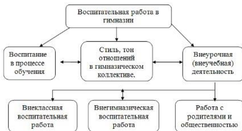
Рисунок 1. Система воспитательной работы ПОО

Воспитательная система определяет содержание, методики и технологии воспитательной работы.