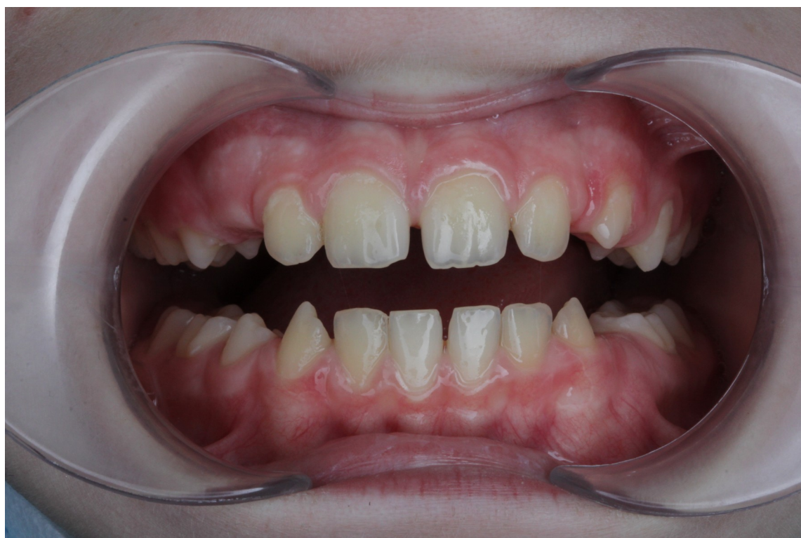
Рис.22 Артём Т. прямая проекция прикуса после коррекции (нивелирование трем)