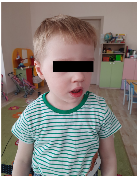
Рис.2 Ротовое дыхание