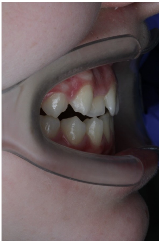
Рис. 36 Ирина Г. Боковая проекция прикуса в коррекции (смещение нижней челюсти вперёд, более правильное соотношение челюстей)