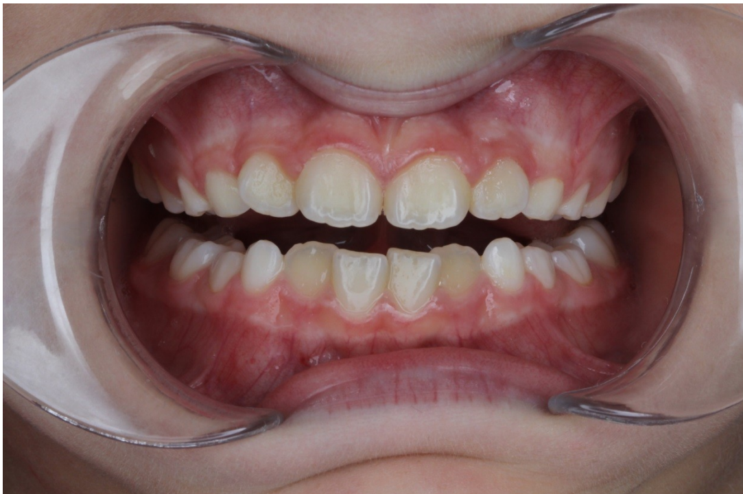
Рис. 28 Милана Г. прямая проекция прикуса после коррекции (дефицит места сохраняется, скучивание менее выражено, положение языка правильное)