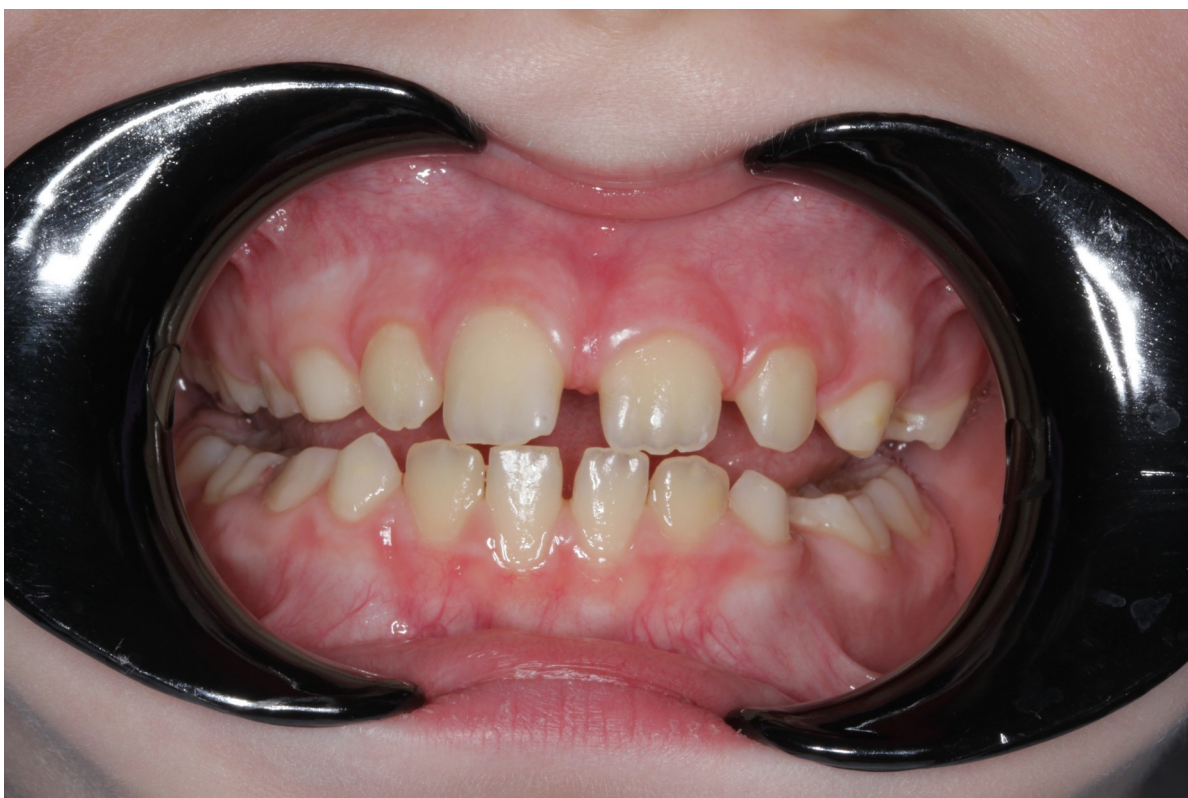
Рис.21 Артём Т. прямая проекция прикуса до коррекции (тремы между зубами, призубное положение языка)