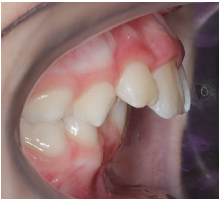
Рис.11 Олег К. боковая проекция прикуса до коррекции (дистальный прикус)