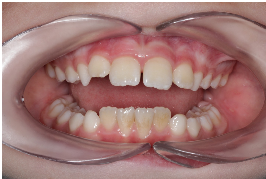
Рис.9 Олег К. прямая проекция прикуса до коррекции (скучивание зубов во фронтальном отделе)