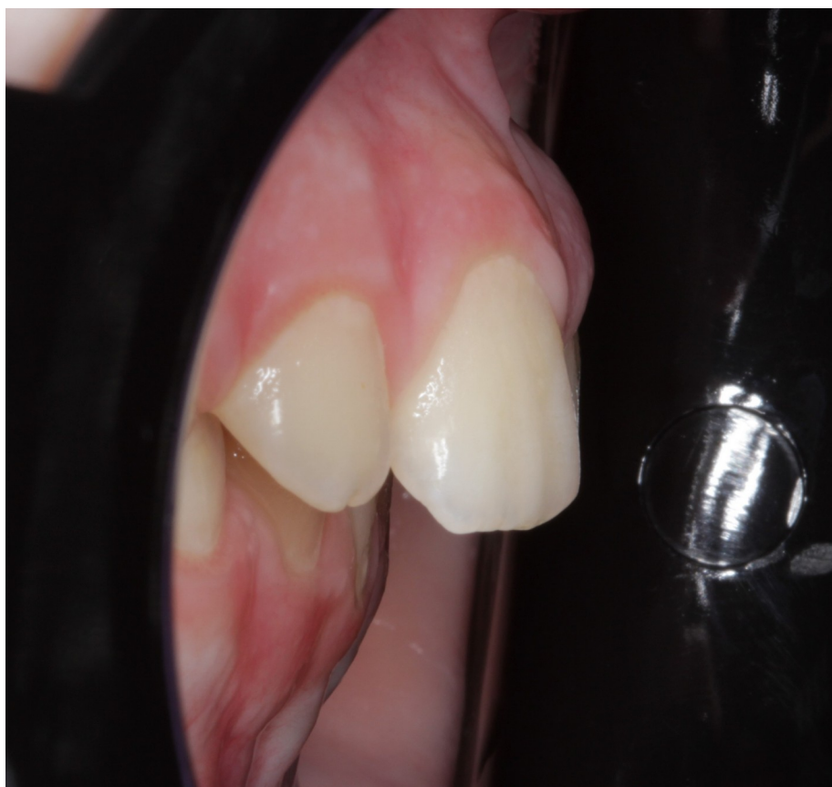
Рис.23 Артём Т. боковая проекция прикуса до коррекции (дистальный прикус)