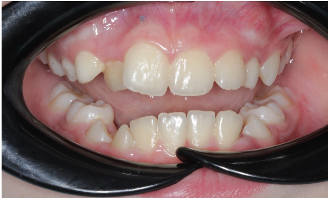
Рис. 33 Ирина Г. прямая проекция прикуса до коррекции (дефицит места, скучивание зубов верхней и нижней челюсти, нижнее положение языка)