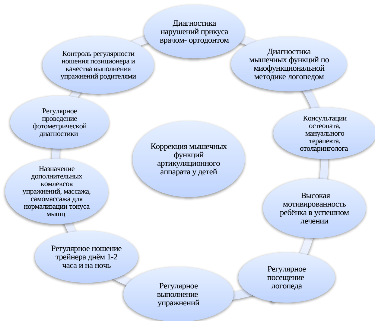
Рис. 2 Модель комплексного сопровождения ребёнка в процессе коррекционной работы по миофункциональной методике

В соответствии со схемой на рисунке, процесс коррекции мышечных функций включает в себя следующие компоненты: