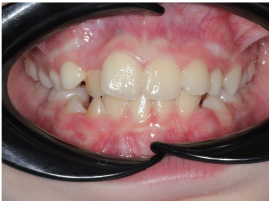
Рис. 31 Ирина Г. прямая проекция прикуса до коррекции (дефицит места, скучивание зубов верхней и нижней челюсти, нижнее положение языка)

Данные фотометрической диагностики состояния прикуса до и после миофункциональной коррекции (правильные мышечные функции находятся на этапе формирования).