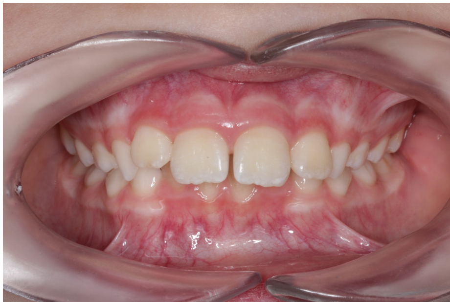
Рис.7 Олег К. прямая проекция прикуса до коррекции (глубокий травмирующий прикус)

Данные фотометрической диагностики состояния прикуса до и после миофункциональной коррекции (правильные мышечные функции сформированы и автоматизированы).