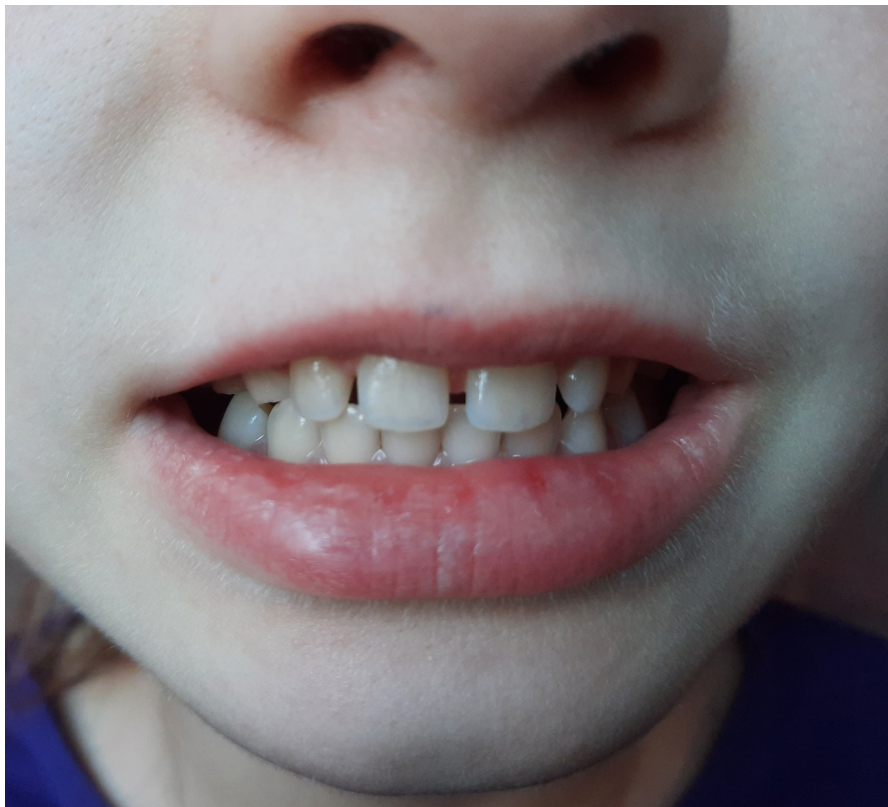
Рис.4 Правильное положение языка в покое