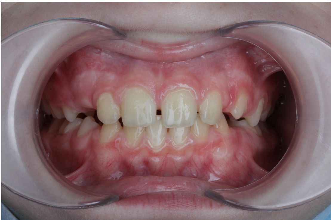
Рис.20 Артём Т. прямая проекция прикуса после коррекции (увеличение высоты прикуса, правильное положение языка)