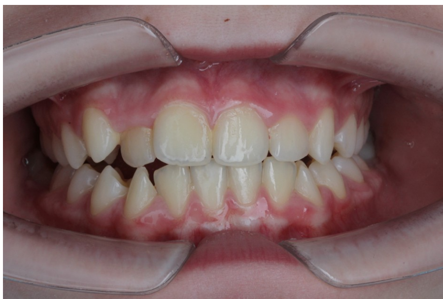
Рис. 32 Ирина Г. прямая проекция прикуса в коррекции (дефицит места, скучивание зубов верхней и нижней челюсти, правильное положение языка)