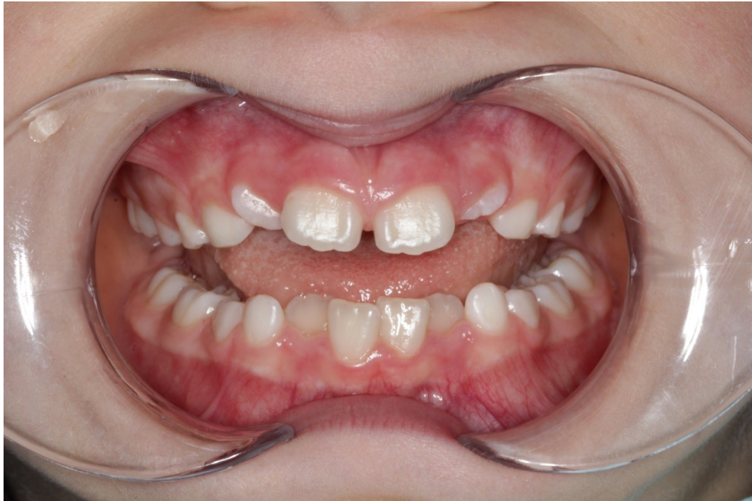
Рис. 27 Милана Г. прямая проекция прикуса до коррекции (призубное нижнее положение языка, дефицит места, скучивание зубов верхней и нижней челюсти)