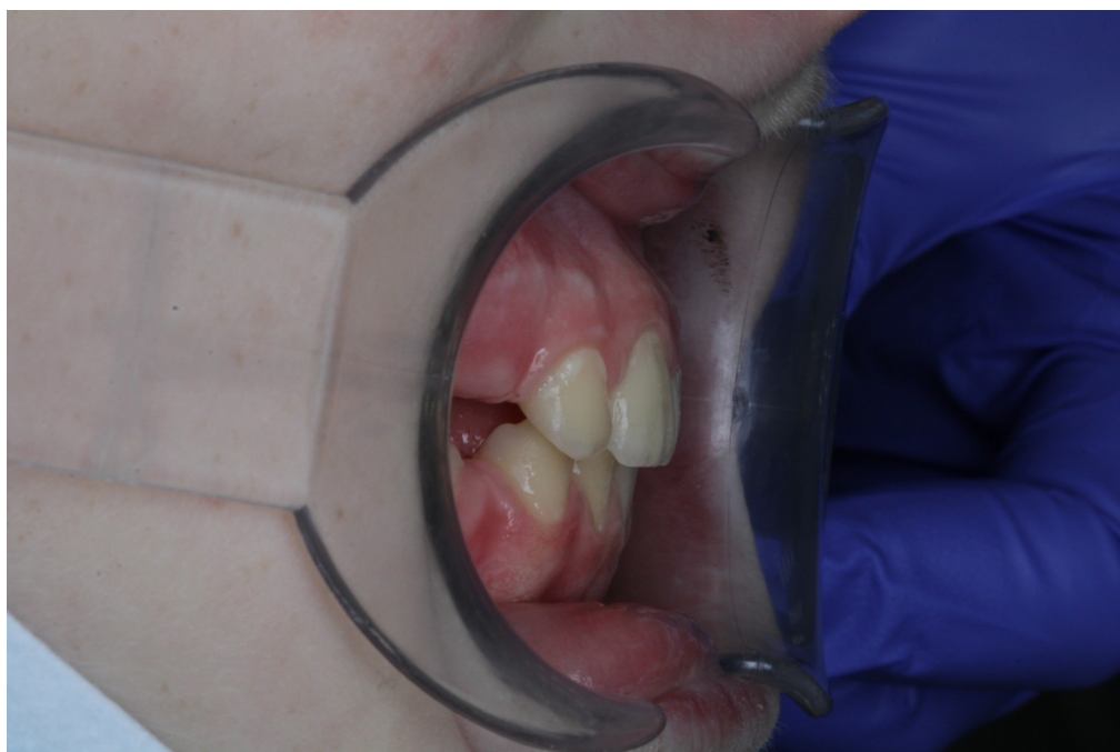
Рис.24 Артём Т. боковая проекция прикуса после коррекции (правильное смыкание)