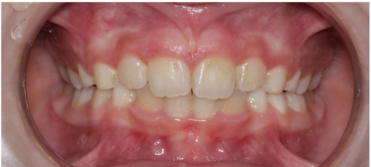
Рис.14 Даша К. прямая проекция прикуса после коррекции (правильное смыкание)