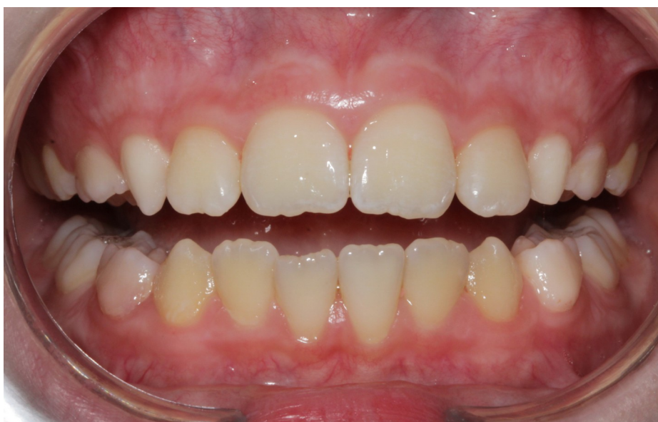
Рис.10 Олег К. прямая проекция прикуса после коррекции (правильное положение зубов)