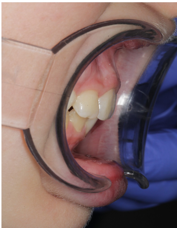
Рис.12 Олег К. боковая проекция прикуса после коррекции (правильное смыкание)