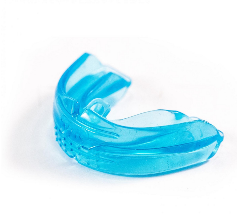
Рис.5 Трейнер первой ступени K1

Трейнеры (позиционеры) Муобрасе для коррекции мышечных функций.