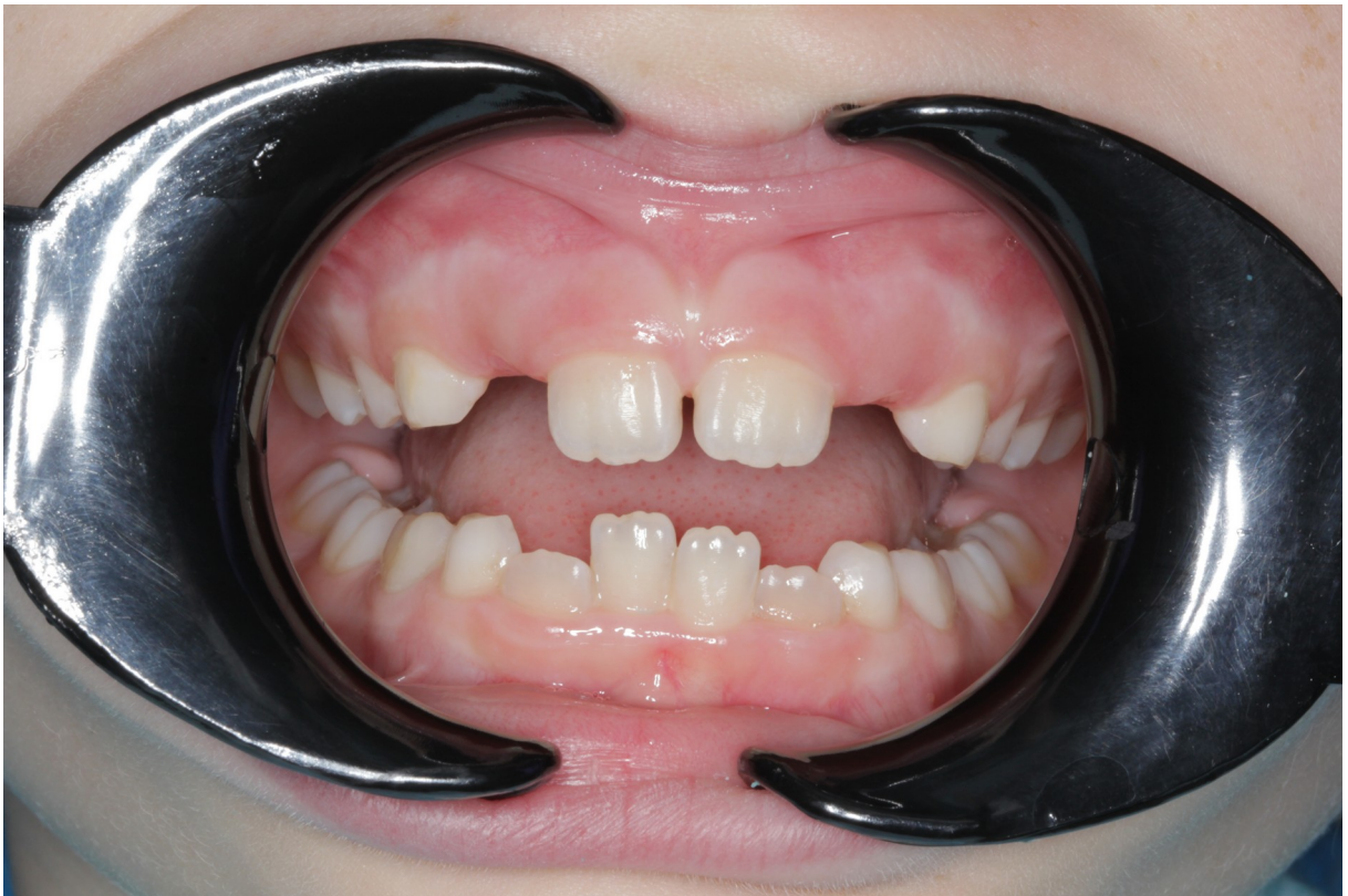
Рис.15 Даша К. прямая проекция прикуса до коррекции (скучивание зубов во фронтальном отделе)