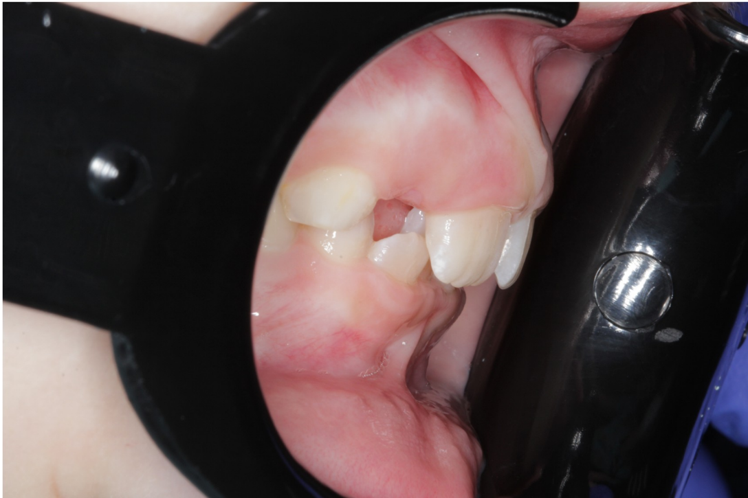
Рис.17 Даша К. боковая проекция прикуса до коррекции (дистальный прикус)