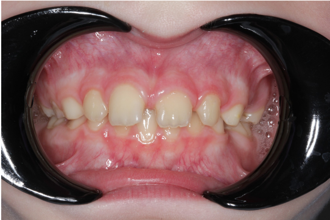
Рис.19 Артём Т. прямая проекция прикуса до коррекции (глубокий травмирующий прикус)