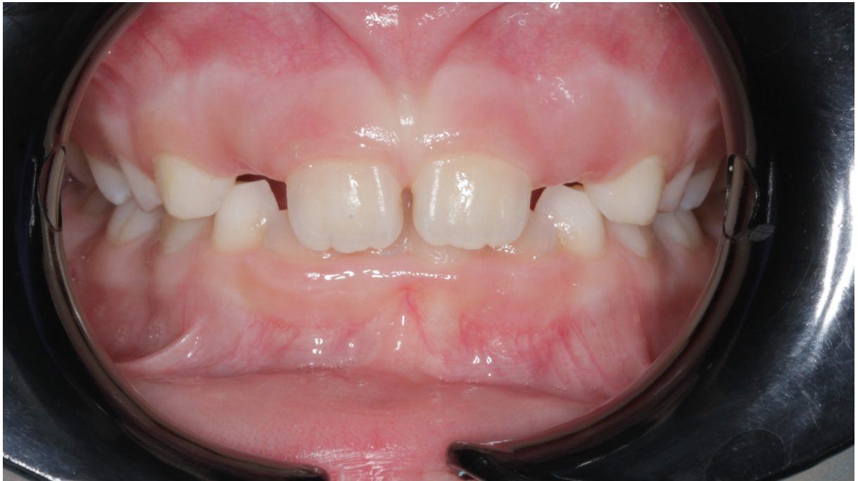
Рис.13 Даша К. прямая проекция прикуса до коррекции (глубокий травмирующий прикус)