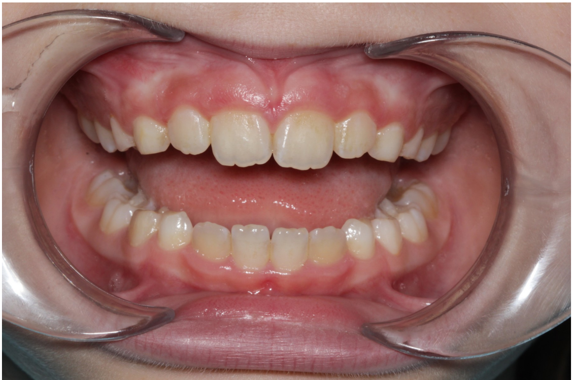
Рис.16 Даша К. прямая проекция после коррекции (правильное положение зубов)