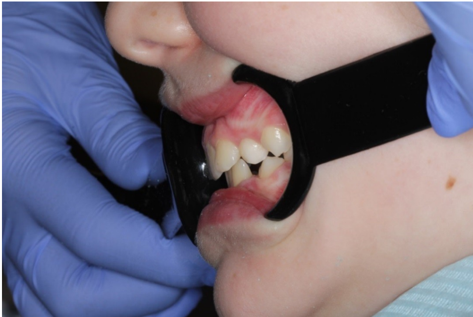
Рис. 35 Ирина Г. боковая проекция прикуса до коррекции (дистальный прикус)