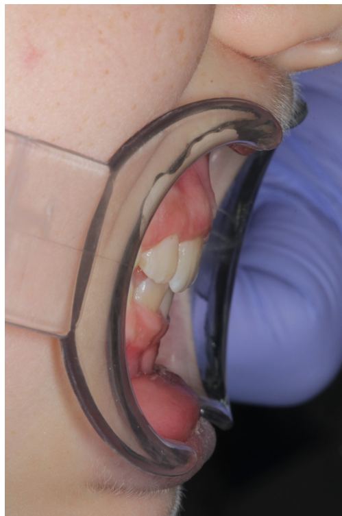
Рис.18 Даша К. боковая проекция прикуса после коррекции (правильное смыкание)