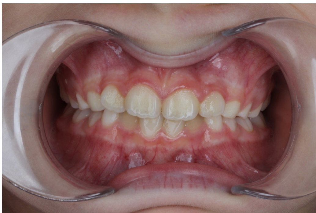
Рис. 26 Милана Г. прямая проекция прикуса после коррекции (дефицит места сохраняется, скучивание менее выражено)