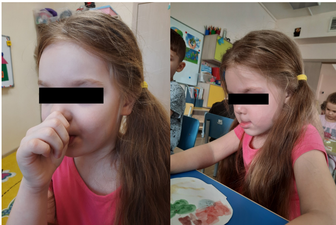
Рис.1 Вредная сосательная привычка