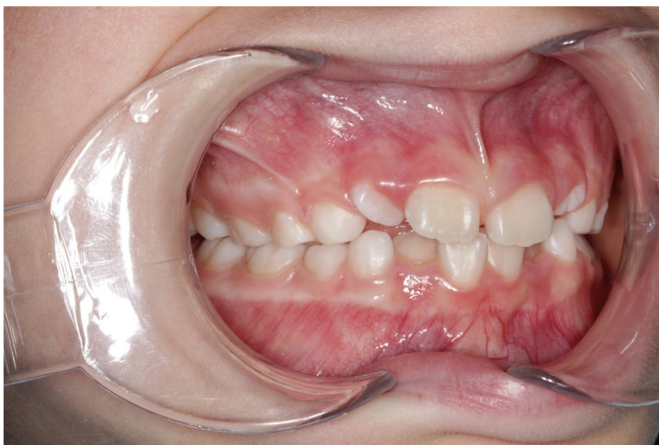
Рис. 29 Милана Г. полубоковая проекция прикуса до коррекции (призубное нижнее положение языка, дефицит места, скучивание зубов верхней и нижней челюсти, наклон зубов)