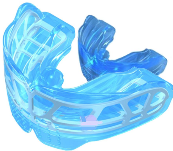
Рис.6 Трейнер второй ступени K2