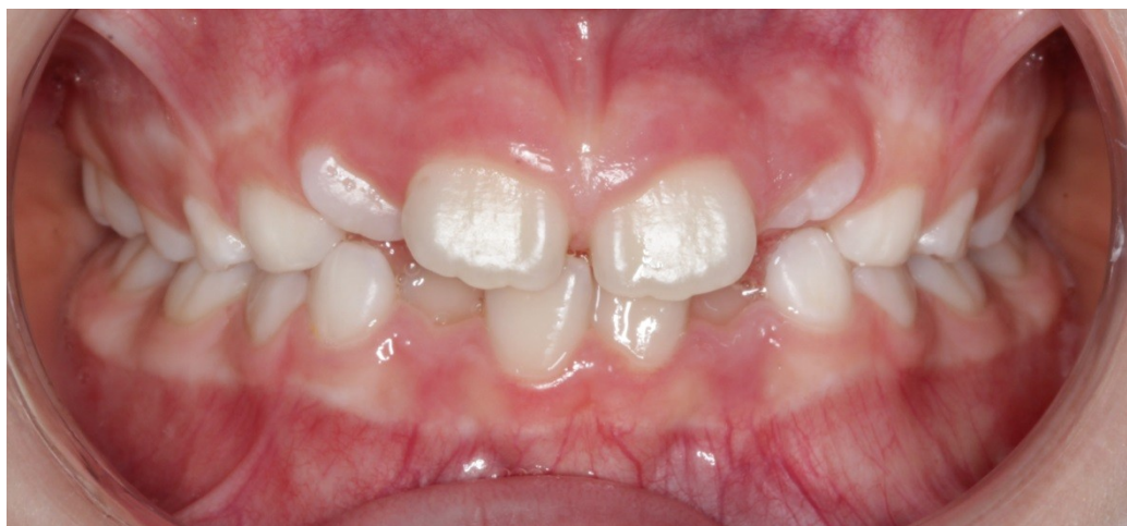
Рис. 25 Милана Г. прямая проекция прикуса до коррекции (призубное положение языка, дефицит места, скучивание зубов верхней и нижней челюсти)

Данные фотометрической диагностики состояния прикуса до и после миофункциональной коррекции (правильные мышечные функции сформированы и находятся в автоматизации).