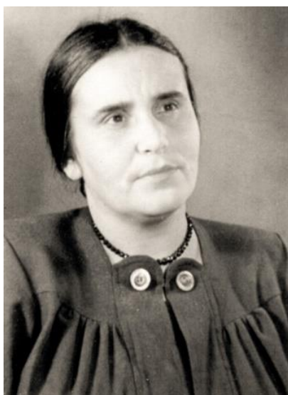
Рисунок 1 – Портрет Л. К. Татьяничевой

Часто цитируются строки из стихотворения поэтессы «Урал»: «Когда говорят о России, Я вижу свой синий Урал». Однако такая хрестоматийность не должна пониматься как признак творчества исключительно регионального художника. В лучших своих произведениях Людмила Татьяничева достигла подлинных высот поэтического мастерства. Поэтесса стоит в ряду самых ярких литераторов 20 века.