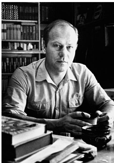
Рисунок 5 – Константин Скворцов

– «Самый поэтический драматург, самый драматичный поэт», – так писали о Константине Скворцове в периодике в начале 2000-х гг. [14]. Поэт родился 13 апреля 1939 году в Туле, в 1941 году семья Скворцовых была эвакуирована в Златоуст. Этот город стал Родиной драматурга, образ его горячо любим и поэтизирован в лирике Скворцова.