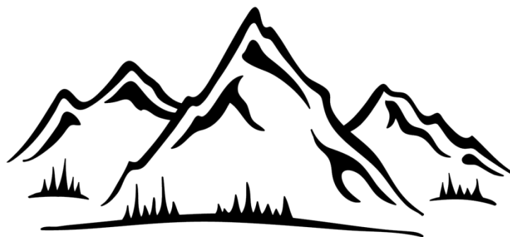
Рисунок 9 – Раздаточный материал для проведения рефлексии