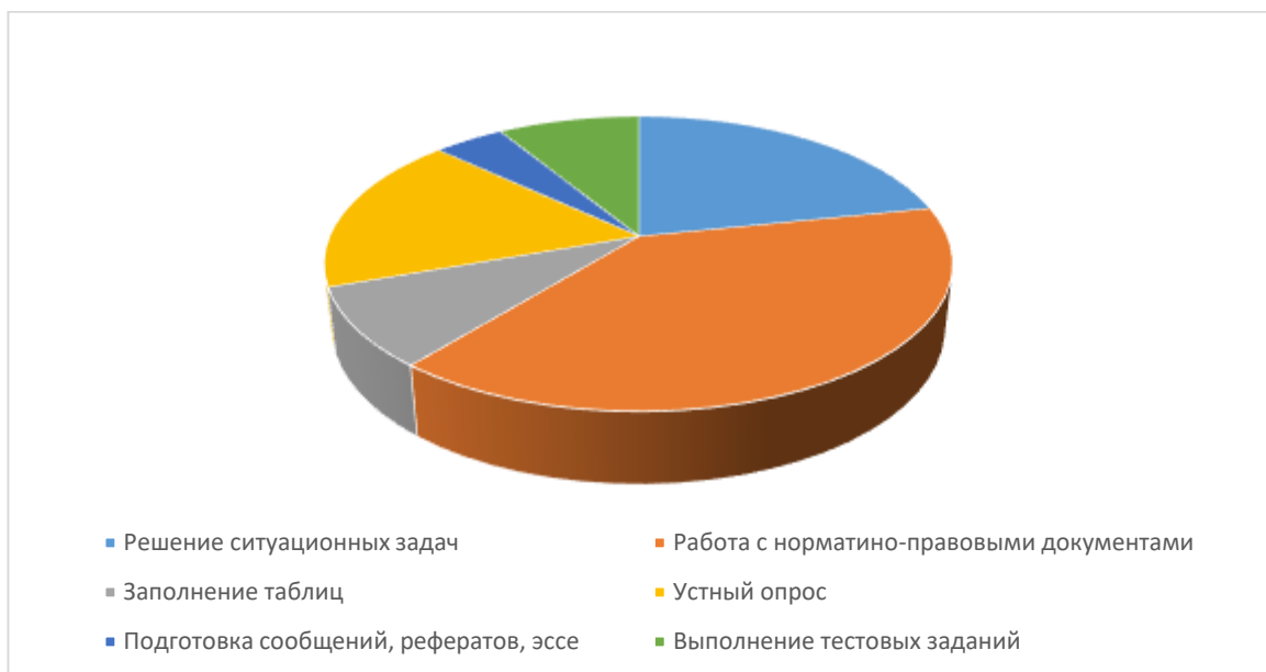
Рисунок 1 — Место тестов в системе средств контроля

На основе анализа средств и методов контроля, место тестов как средства именно текущего контроля знаний, было определено как незначительное (рисунок 1).