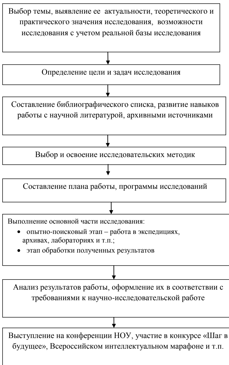
Рис. 2. Этапы научно-исследовательской деятельности старшеклассника

В исследовательском этапе учащиеся могут самостоятельно определять цели, задачи, добиваться результата в выбранной области деятельности. Степень их активности и самостоятельности зависит от личностных особенностей, способностей и знаний, приобретенных на предыдущем этапе. От педагога требуется координация, помощь в организации отдельных этапов работы. Итогом научно-исследовательской деятельности старшеклассника