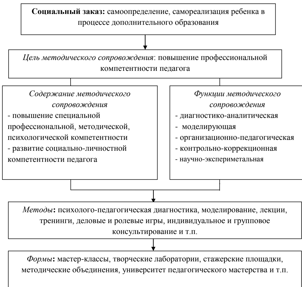
Рис. 3. Модель методического сопровождения деятельности учреждения дополнительного образования детей

Диагностико-аналитическая функция методической службы включает: