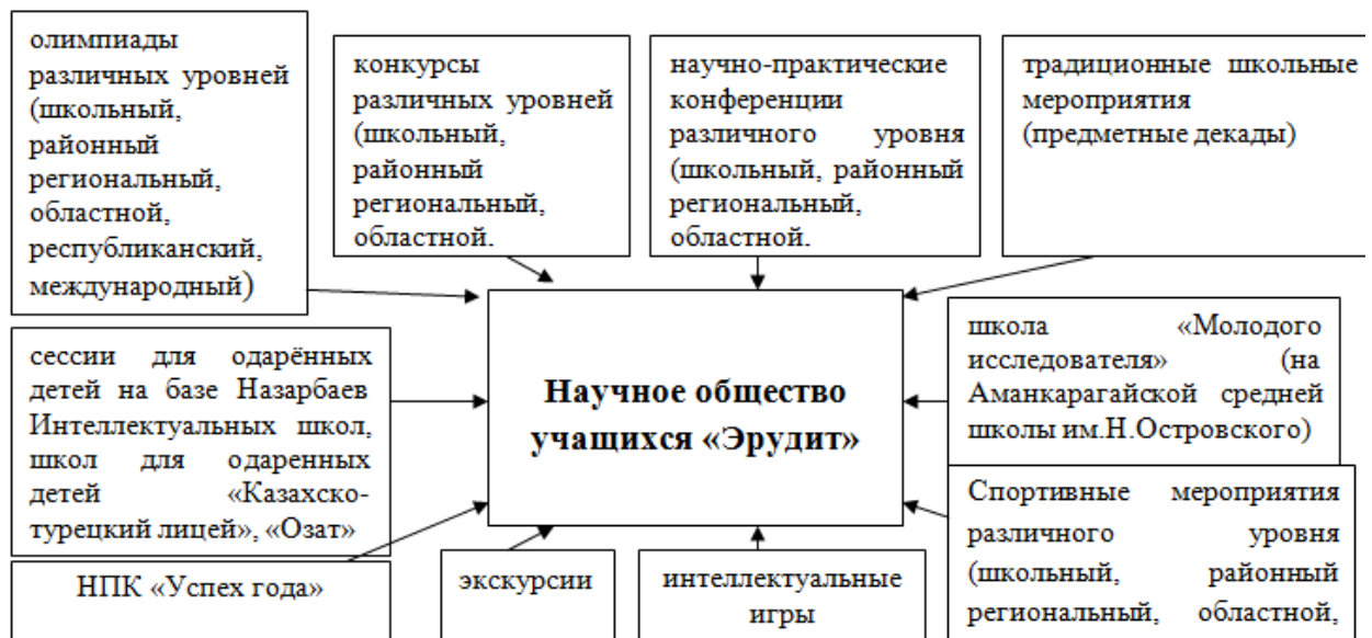
Рис. 4 Система работы научного общества учащихся «Эрудит»

Система работы научного общества учащихся «Эрудит» представлена на рисунке 4: