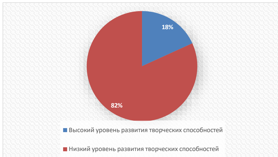
Рисунок 2. «Уровень развития творческих способностей студентов среди девушек».

быстрая адаптация к любым условиям на занятиях, они легко могут выполнять задания различной сложности и разновидности. Эти обучающиеся, действительно, развивают свои творческие способности. Они активно участвуют в жизни колледжа.