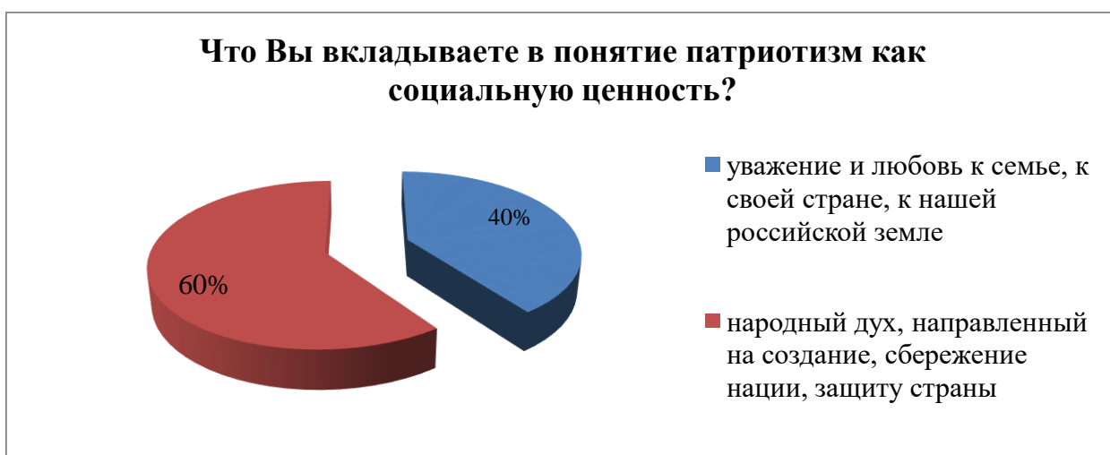
Рисунок 2 – Понятие патриотизма как социальной ценности

В понятие патриотизм как социальную ценность респонденты ставят на первое место уважение и любовь к семье, к своей стране, к нашей российской земле (12 человек, что составляет 60 %); народный дух, направленный на создание, сбережение нации, защиту страны вкладывают в понятие «патриотизм» 8 человек, что составляет 40 % опрошенных (рисунок 2).