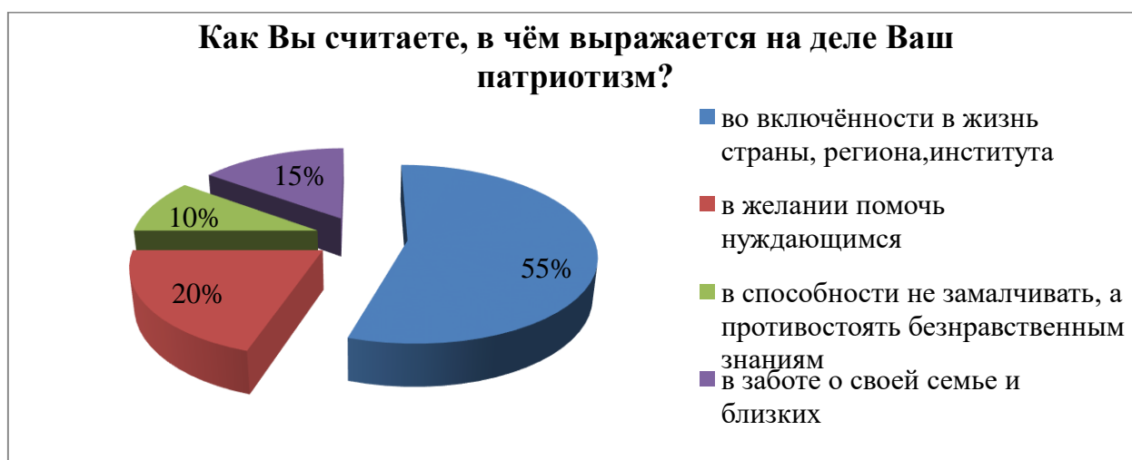
Рисунок 6 – Сущность патриотизма

11 (55 %) респондентов считают, что на деле их патриотизм выражается во включенности в жизнь страны, региона, института. 4 человека, что составило 20 %, ответили, что их патриотизм проявляется в желании помочь нуждающимся. 2-е – в способности не замалчивать, а противостоять безнравственным знаниям, что составило 10 % респондентов. И 3 человека (15 % опрошенных) выбрали ответ «в заботе о своей семье и близких» (рисунок 6).