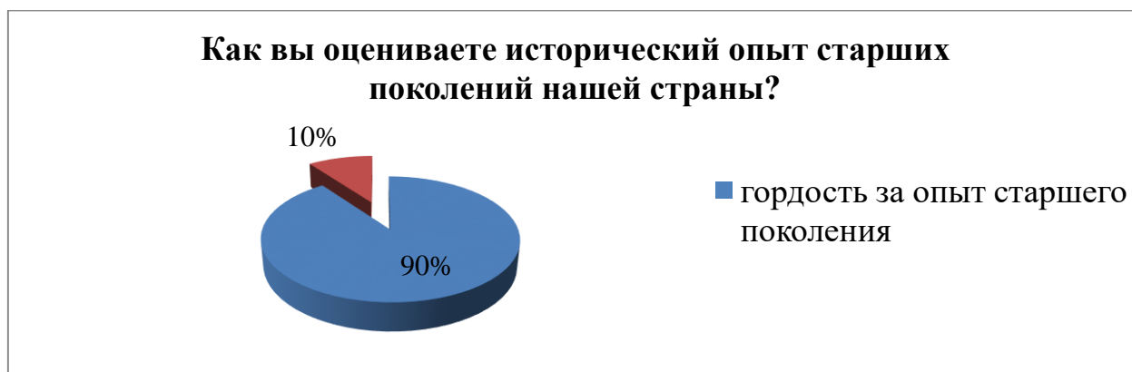
Рисунок 7 – Отношение к историческому опыту старших поколений

18 респондентов (90 % опрошенных) гордятся опытом старших поколений нашей страны, лишь 2-е (10 %) не принимают опыт старших или не хотят на него опираться (рисунок 7).