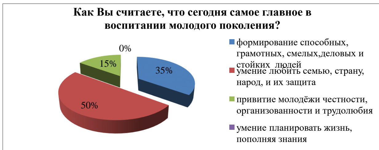
Рисунок 8 – Значимые моменты в воспитании молодого поколения

На сегодняшний день самым главным в воспитании молодого поколения половина респондентов (10 опрошенных, 50 %) выделяют умение любить семью, страну, народ и их защита. Привитие молодёжи честности, организованности и трудолюбия выбрали 3-е (15 %) опрошенных. 7 – формирование способных, грамотных, смелых, деловых и стойких людей (35 % опрошенных). Умение планировать жизнь, пополняя знания в качестве главного ориентира воспитания, не выбрал никто из респондентов (рисунок 8).