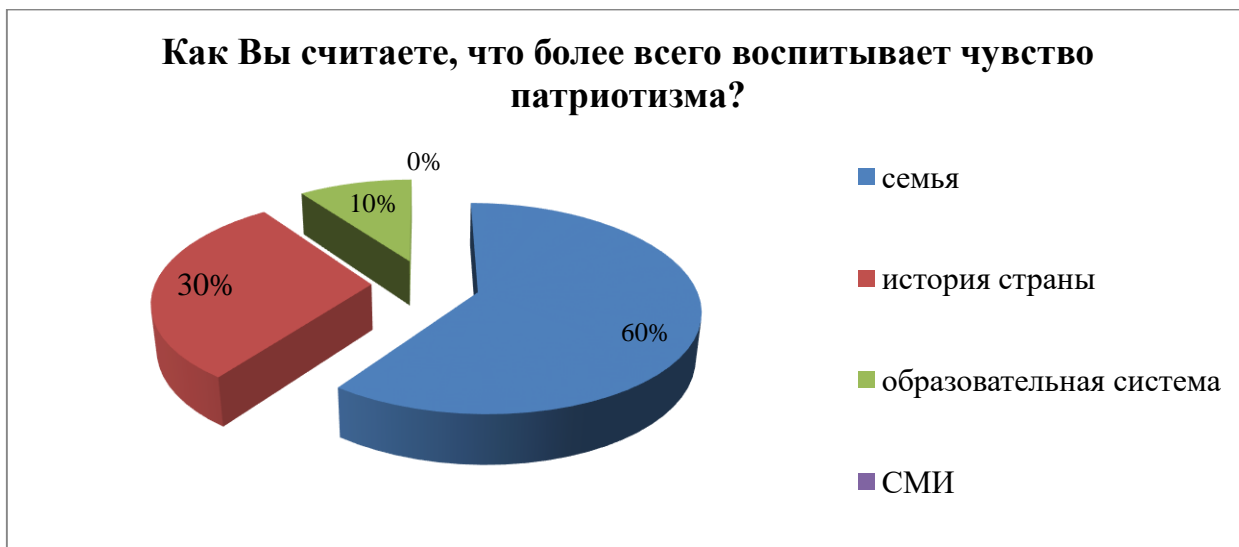
Рисунок 3 – Факторы, влияющие на воспитание чувства патриотизма

Подавляющее большинство опрошенных (12 человек – 60 %) считает, что более всего чувство патриотизма воспитывает семья, атмосфера семьи, отношения семьи к стране, её истории. Историю страны выбрали 6 человек. Образовательную систему – 2-е опрошенных, СМИ никто не выбрал из респондентов (рисунок 3).