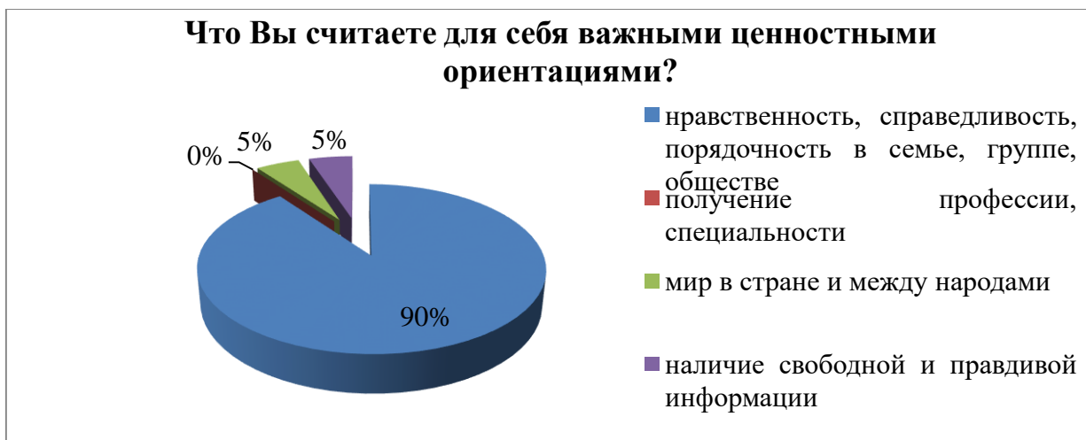
Рисунок 1 – Важные ценностные ориентации

В понятие патриотизм как социальную ценность респонденты ставят на первое место уважение и любовь к семье, к своей стране, к нашей российской земле (12 человек, что составляет 60 %); народный дух, направленный на создание, сбережение нации, защиту страны вкладывают в понятие «патриотизм» 8 человек, что составляет 40 % опрошенных (рисунок 2).