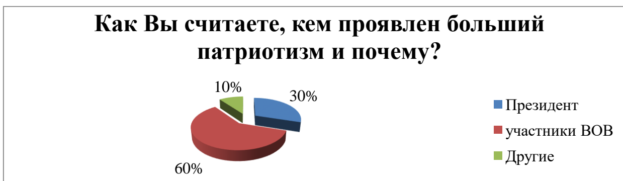
Рисунок 4 – Проявление патриотизма со стороны мировых и исторических личностей

Более половины опрошенных студентов основным образом патриота считают участников Великой Отечественной войны, 6 человек – Президента, и меньшинство остановили свой выбор на другом варианте, таком как В. И. Ленин (рисунок 4).