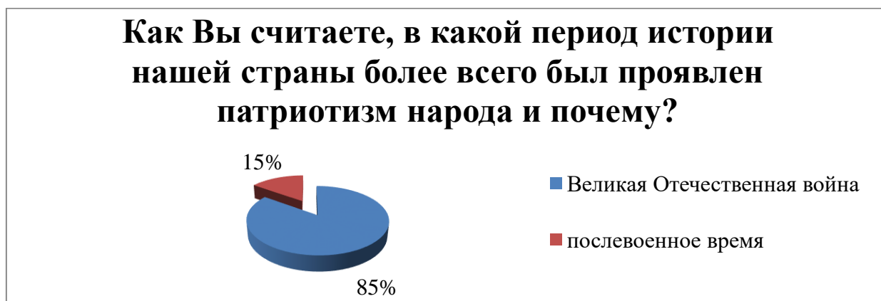
Рисунок 5 – Периоды проявление патриотизма народом в истории страны

В вопросе о том, в какой период истории наиболее проявлялся патриотизм, 17 (85 %) опрошенных ответили, что в Великой Отечественной войне с фашизмом, 3 человека – в послевоенное время (рисунок 5).