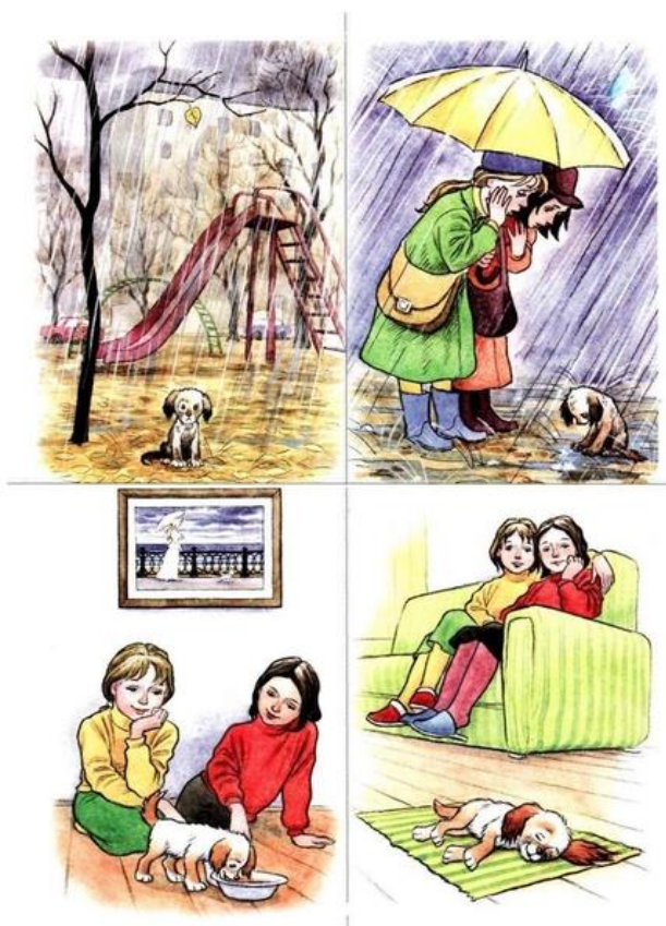
Рисунок 5 — Сюжетная картинка к игре «Расскажи мне»

Учитель показывает на экране фрагмент видео или сюжетную картинку, ученикам нужно составить рассказ, описывающий ситуацию от лица какого-нибудь присутствующего героя. Ученикам, испытывающим трудность в составлении рассказа, нужно задавать наводящие вопросы. Например, к сюжетной картинке про собаку (рисунок 5) можно задать следующие вопросы: «Как могли бы звать собаку?», «Предположите, почему собака осталась на улице?», «Подумайте, как связана погода и ситуация, которая произошла с собакой?», «Какие эмоции испытывала собака, когда ее забрали домой?», «Как дальше могла развиваться история собаки?», «Что сказали девочкам родители?», «Какие эмоции, чувства испытывали девочки?», «Подберите прилагательные, описывающие девочек, собаку, погоду, настроение?».