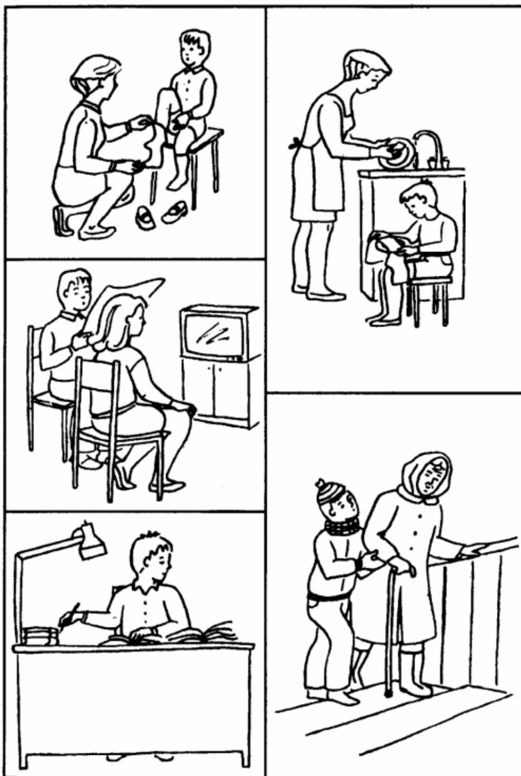
Рисунок А.2 — Картинка, используемая при повторном проведении методики по изучению уровня активного словарного запаса