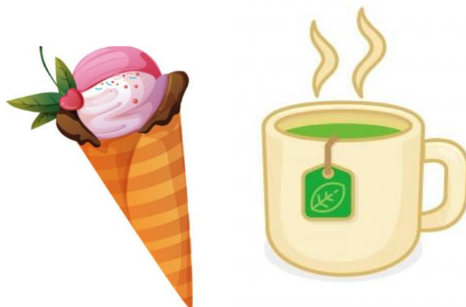
Рисунок 1 — Примерное изображение к игре «Противоположное»

из которых будет несколько слов-антонимов, а задачей детей — найти пары слов и записать их. Например, представлены две картинки (рисунок 1), пара антонимов к ним «холодный — горячий».