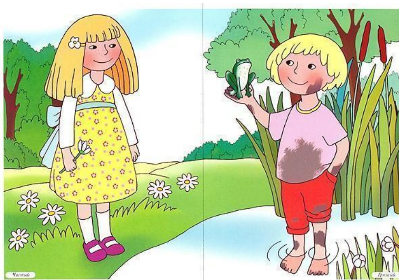
Рисунок 2 — Примерное изображение к игре «Противоположное» с последующим рассказом

Другой вариант этого задания может быть следующим: представлена сюжетная картинка (рисунок 2), слова-антонимы к ней — «мальчик-девочка», «чистый — грязный», «короткие — длинные», «суша — вода». После того, как дети назвали все пары антонимов, можно предложить им составить устный рассказ по картинке, используя их.