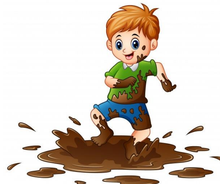
Рисунок 4 — Примерная картинка к фразеологизму «грязный, как свинья»