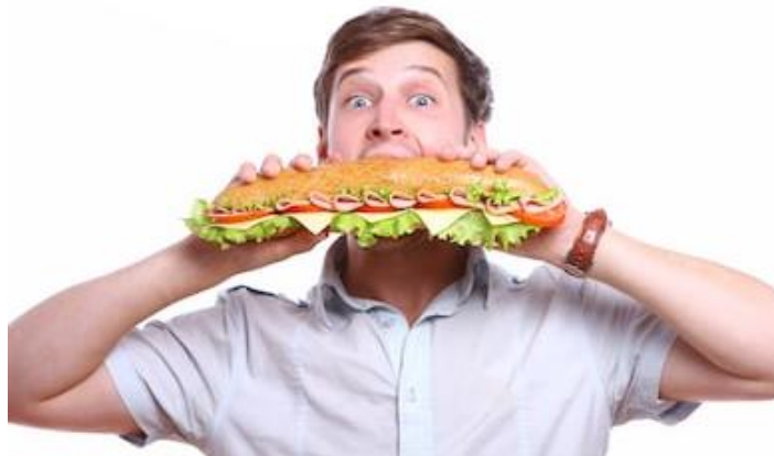
Рисунок 3 — Примерная картинка к фразеологизму «голоден, как волк»