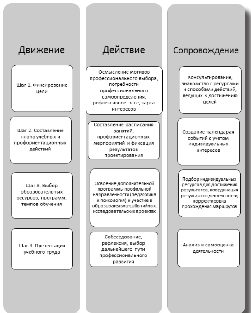
Рис. 1. Последовательность движения по индивидуальному образовательному маршруту

вания профильных классов педагогической направленности при университете через систему локальных актов вуза, правовой статус дополнительной общеразвивающей программы (педагогика и психология), прохождения профессиональных проб, а также индивидуального образовательного маршрута учащихся для получения качественного допрофессионального образования на основе персонализированных запросов, возможностей и потребностей обучающихся.