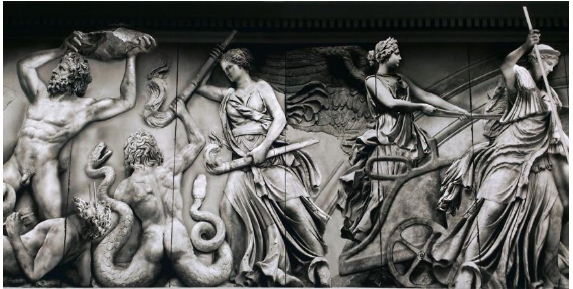
Приложение 10. Пергамский алтарь 39