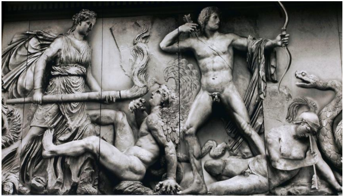
Приложение 9. Пергамский алтарь 38