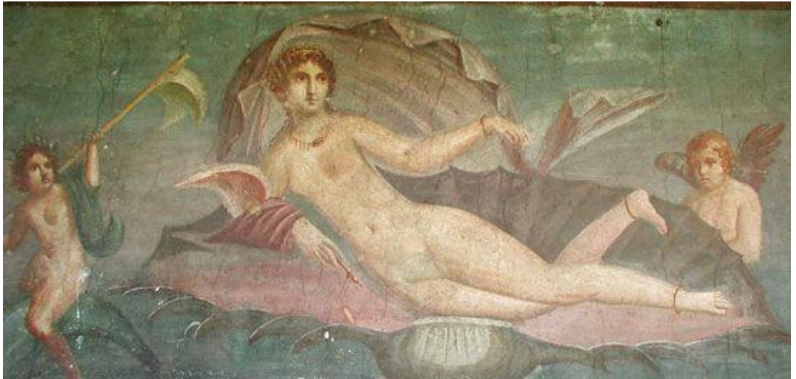
Приложение 13. Апеллес. Афродита Анадеомена 42