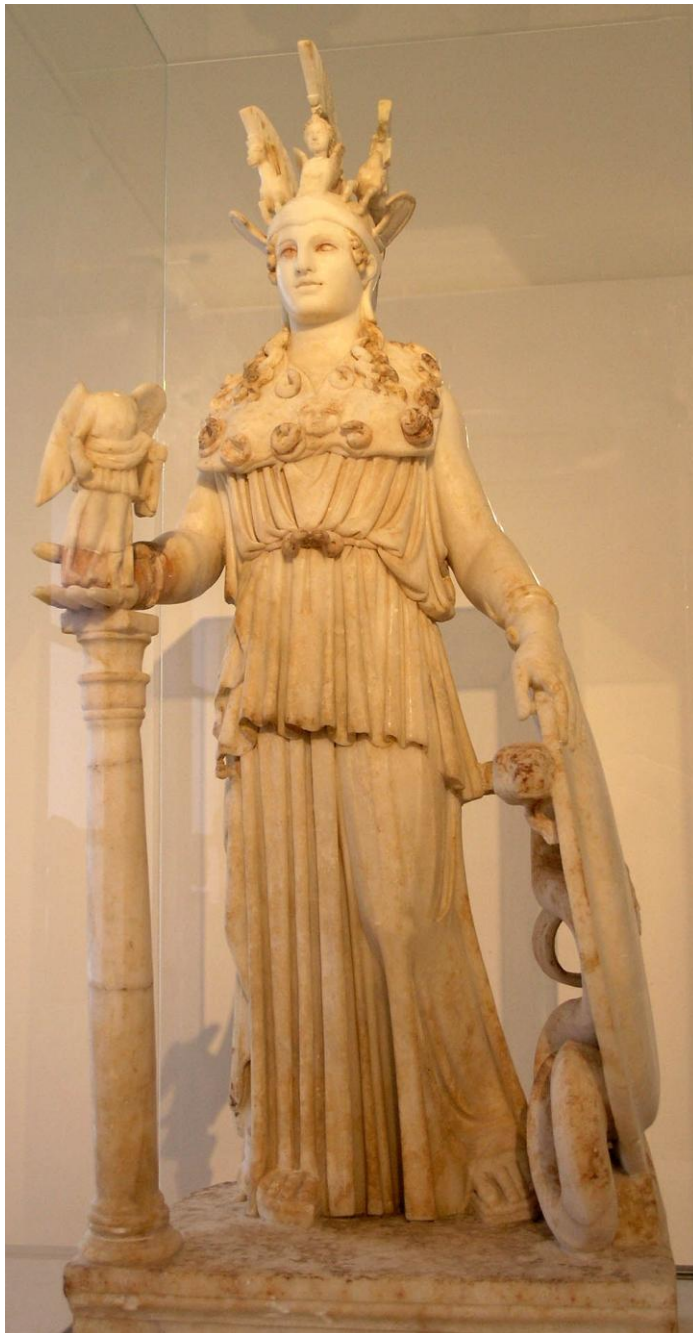
Приложение 3. Фидий. Афина Парфенос 32