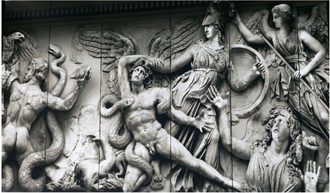
Приложение 12. Пергамский алтарь 41