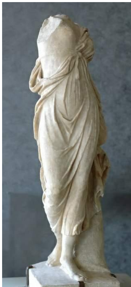
Приложение 5. Лиссип Муза 34