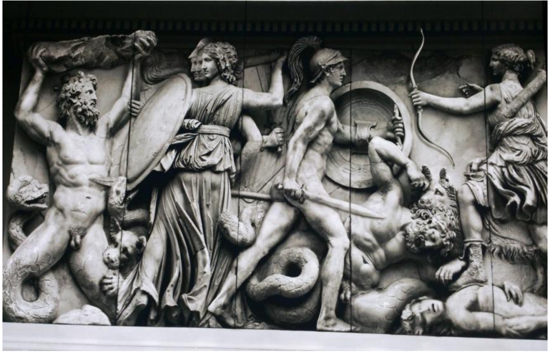
Приложение 8. Пергамский алтарь 37