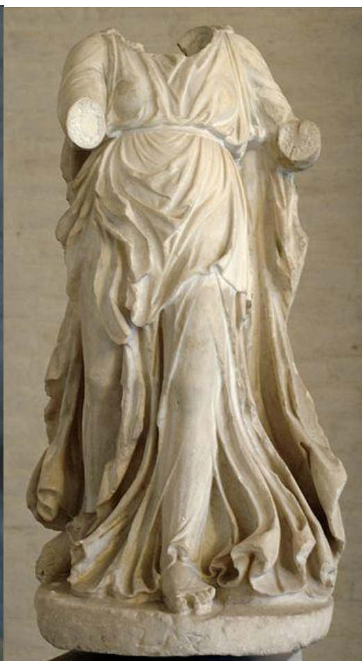
Приложение 6. Лиссип. Праксилла 35