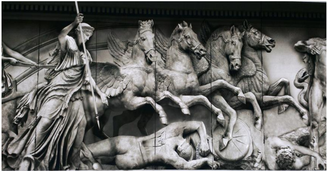
Приложение 11. Пергамский алтарь 40