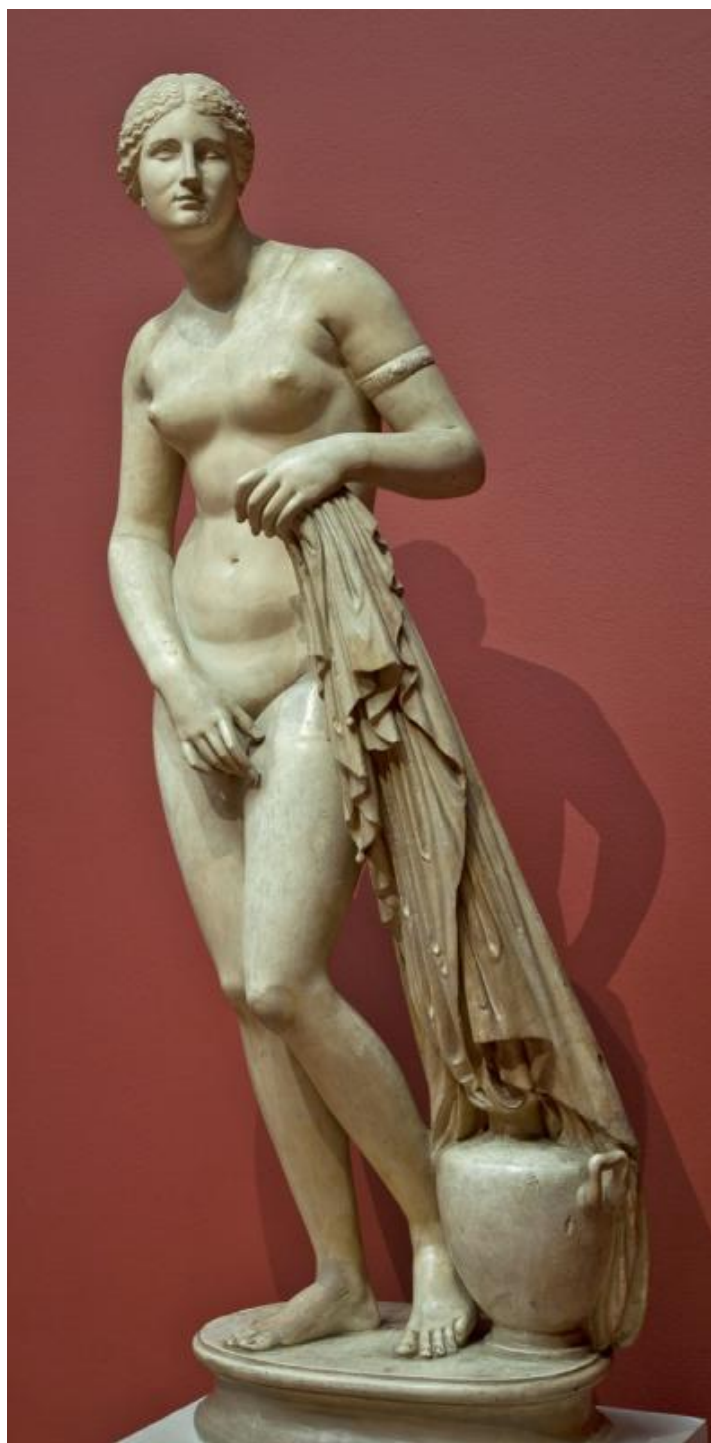
Приложение 1. Пракситель. Афродита Книдская 30