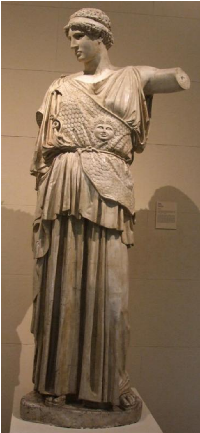
Приложение 4. Фидий. Афина Лемния 33