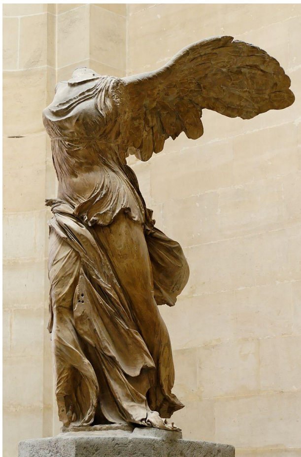
Приложение 7. Пифокрит. Ника Самофракийская 36