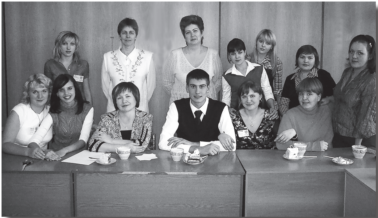
Соуправление на факультете

В 2005–2010 годах факультет осуществил несколько Всероссийских проектов. В эти годы по нашей инициативе были проведены две Всероссийские олимпиады по педагогике и методике начального обра-