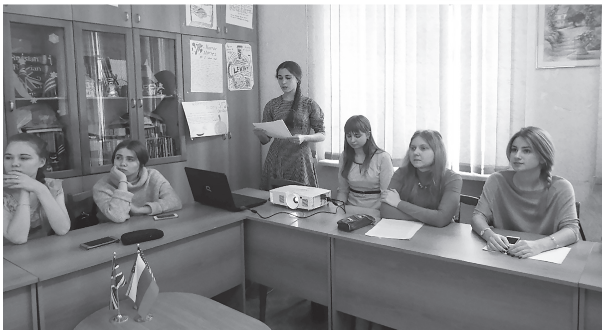
Выпускники 2022 г. делают свои первые доклады по межкультурной коммуникации на первом курсе