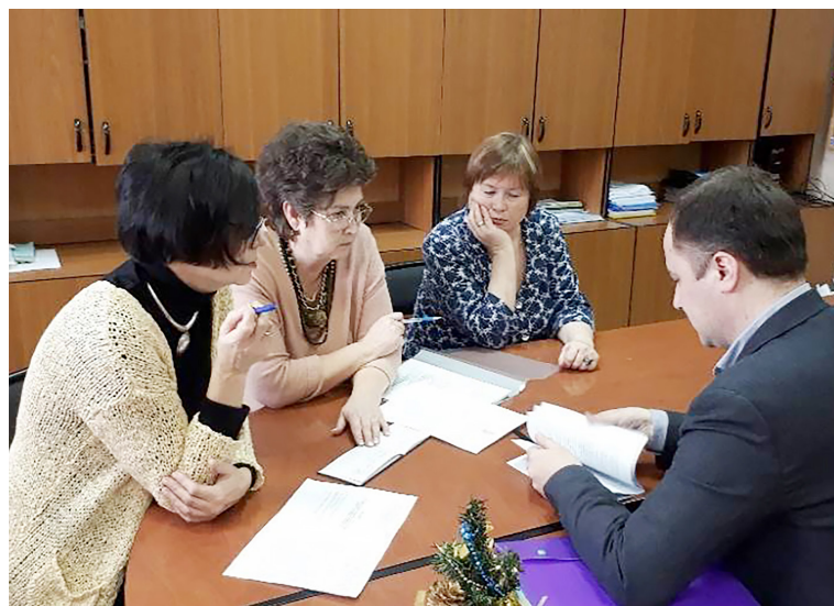
Работа на кафедре ПШИПМ