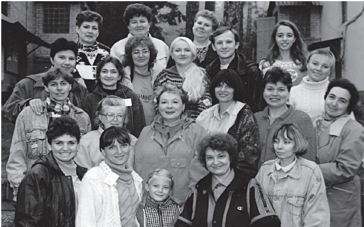
Преподаватели и студенты факультета на адапционных сборах в СОЛ «Чайка»