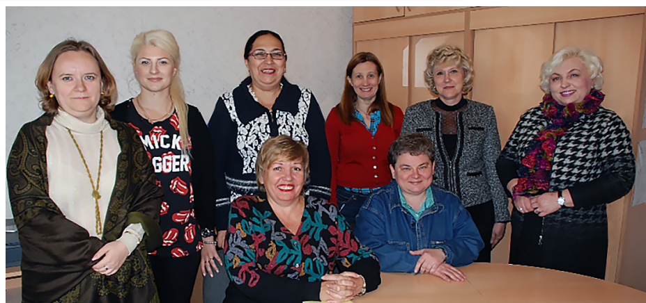
Кафедра русского языка, литературы и методики обучения русскому языку и литературе