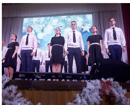
Новогодний концерт 2022 г.