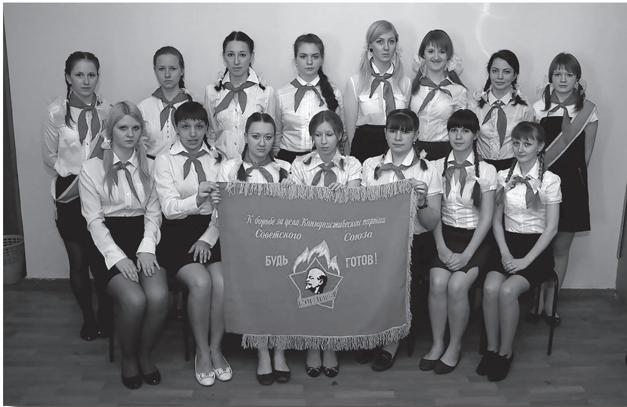
Команда факультета подготовки УНК в конкурсе «ЛИМПОПО»

Под руководством доцента, кандидата педагогиче-