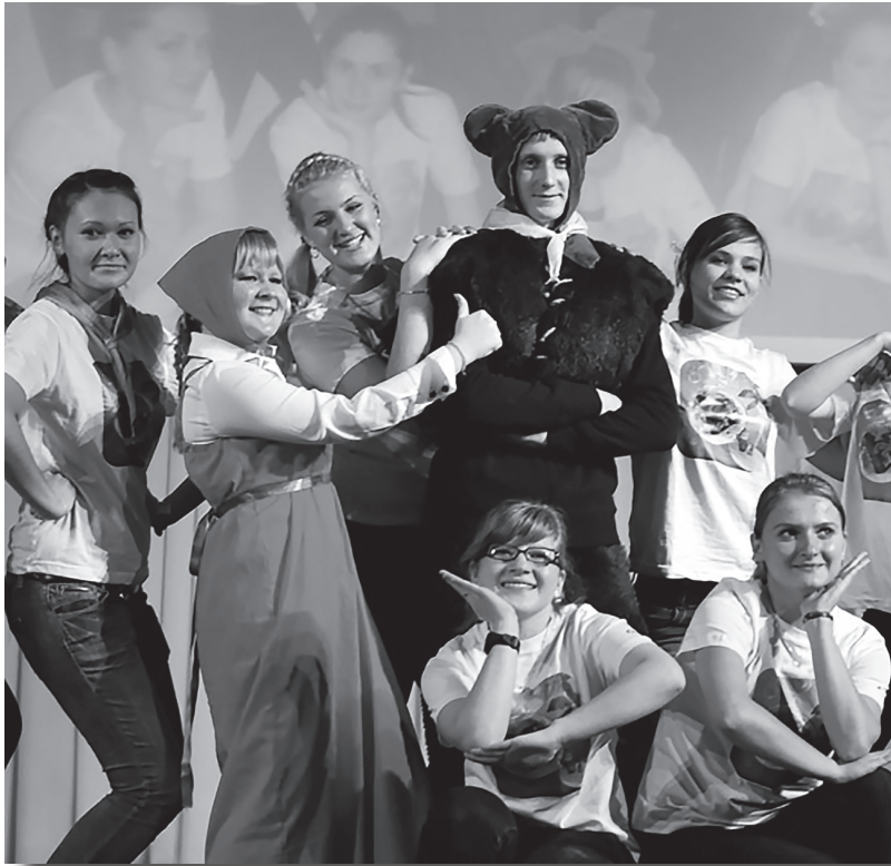
Участники факультетской команды на конкурсе «Весна студенческая»

Сам фестиваль в ЮУрГГПУ проводился с 1997 года в виде жанровых конкурсов с подведением итогов. «Весна студенческая» сегодня на уровне университета является трамплином для студентов на пути масштабного фестиваля «Российская студенческая весна».