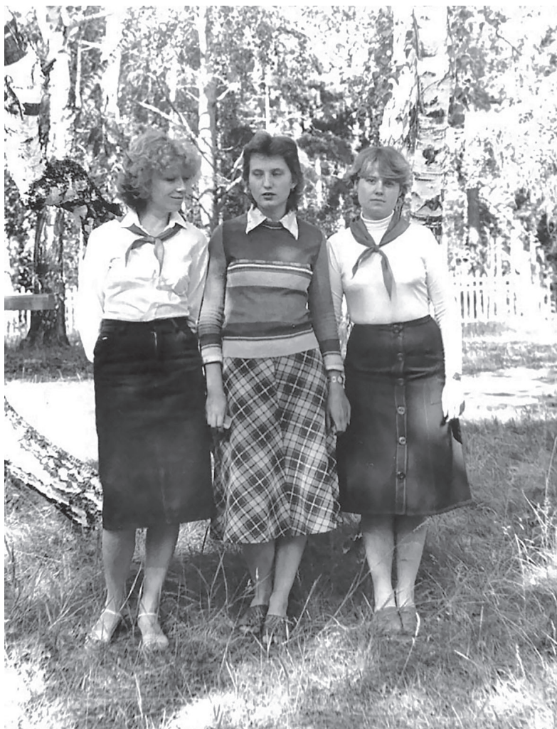
На практике в пионерском лагере