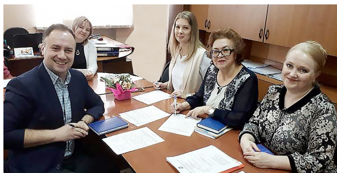
Творческая группа кафедры ПШИМ