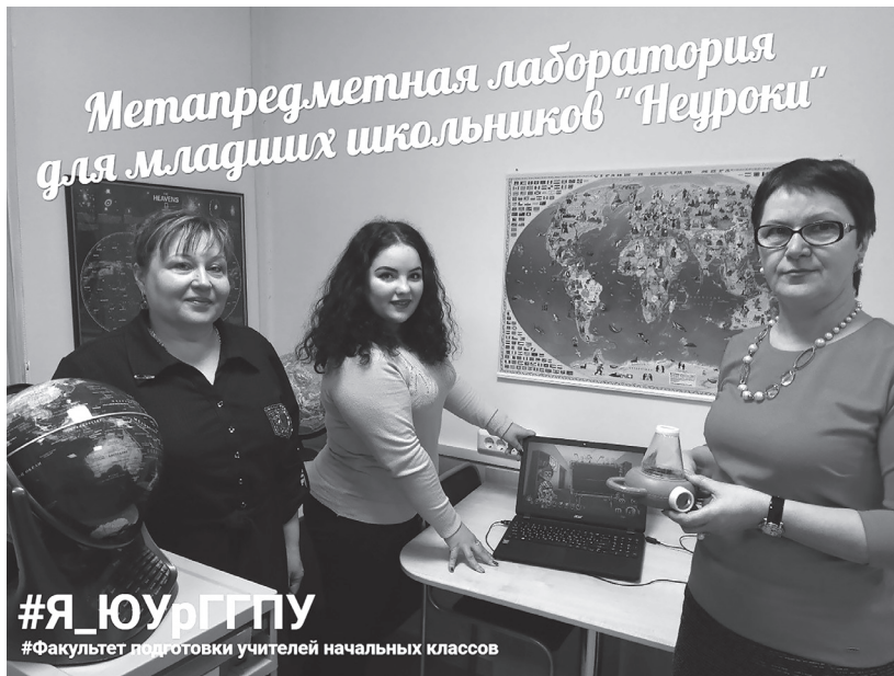
Метапредметная лаборатория «Неуроки»