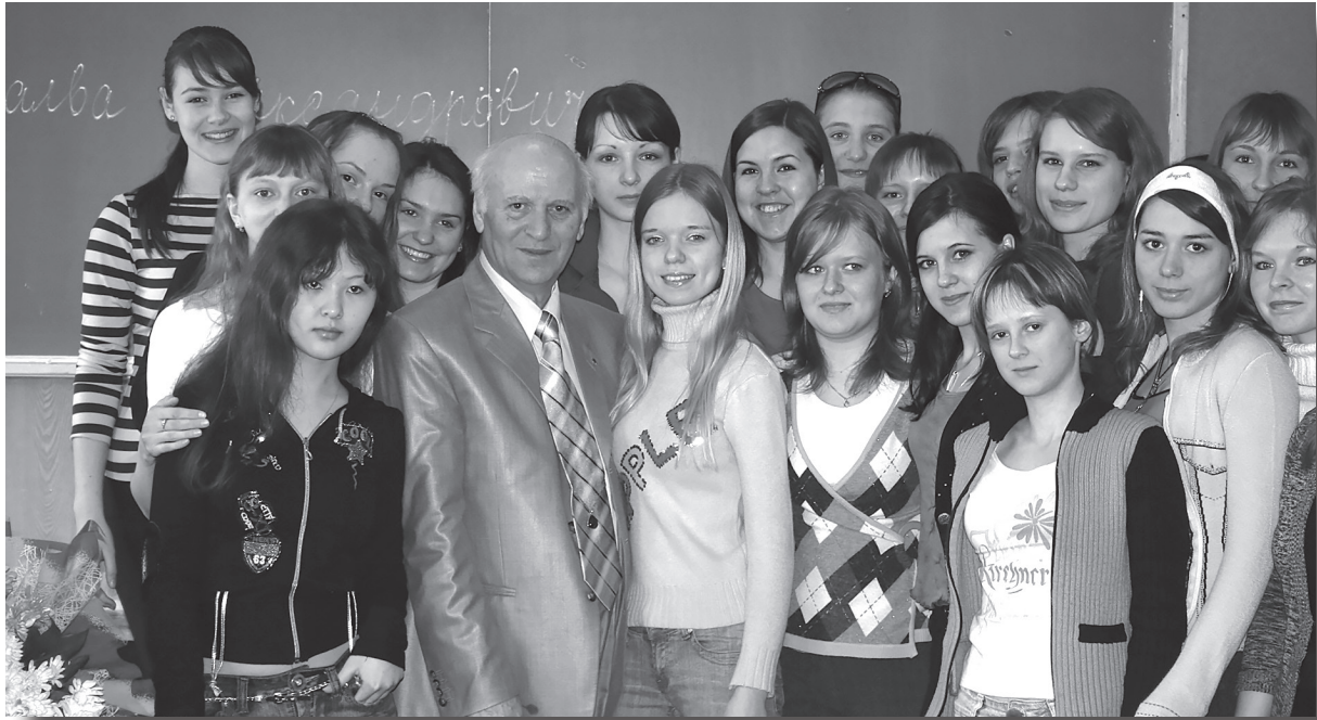
2007 г. Встреча с Ш.А. Амонашвили

годаря этому установлены партнерские отношения с Московским городским психолого-педагогическим университетом, Челябинским Епархиальным Управлением Русской Православной церкви, Региональным духовным управлением мусульман Челябинской и Курганской области и Кирилло-Мефодиевским просветительским обществом, образовательными организациями г. Челябинска.