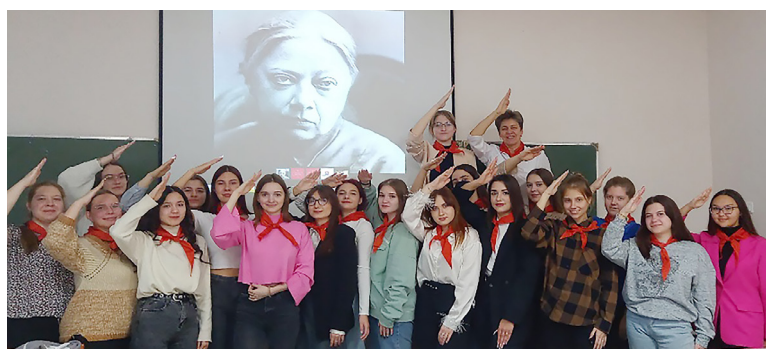
Лекция о Н.К. Крупской