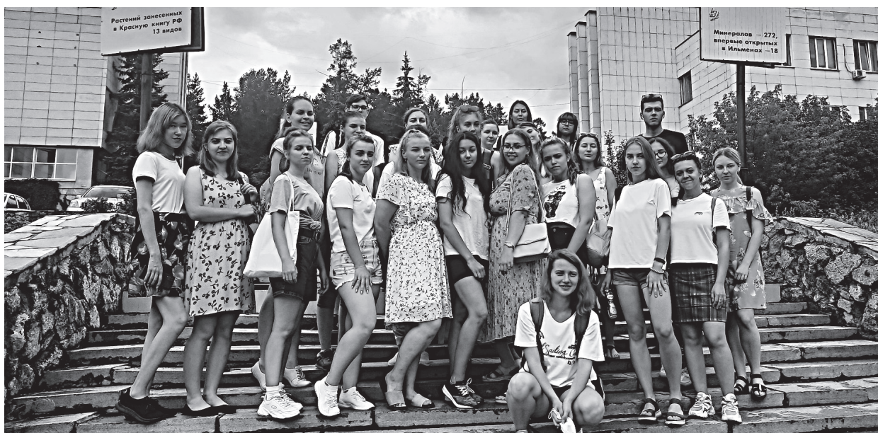
Учебно-полевая практика. Ильменский заповедник 2021 г.