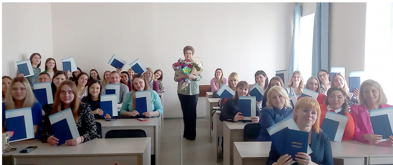
Вручение дипломов магистрам 2023 г.