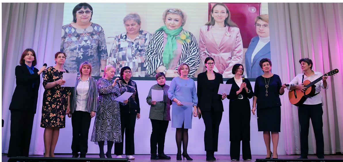
День рождения факультета