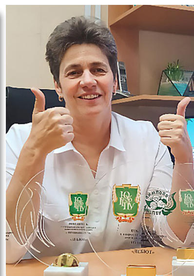
Юбилейная победа в «Лимпопо»