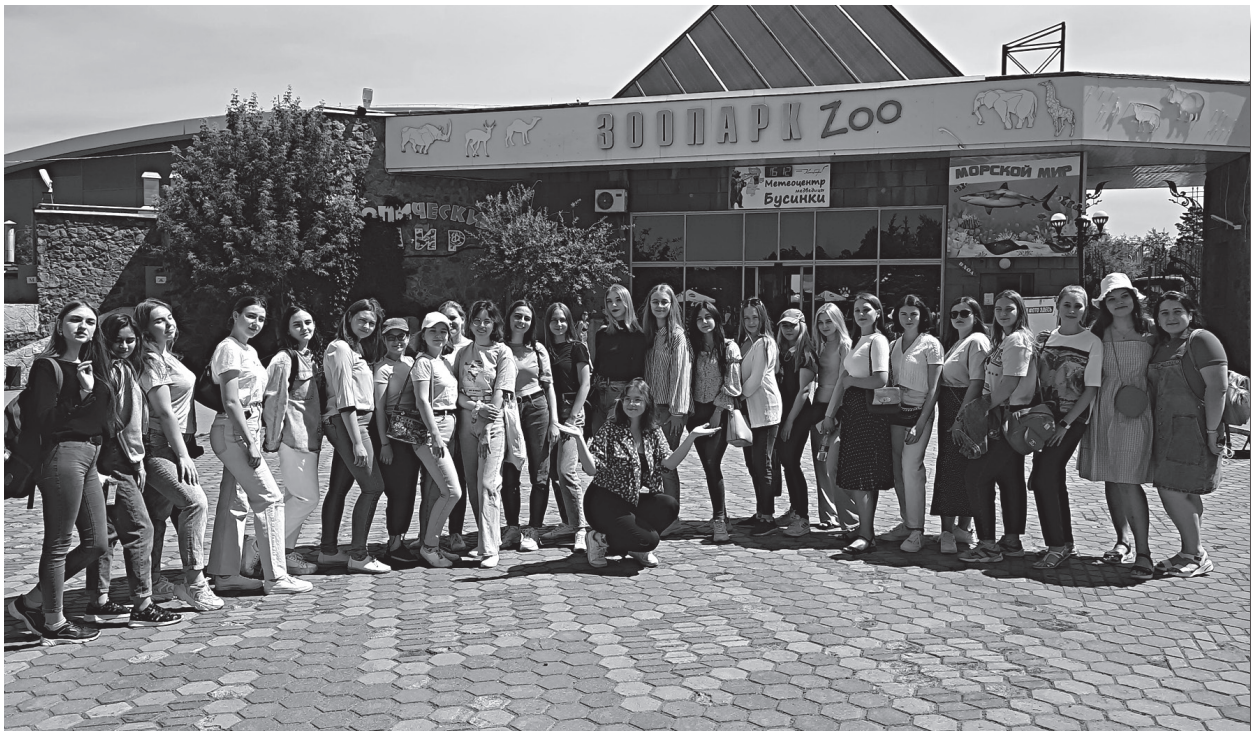
Экскурсия студентов факультета в Челябинский зоопарк

Студенты факультета подготовки учителей начальных классов не только учатся, получают знания на занятиях, но и посещают культурно-массовые мероприятия. В апреле 2022 года студенты выпускных групп в рамках спецкурса «Внеурочная деятельность в начальной школе» посетили президентский центр – музейный комплекс имени Бориса Ельцина в городе Екатеринбурге. В сентябре 2022 года студенты посетили выставку «Пабло Пикас-