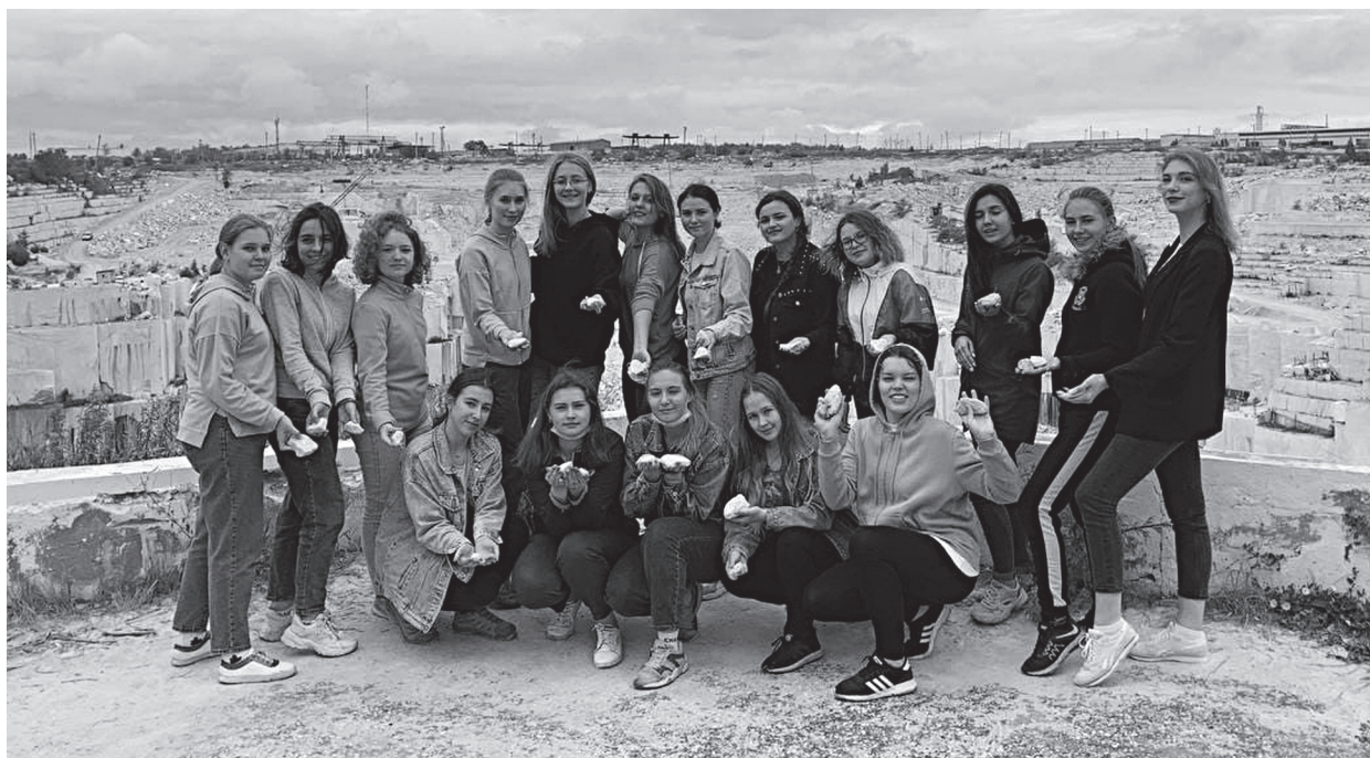
Студенты на учебно-полевой практике. Мраморный карьер. Коелга