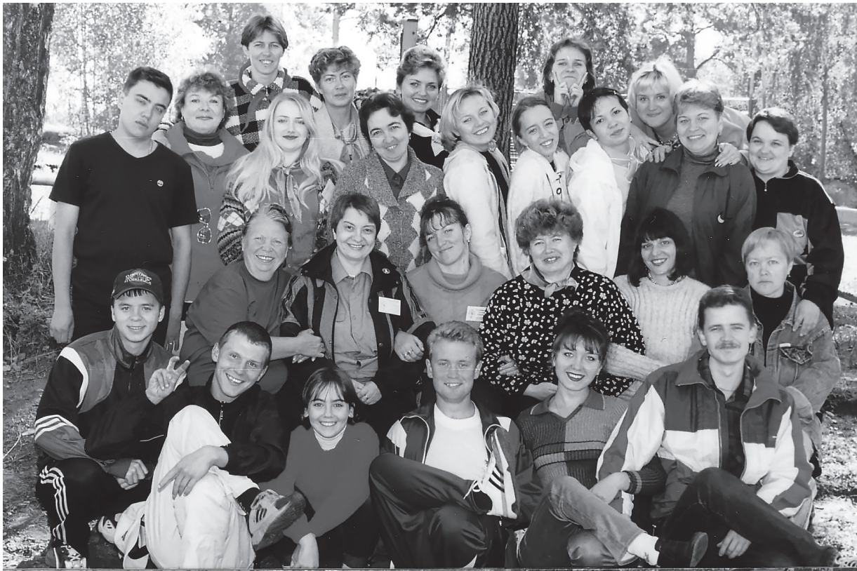
На адапционных сборах в СОЛ «Чайка»