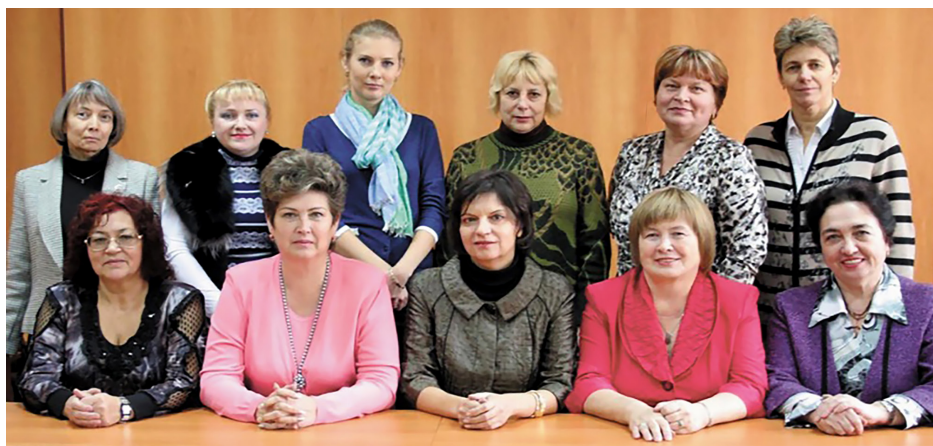
Кафедра педагогики, психологии и предметных методик