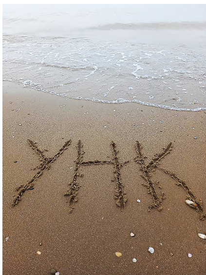
В ВДЦ «Орлёнок»