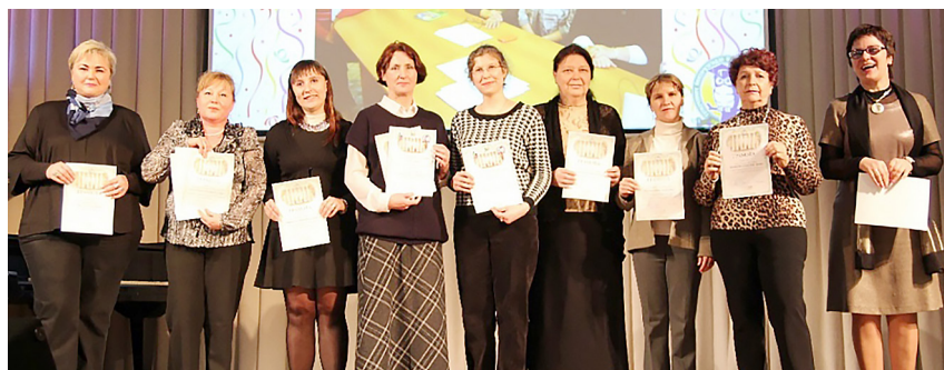
Награждение кафедры математики, естествознания и МОМиЕ