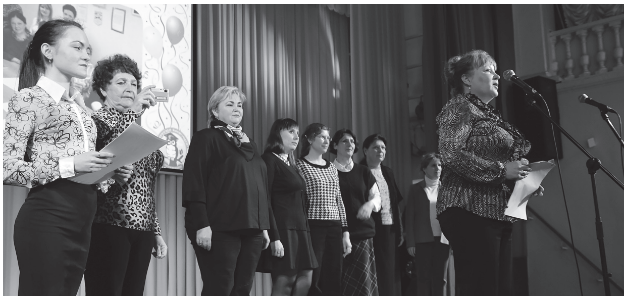
Выступление кафедры на дне рождения факультета