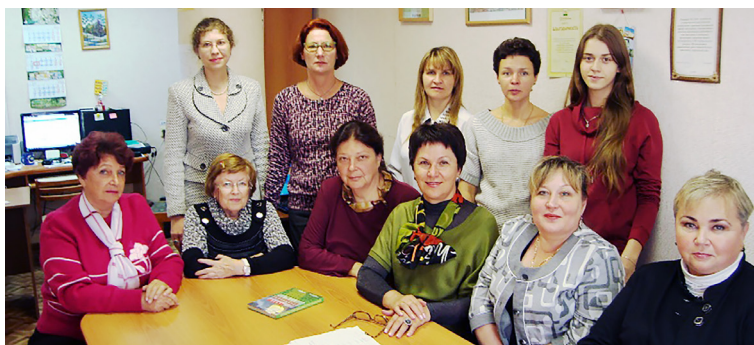
Кафедра математики, естествознания и МОУиЕ