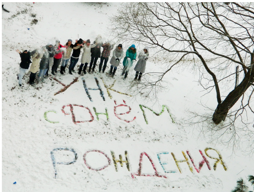
Студенты поздравляют родной факультет с Днём рождения