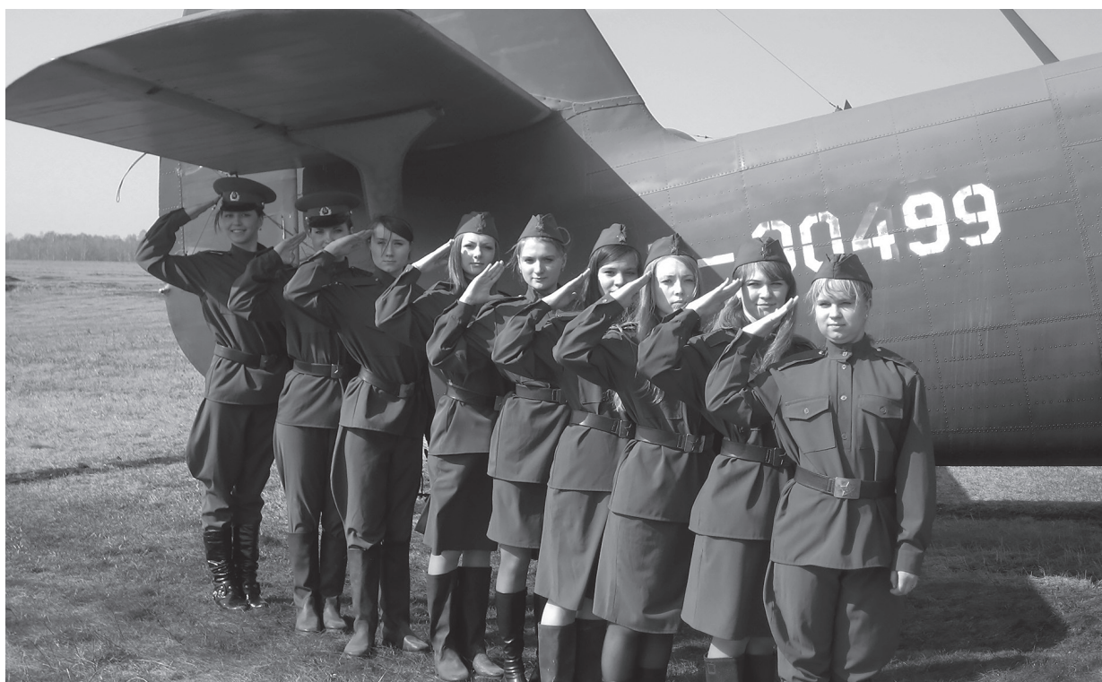
Участники конкурса инсценированной военной песни к 9 Мая