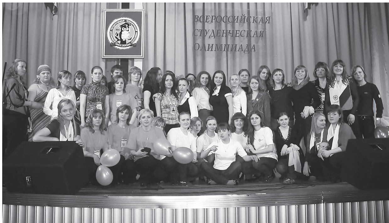
2008 г. Всероссийская студенческая олимпиада

После защиты продолжала научно-исследовательскую и практическую работу по данному направлению. Бла-