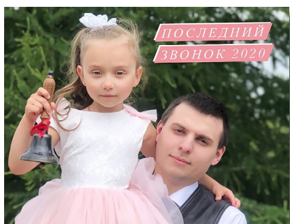
Последний звонок 2020 г.