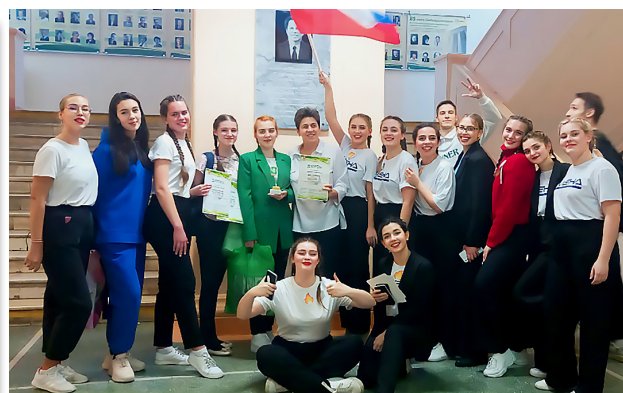
Победа в конкурсе вожатых «ЛИМПОПО»