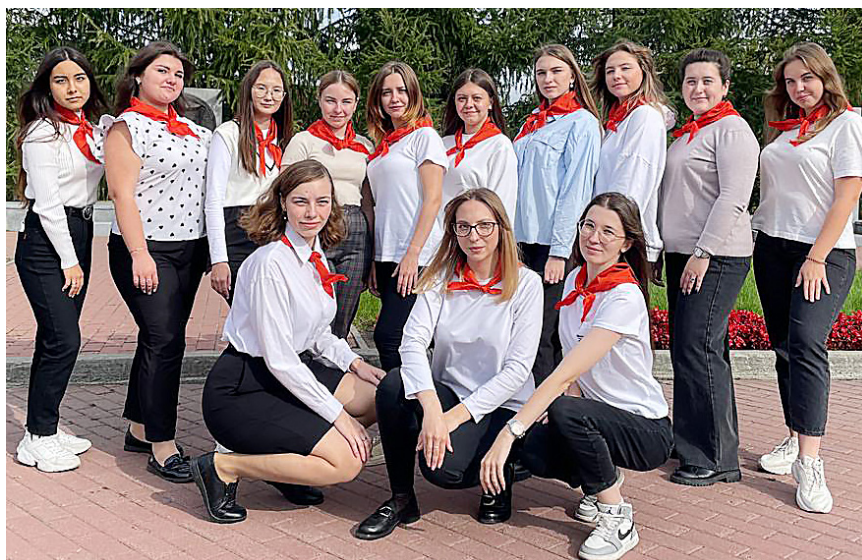
«Лимпопо» 2023 г.