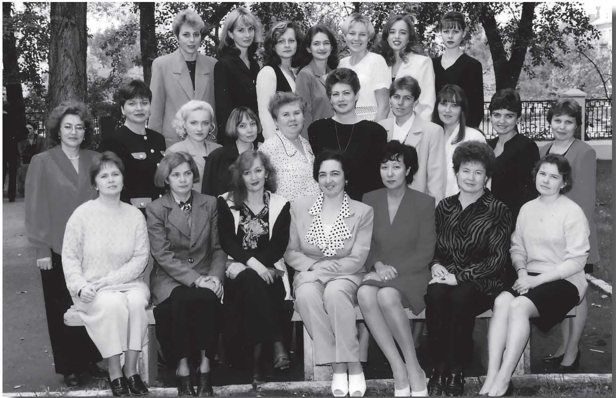
Преподаватели и студенты факультета в День знаний

ты факультета подготовки учителей начальных классов и курсанты Челябинского высшего военного авиационного Краснознамённого училища штурманов. Идея творческого союза была воплощена 12 июня 2019 года – и с тех пор ребята не раз принимали участие в совместных мероприятиях. За три года работы состав объединения поменялся. Многие курсанты из первого состава теперь далеко, на службе, но