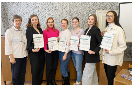
Награждение за участие в выставке «Россия»