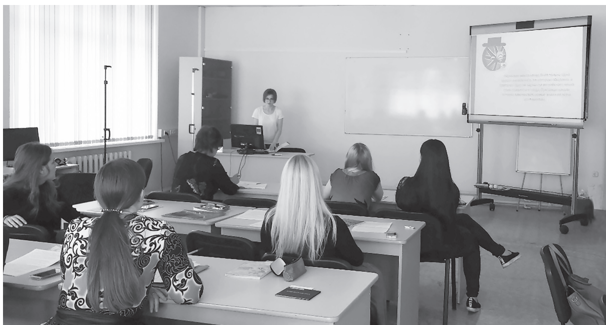
Универсиада 2017. Секция по лексикологии, 383-я группа