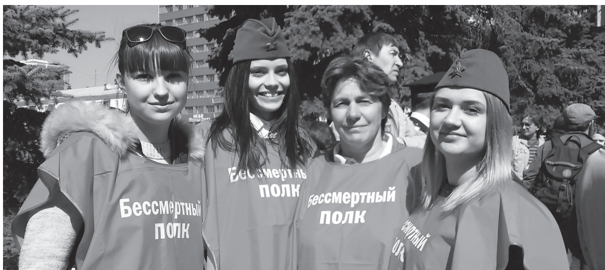
Шествие Бессмертного полка