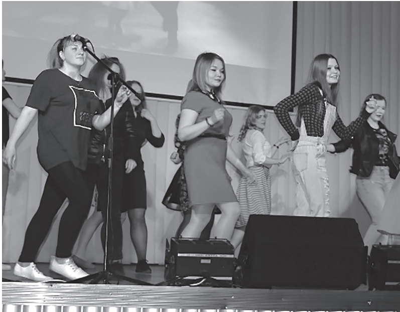
Фестиваль культуры стран изучаемого языка в 2016 г. Представление с песенными и танцевальными номерами