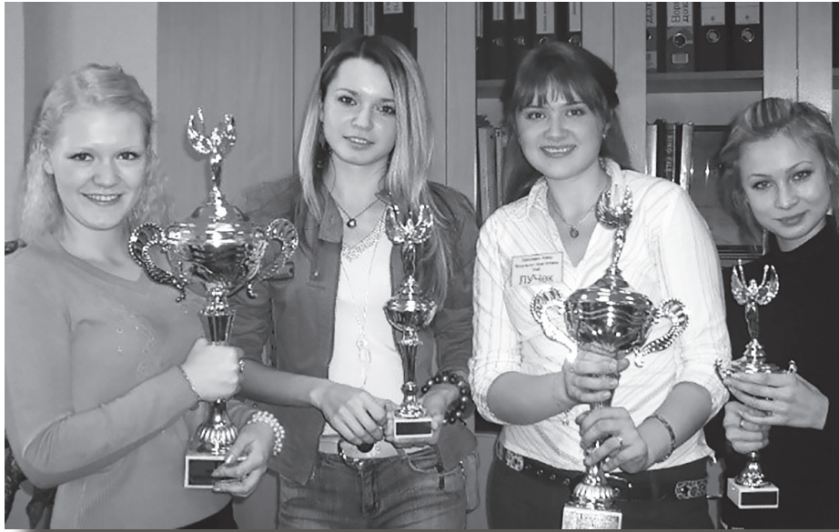
Студенты с наградами, полученными факультетом