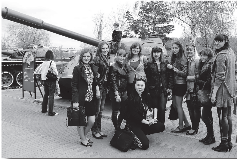
Экскурсия в музей военной техники

стве в суровые годы войны, как они выживали. Ветераны пожелали студентам воспитать достойное поколение, которое в будущем сможет защитить наше Отечество. Такие встречи дают уникальную возможность студентам узнать о событиях минувшей войны из первых уст. Ветераны, дети войны, за плечами которых годы тяжелейшего военного времени, – это пример мужества, самоотверженности, любви к Родине.