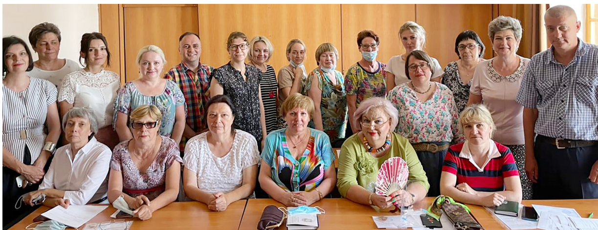
Совет факультета 2021 г.