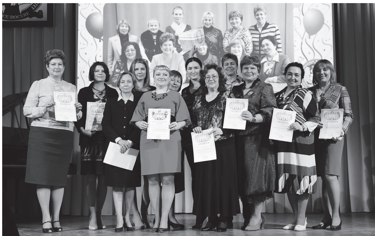
Преподаватели ПШиПМ на сцене актового зала

шой плавный стол, за который можно было сесть всем.