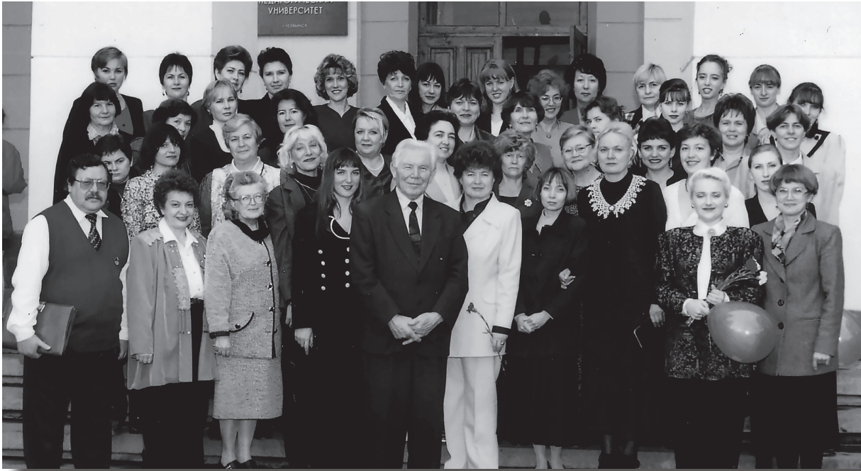
Преподаватели нашего факультета