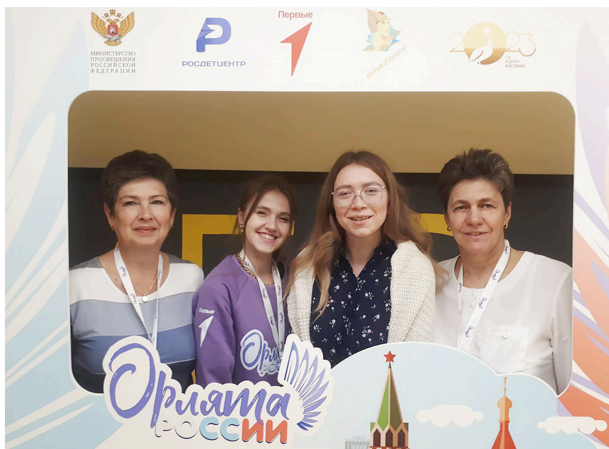
Всероссийское совещание кураторов программы «Орлята России», Москва, 2023 г.