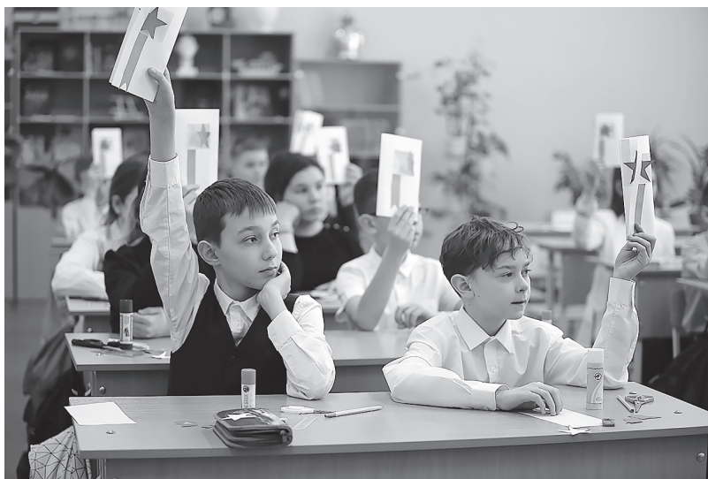
Практика в начальных классах