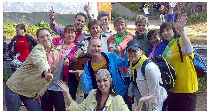
Адаптационные сборы I курса в СОЛ «Чайка»