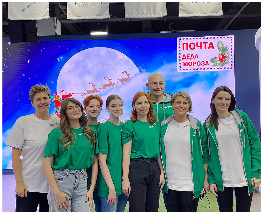
Преподаватели и студенты на ВДНХ, 2023 г.