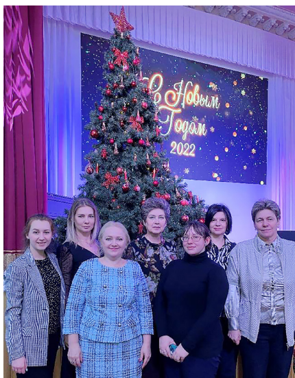
Деканат факультета подготовки УНК