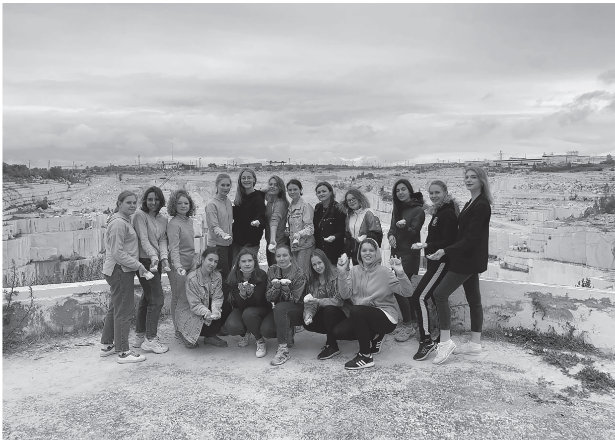
Студенты на учебно-полевой практике