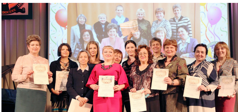
Награждение кафедры педагогики, психологии и предметных методик