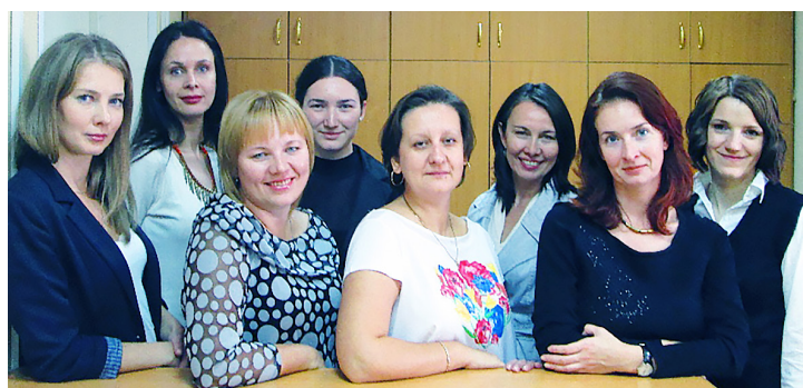
Выпускники факультета, работающие в ЮУрГГПУ