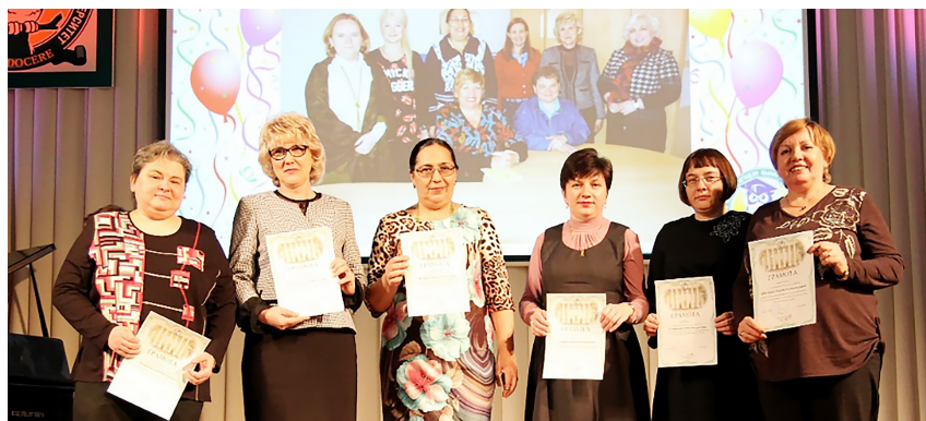
Награждение кафедры русского языка, литературы и МОЯиЛ