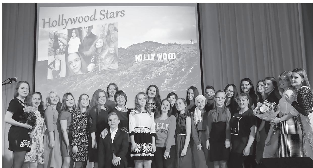
Участники Фестиваля культуры стран изучаемого языка