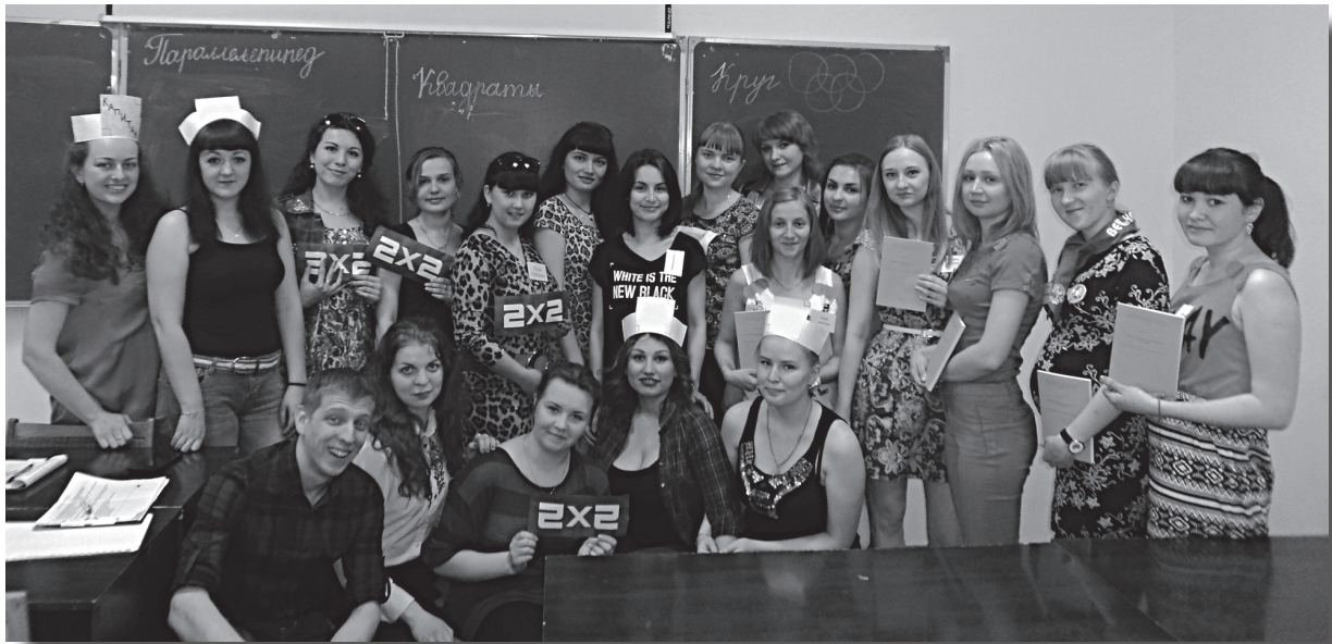
Турнир эрудитов «Знатоки методики обучения математике в начальной школе». 2016 г.

становятся победителями и лауреатами всероссийских конкурсов курсовых и квалификационных работ.