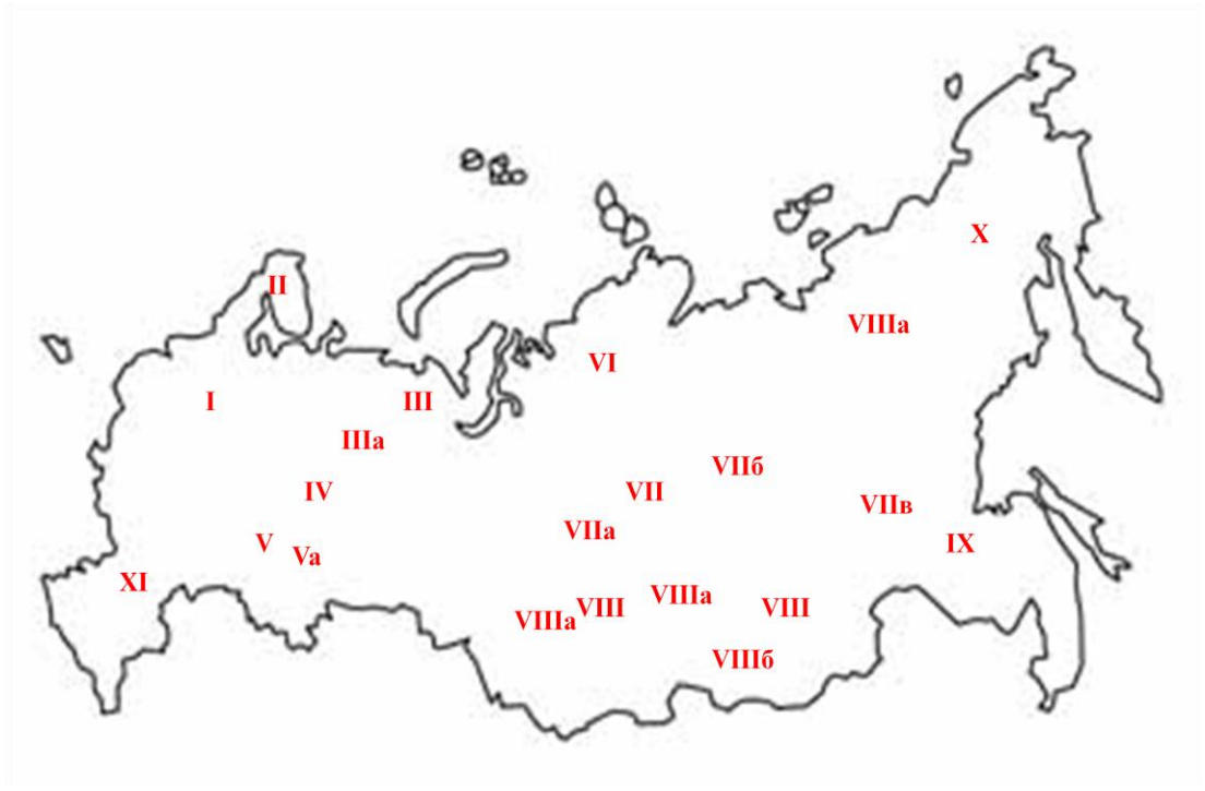
Рис. 1 Схема размещения рудоносных комплексных провинций и мономинеральных субпровинций камнесамоцветного сырья на территории России (составлено автором на основе анализа литературных источников, 2017 г.)