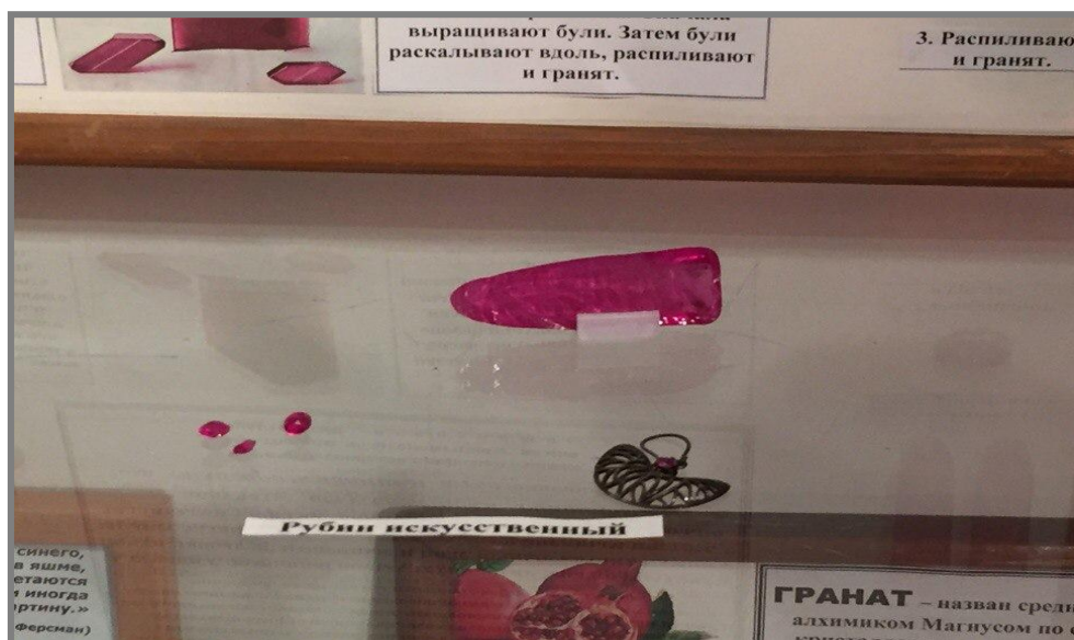
Рис. 3 Синтетический рубин, фонды краеведческого музея г.Соликамска.

Чем дороже камень, тем сильнее проявляются в его стоимости и распространенности, отмеченные выше особенности драгоценного камня. Для таких элитных камней очень сложно составить технические условия и, соответственно, не могут быть подсчитаны сколько-нибудь достоверные запасы балансового камня (использование которого экономически целесообразно) – возможны только очень приблизительные прогнозы. Поисковые и разведочные работы непосредственно переходят в добычные, поскольку каждое «месторождение» весьма невелико по размеру (иногда это отдельное гнездо или полость-занорыш с кристаллами) и должно быть выработано сейчас же после его открытия. Обнаруженные запасы ставятся на баланс и сразу же списываются, как фактически добытые. Расходы на «поиски» месторождений обычно превышают стоимость «добычи» во многие десятки раз [10,11].