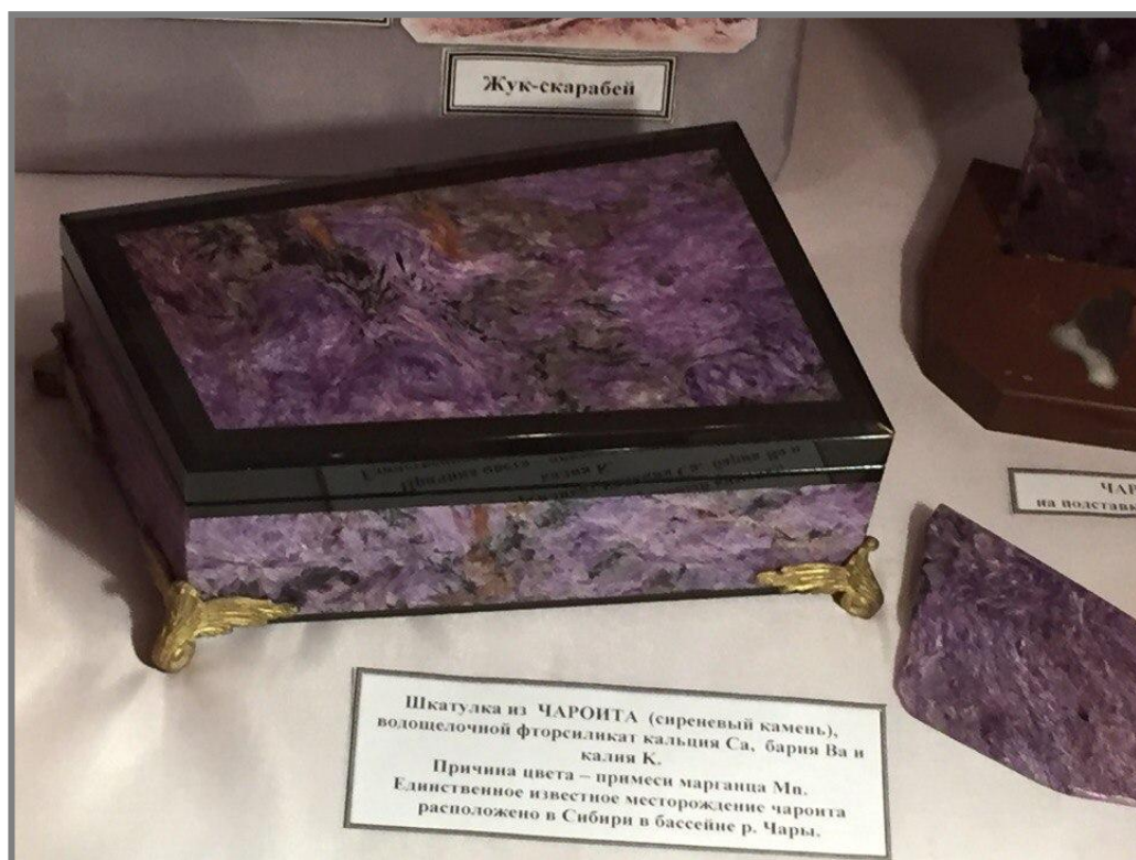
Рис. 4 Шкатулка из чароита, фонды краеведческого музея г.Соликамска.

Добыча чароита в настоящее время лимитирована. Ежегодно его добывается не более ста тонн, иначе при превышении добычи возможно истощение запасов. Этот редкий самоцвет даже будучи необработанным может стоить свыше ста долларов за килограмм.