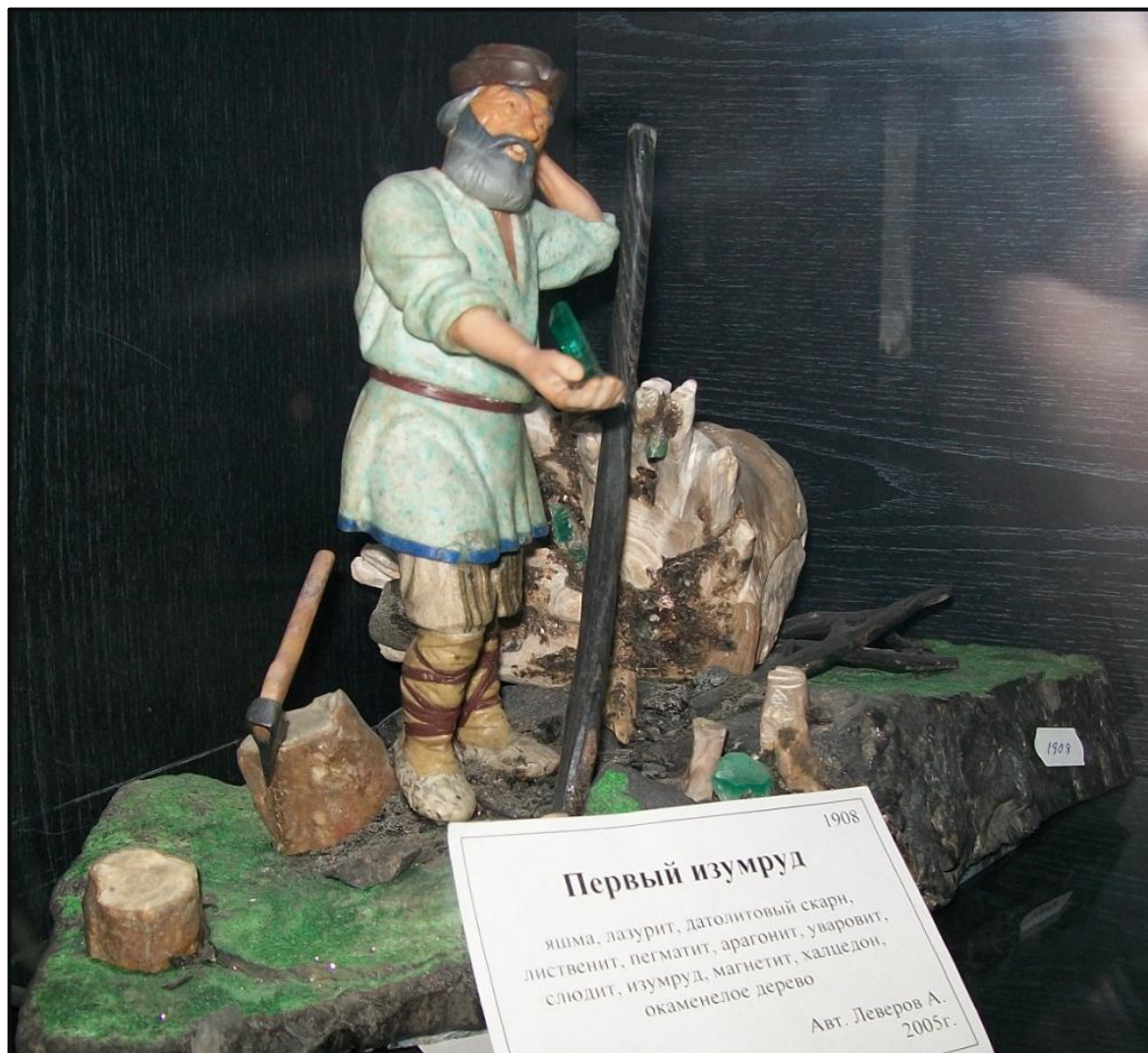
Рис 2. Композиция из камня «Первый изумруд», автор А. Леверов, фонды Уральского минералогического музея В.А. Пелепенко, г. Екатеринбург (фото автора, 2013г.).

С этого момента начинается отсчет сложной судьбы российского изумруда и александрита.