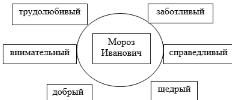
Рисунок 2 – Пример готовой блок-схемы

Младшим школьникам предлагается в группах заполнить пустую блок-схему словами, обозначающими нравственные представления, которыми обладал Мороз Иванович в сказке В. Одоевского (Приложение Д). Проверка осуществляется фронтально. Выбирается наиболее удачные варианты ответов и составляется единая схема (рисунок 2).