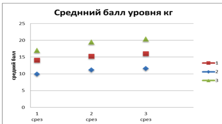
Рисунок 1 - Уровень художественно-эстетического развития контрольной группы старших дошкольников

Представленные данные по трем показателям пяти групп (КГ, ЭГ1, ЭГ2, ЭГ3, ЭГ4) художественно-эстетического развития детей старшего дошкольного возраста на трех срезах (формирующий, констатирующий и обобщающий этапы), доказывают, что дети четвертой экспериментальной группы имеют наибольший средний балл по итогам проведенной работы на втором и третьем срезах. (рис.1, рис.2)