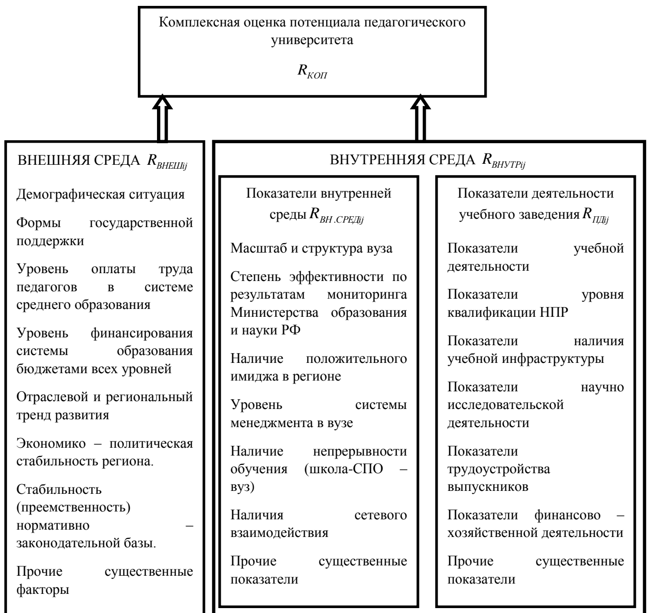
Рис. 2. Состав факторов комплексного потенциала педагогического вуза

Существенное влияние факторов внешней среды ( R_{ВНЕШij} ) на величину и динамику потенциала сложно переоценить. Демографическая ситуация в регионе влияет на возможный контингент обучающихся в университете, на потребность региона в