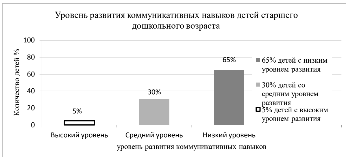
Рисунок 2 – распределение результатов диагностики развития коммуникативных навыков детей старшего дошкольного возраста по методике «Метод наблюдения» (по М. Я. Басову) на констатирующем этапе эксперимента

Критерии определения уровня развития коммуникативных навыков представлены в таблице 2.