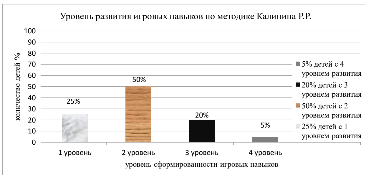
Рисунок 1 – распределение результатов диагностики развития игровых навыков детей старшего дошкольного возраста по методике «Определения уровня развития игровых навыков детей» (Автор Калинина Р.Р.) на констатирующем этапе эксперимента

Данные входного диагностического контроля по методике «Определения уровня развития игровых навыков детей (Автор Калинина Р.Р.)», показали, что у 5(25%) детей старшего дошкольного возраста с задержкой психического развития 1уровень развития игровых навыков. У 10(50%) детей 2 уровень развития игровых навыков. У 4(20%) детей 3 уровень развития игровых навыков. И всего у одного (5%) ребенка 4 уровень развития игровых навыков. Результаты исследования уровня развития игровых навыков детей старшего дошкольного возраста с задержкой психического развития в игровой деятельности представлены на рисунке 1.