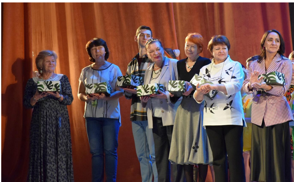
Рис. 31,32 – Педагогический коллектив Ансамбля танца «Детство»