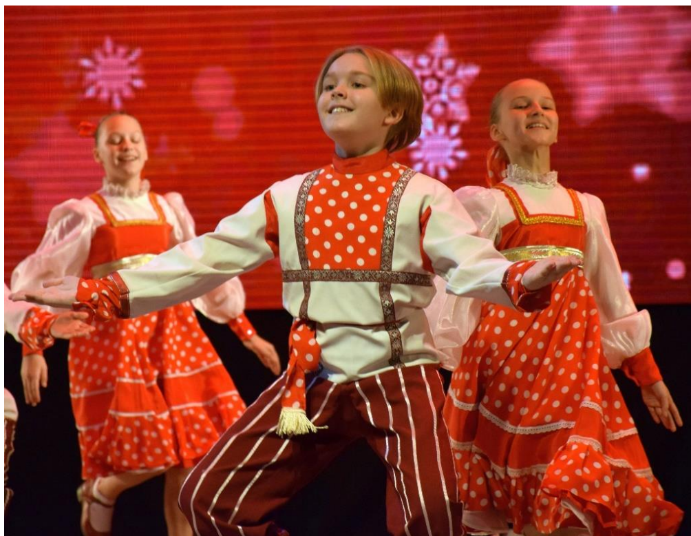
Рис. 36 – Ансамбль танца «Детство». Новогодний концерт «Созвездие детства»