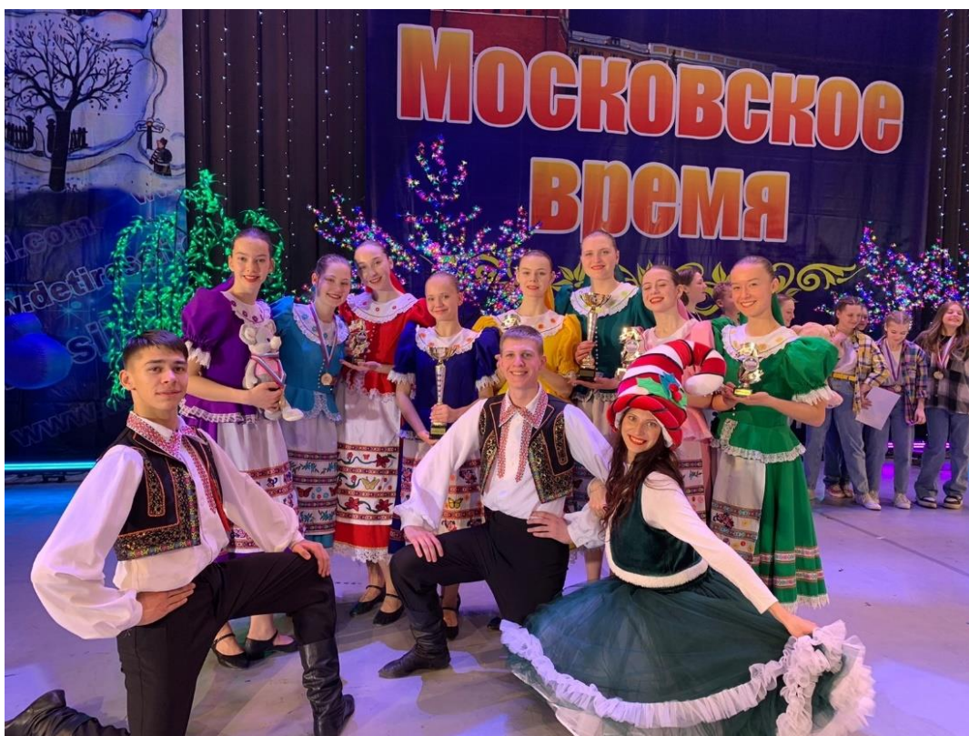
Рис. 34 – Ансамбль танца «Детство». Международный конкурс-фестиваль детского и юношеского творчества «Московское время»