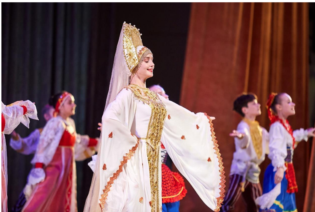
Рис. 40 – Ансамбль танца «Детство». Отчетный концерт «Сокровище Урала»