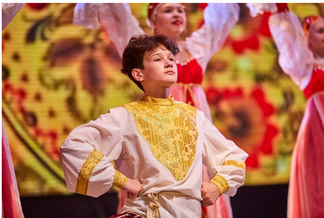
Рис. 41 – Ансамбль танца «Детство». Отчетный концерт «Сокровище Урала»