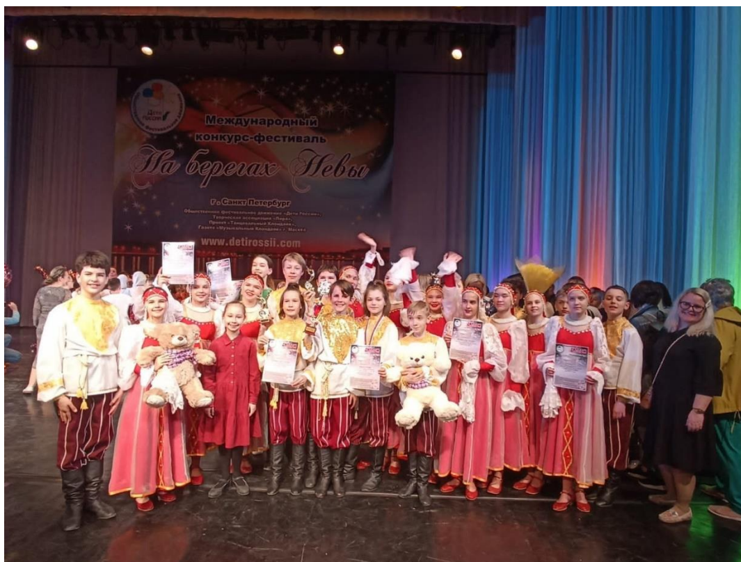
Рис. 37 – Ансамбль танца «Детство». Международного конкурса-фестиваля детского и юношеского творчества «На берегах Невы»