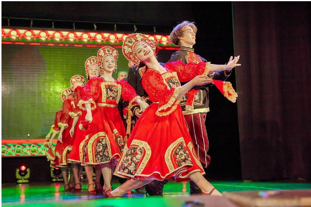
Рис. 38 – Ансамбль танца «Детство». Выступление Ансамбля на юбилее Детского театра имени Л.К. Диковского