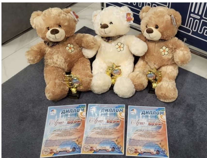
Рис. 30 – Дипломы лауреатов Международного фестиваля «Арт-воляж». Ансамбль танца «Детство»