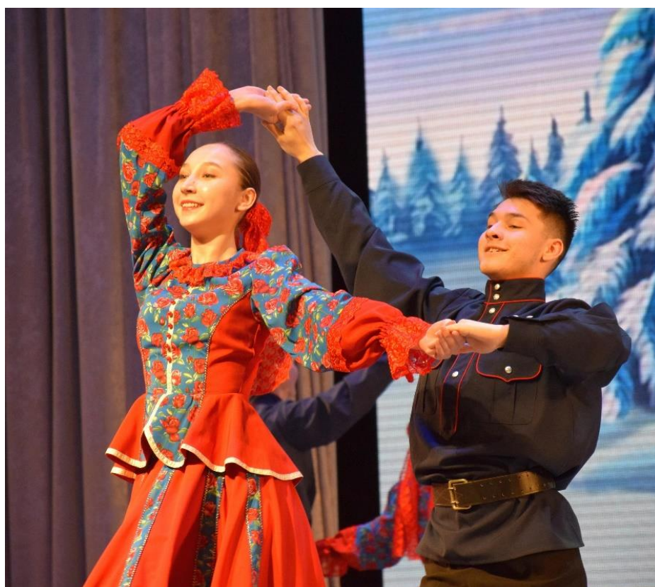
Рис. 35 – Ансамбль танца «Детство». Новогодний концерт «Созвездие детства»