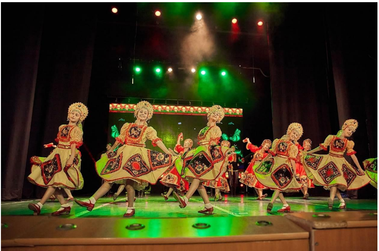
Рис. 39 – Ансамбль танца «Детство». Выступление Ансамбля на юбилее Детского театра имени Л.К. Диковского