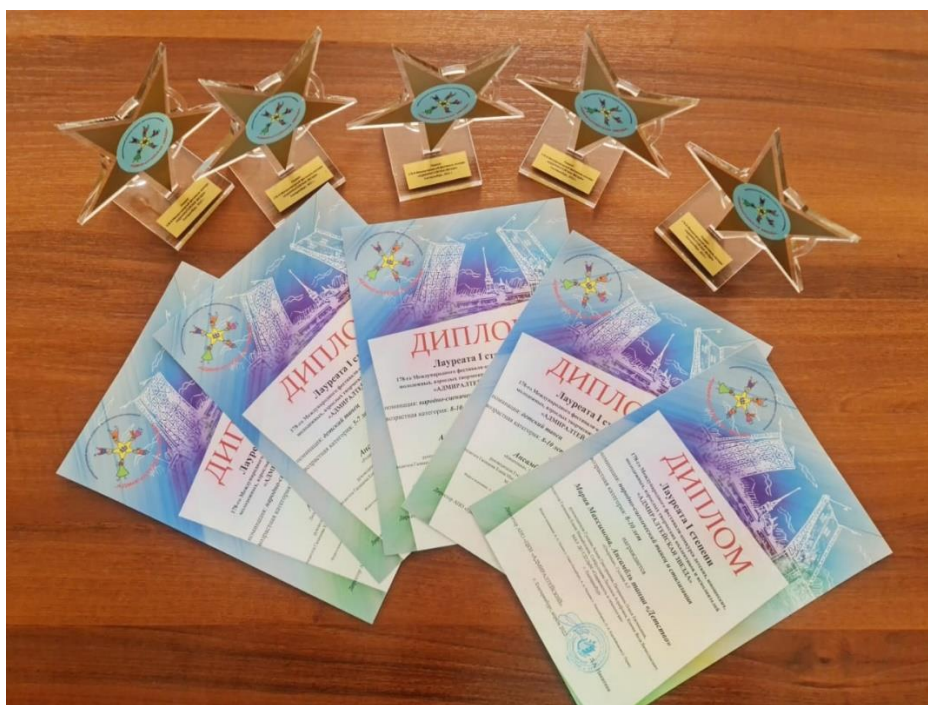
Рис. 29 – Дипломы лауреатов Международного фестиваля-конкурса детских, юношеских, молодёжных, взрослых творческих коллективов и исполнителей «Адмиралтейская звезда». Ансамбль танца «Детство»