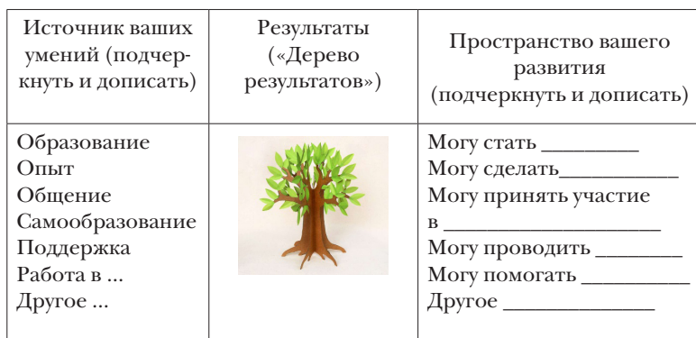
Таблица 27 – Составление вопросов

Тьютор предлагает составить вопросы, пользуясь таблицей. Потом выбрать один, с которым хочется работать. Такой прием хорошо использовать в группе, где все ясно с выбором. Можно использовать прием «Дерево».