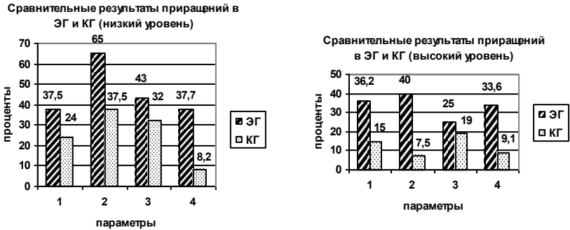
Рис. 2. Сравнительные результаты приращений в экспериментальной и контрольной группах (различия между величинами значений констатирующего и контрольного экспериментов)

Значительно возросло умение воспринимать качество поверхности предметов: дети, наряду со зрительным обследованием, активно подключают осязание в процессе ориентировочно-исследовательской деятельности. Отмечается значимая разница с КГ как на низком, так и на высоком уровнях, и составляет 27,5% и 32,5% соответственно.