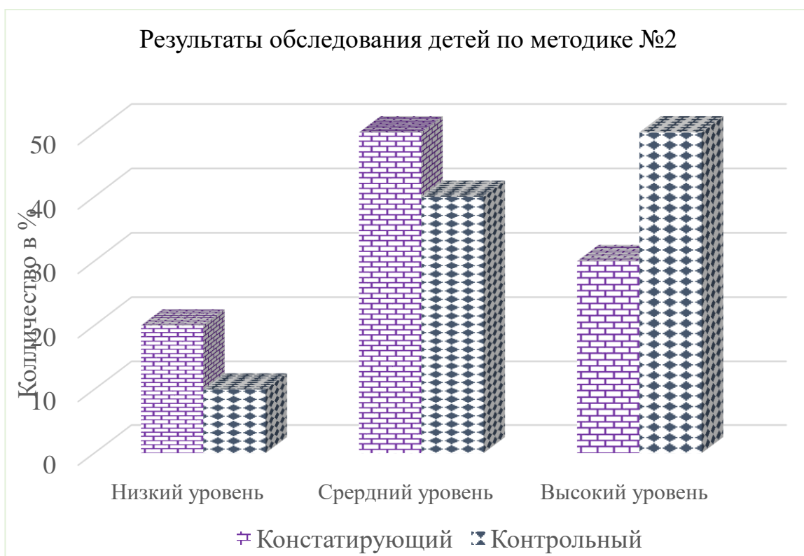
Рисунок 2 – Анализ результатов констатирующего и контрольного этапа эксперимента уровня сформированности патриотического воспитания детей старшего дошкольного возраста с общим недоразвитием речи по методике №2.

Сравнительные результаты выполнения заданий по методике №2, констатирующего и контрольного представлены на Рисунке 2.