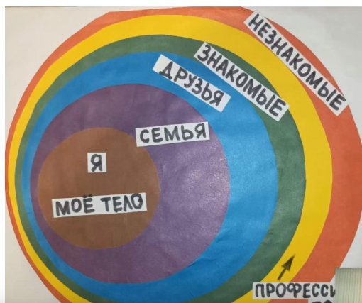
Рис. 1. Карта кругов отношений